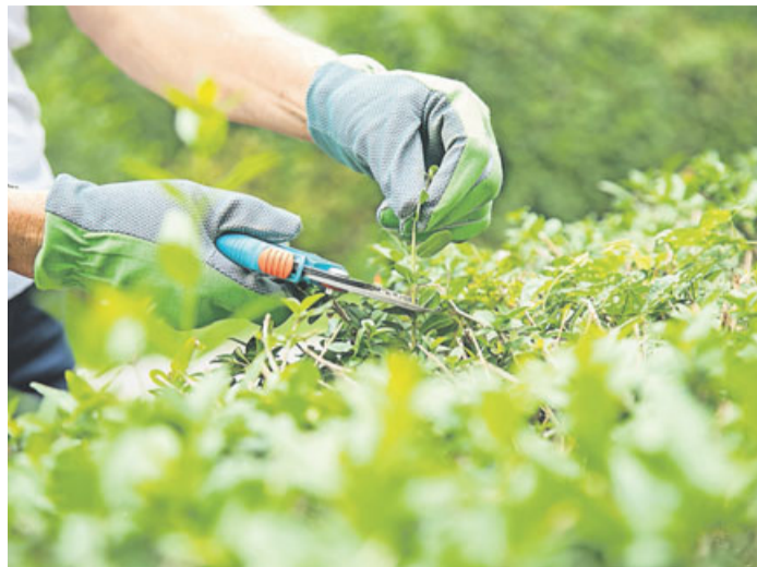
(Hobby-)Gärtner sollten jetzt ihre Hecken nochmals schneiden, damit sie sich auch im Winter von ihrer besten Seite präsentieren können.

Zunächst entfernen Sie am besten abgestorbene Triebe aus der Hecke, rät der Verband Deutscher Gartenbauschulen. Überlange Triebspitzen, die ihre Spitzen aus der Hecke recken, können Sie mit der Heckenschere trimmen. Vermeiden Sie aber harte Schnitteingriffe, rät die Experten. Denn kurz vor dem Winter können die Gehölze diese Wunden nicht mehr verschließen.