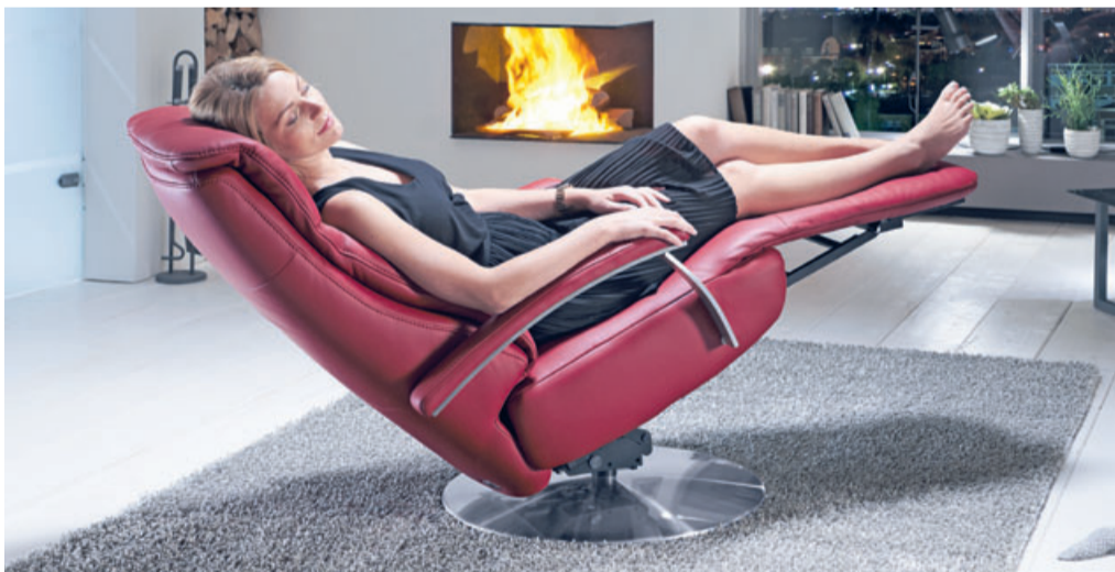
Endlich Feierabend – die Herz-Waage-Position ist Entspannung pur.

ausgestatteten Textilien erhalten. Natürlich sind die nach Ökotex 100 zertifizierten Bezugstoffe bei Polster Aktuell, schadstofffrei, dermatologisch getestet und lebensmittelecht. Auch die nach den Güterrichtlinien der deutschen Gerberschule in Reutlingen gefertigten und softig-warmen Leder mit dem Vitalife-Feeling besitzen diese alltagstauglichen Eigenschaften. Ihr Finish beruht nicht auf chemischer, sondern auf einer Mineralbasis. Der Fünf-Jahres-Fleckschutz gilt auch hierfür. cp