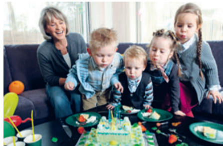
Ob Tortenschlacht oder Fiffies Heimkehr aus dem Park – schnell ist ein Fleck auf dem Sofa. Dank Hightechfasern ist er auch genau so schnell wieder weg.

Mit Mineralwasser gegen Kugelschreiber Wenn das Leben zu Hause also auf einem solch verlockend gemütlichen