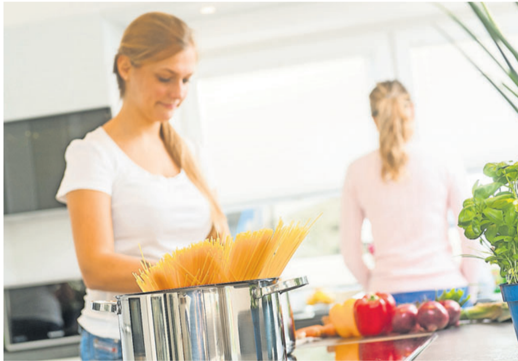
Lieber etwas mehr: Gerade im Homeoffice kann es sinnvoll sein, nicht nur eine oder zwei Portionen zu kochen.

Oft muss es in der Mittagspause schnell gehen. Wer derzeit viel im Homeoffice arbeitet, sollte aber darauf achten, dass die Ernährung trotzdem gesund, ausgewogen und vielseitig ist. Die Landfrauen im Bayerischen Bauernverband (BBV) empfehlen, einen Speiseplan für die Woche zu erstellen. So können Sie Reste besser verwerten, sich abwechslungsreich ernähren und Zeit sparen. Drei Tipps von den Expertinnen für eine schnelle Zubereitung: Tipp 1: Für zwei Tage kochen. Wer mehr Essen zubereitet, kann davon länger essen. Viele Gerichte, zum Beispiel Aufläufe, schmecken am nächsten Tag sogar noch besser. Wenn Sie die doppelte Portion Nudeln, Reis oder Kartoffeln ko-