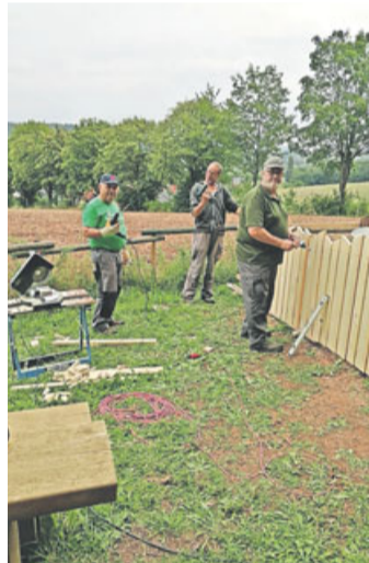
Die Gruppe Vogelschutz Sannerz bei der Arbeit.

Kürzlich hat ein ortsansässiges Unternehmen bei den Abrissarbeiten mit schweren Geräten und Arbeitskräften die Aktion unterstützt. Mit der Neugestaltung der Kinderstube des Waldes will die Gruppe Vogelschutz den Kinder zeigen, welche Arten von Bäumen den Klimawandel gerecht werden. In den Herbstferien sind alle Erstklässler von Sannerz, die in die Grundschule ein geschult wurden, zu einer Baumpflanzaktion eingeladen worden. Da der Vogelschutz nur eine kleine Gruppe von Menschen ist und über ein geringes Etat verfügt, ist sie