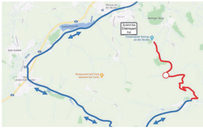
Der derzeitige L3196 Umleitungsplan.

Die Arbeiten an der Landesstraße konnten bislang genau nach Zeitplan durchgeführt werden. Kürzlich stand der Wechsel in den dritten und damit letzten Bauabschnitt an. Parallel dazu werden im zweiten Bauabschnitt noch Restarbeiten erledigt. Die Bautätigkeiten erstrecken sich auf den bisherigen Abschnitt zwischen dem Erlebnispark und dem Abzweig der