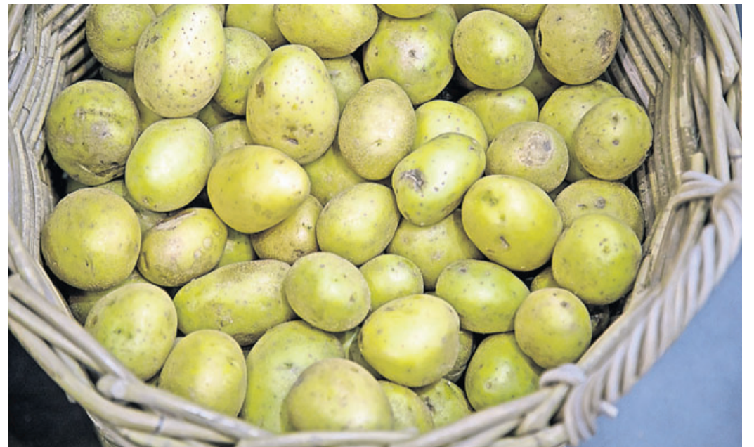
Wer Kartoffeln jetzt auf Vorrat kauft, riskiert bei den warmen Temperaturen in der Wohnung, dass sie schnell austreiben.

Ein Rezept, um zu viel gekaufte Kartoffeln rasch zu verbrauchen, sei beispielsweise Frittata. Für die Kombi aus Bratkartoffeln und Omelette werden Kartoffelscheiben bissfest gekocht. Sie kommen zusammen mit ver-