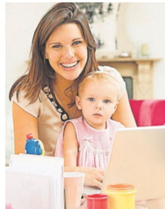
Wer beispielsweise nach der Elternpause zurück in den Job will, benötigt für eine Weiterbildung spezielle Voraussetzungen.

Im Finanz- und Rechnungswesen beispielsweise ist eine kontinuierliche Weiterbildung besonders wichtig –