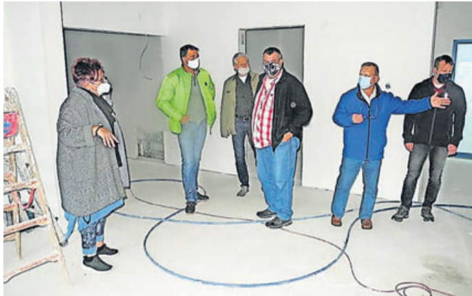
Mitglieder der BBB bei der Ortsbesichtigung des Kindergartens in Gundhelm.