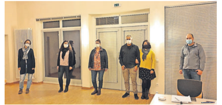
Der neugewählte Vorstand.

Das Blockhaus war in 2019 insgesamt 121 Tage mit 1401 Übernachtungen belegt – das sind 201 Übernachtungen weniger als in 2018. In 2019 gab es insgesamt 628 Anreisen. Im letzten Jahr gab es sechs kirchliche Gruppen, neun Schulgruppen, fünf Sportgruppen/Internetgruppen, 17 Familien/Freunde Treffen,