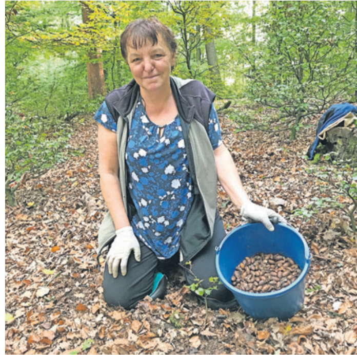
Eine Sammlerin bei der Arbeit.

Er halte es für wichtig, dass diesen Menschen ein hohes Maß an Wertschätzung entgegen gebracht wird, sagte der Förster. Ihre Arbeit bilde schließlich die Grundlage für