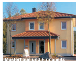
Musterhaus und Firmensitz