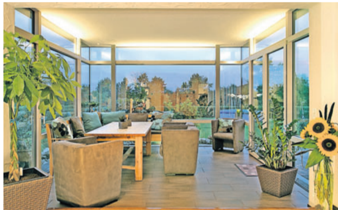
Der Wintergarten als Luxuszimmer: Man braucht es eigentlich nicht unbedingt. Aber wer einen hat, möchte ihn nicht mehr missen.

Welcher Platz am Haus der richtige ist, hängt von den individuellen Gegebenheiten ab. „Besonders warm und