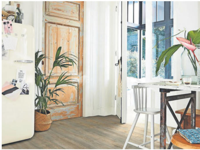
Kratzer und Kerben: Shabby Chic: