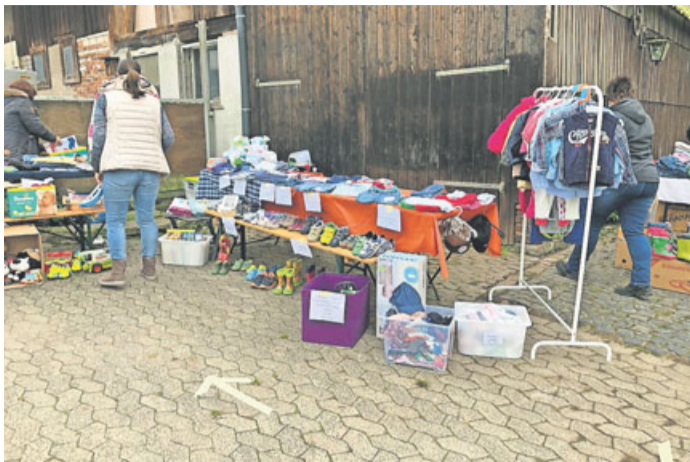
Flohmarkt rund ums Thema Kind in Steinau.

Rund ums Thema Kind unter Hygienemaßnahmen