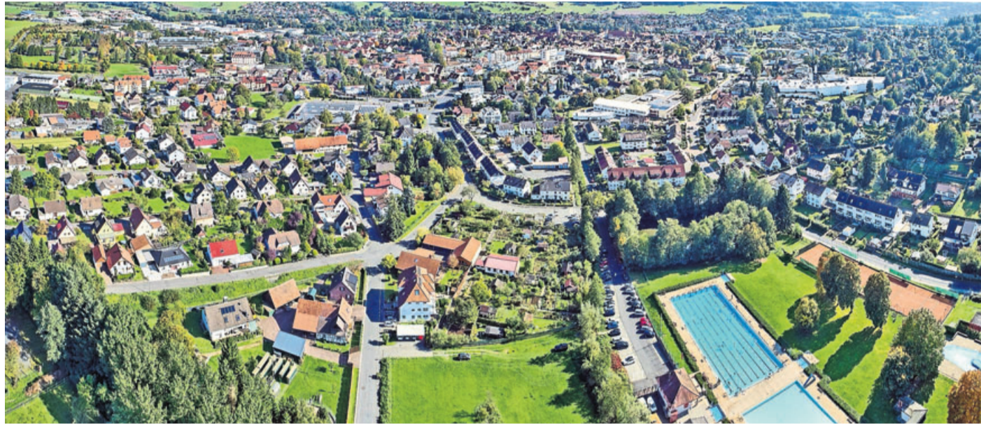
Schlüchtern von oben.

Neuhof. Aufgrund der Beschlüsse der Hessischen Landesregierung vom 29. Oktober zur Bekämpfung der Corona Pandemie, hat der Vorstand des Rhönklub Zweigvereins Neuhof beschlossen bis auf weiteres keine Wanderungen mehr durchzuführen und alle geplanten Veranstaltungen abzusagen.