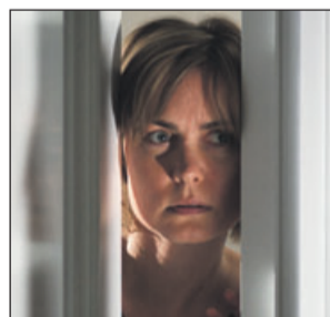
Bronny Taylor (Radha Mitchell) versucht herauszufinden, wer oder was für die bedrohlichen Vorgänge in ihrem Haus verantwortlich ist.