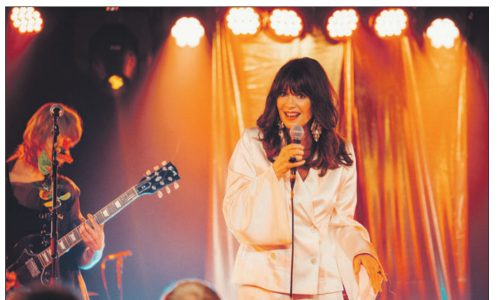
Sie ist wieder da. Offensichtlich genießt Simone Mankus (Iris Berben) nach einer längeren Pause die Bühnenluft. In der ZDFmediathek ist „Nicht tot zu kriegen“ bereits ab Montag, 3. August, 10 Uhr, abrufbar.

ehemaligen Fans vergessenen, aber nie aufgebenden Diva Simone Mankus fügt Iris Berben ihrer schauspielerischen Palette einen weiteren nuancierten Charakter hinzu. Der Fernsehfilm der Woche mit dem Titel „Nicht tot zu kriegen“ beginnt um 20.15 Uhr.