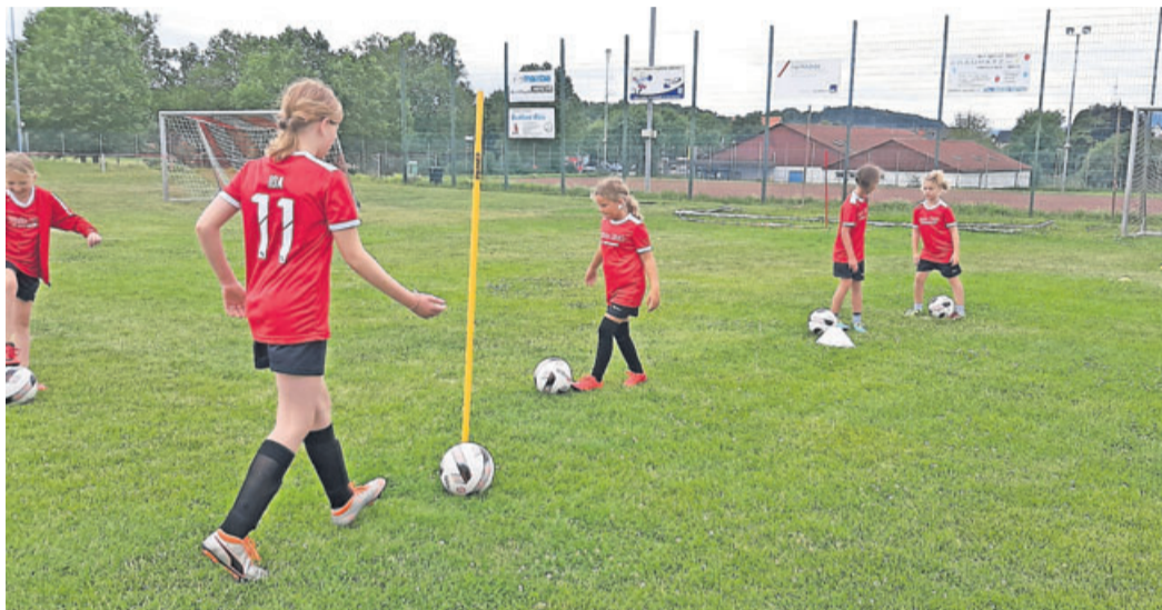
Auf dem Programm der 22 Mädchen standen unter anderem Pass- und Dribbelübungen.

Mit viel Mühe trafen die Verantwortlichen rund um Bender die Vorbereitungen. Angefangen mit den extra angeschafften mobilen Handwaschbecken, personalisierten Sitzplätzen, mit Namen versehenen Hütchen, die mit Abstand auf den Platz gelegt wurden, der als täglicher Treffpunkt mehrmals am Tag angesteuert wurde. Die 22 Mädels zwischen sechs und 13 Jahren trainierten das komplette Wochenende getrennt in zwei Gruppen. Beide Teams hatten jeweils einen Ort auf dem Sportplatz, der von keinem anderen be-