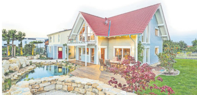
Das Heim punktet mit mehr Wohnfläche und Gestaltungsfreiheit.

Gerade eine eigene Immobilie steht hoch im Kurs: 76 Prozent der Befragten wünschen sich ein Eigenheim. 91 Prozent derer, die ein Eigenheim besitzen, sind mit ihrer Entscheidung zufrieden. Allen voran die größere Wohnfläche von durchschnittlich 146 Quadratmetern gegenüber 77 Quadratmetern in einer Mietwohnung wird geschätzt. Die meisten Menschen wünschen sich ein Eigenheim und sehen die Vorteile, sie scheu-