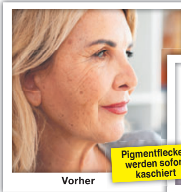
(Anwendungsfall nachempfunden, Name geändert)

Zahlreiche Betroffene vertrauen auf Lentisol. So berichtet z. B. die Anwenderin Maria S.: „Ich bin wirklich begeistert, verwende die Creme seit ungefähr 2 Wochen, deutliche Verbesserung des Hautbildes! Hab’ schon so viel ausprobiert, endlich mal eine Creme, die hält, was sie verspricht! Tolles Produkt!“