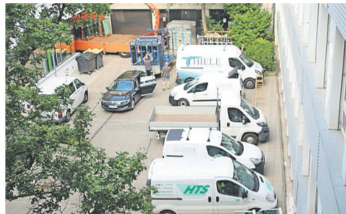
Zahlreiche Baufirmen arbeiten aktuell auf dem Schulgelände.

Bad Nauheim. Für Passanten des Bad Nauheimer Eleonorenrings ist sofort erkennbar: An der Sankt Lioba Schule tut sich was. Zahlreiche Baufirmen nutzen die Sommerferien, um unter Hochdruck das Sanierungsprojekt des Bistums Mainz voranzutreiben. Der Schulhof steht voll mit Baufahrzeugen, aus dem rückwärtigen Gebäude sind Bohr- und Hammergeräusche zu hören. Als Schulträger ist das Bistum der Auftraggeber für die auf rund sieben Millionen Euro veranschlagten Erneuerungsarbeiten, die noch über ein Jahr andauern werden.