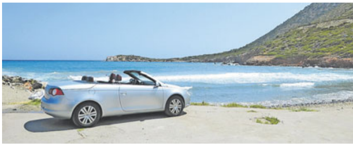
Mietwagen: Experten empfehlen eine Vollkasko-Versicherung mit Diebstahlschutz ohne Selbstbeteiligung.

Optimal ist die Tankregelung „full-to-full“: mit vollem Tank abholen und mit vollem Tank