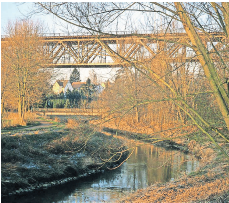
Niddabrücke bei Assenheim.

Der Wetteraukreis ist ein sportfreundlicher Kreis. Mehr als 100.000 Freizeit- und Leistungssportler frönen in mehr als 400 Sportvereinen ihrem Hobby.