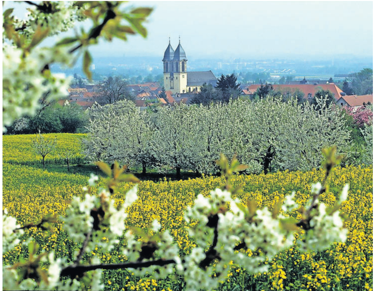
Kirschblüte in Ockstadt.

Nach der Gebietsreform nahm der neue Wetteraukreis eine rasante Entwicklung. Besonderer Schwerpunkt sind die Kommunen entlang der beiden Autobah-