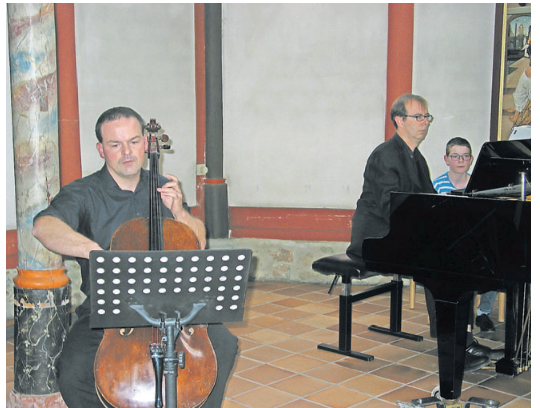
Künstlerkonzert der Musikschule Butzbach.