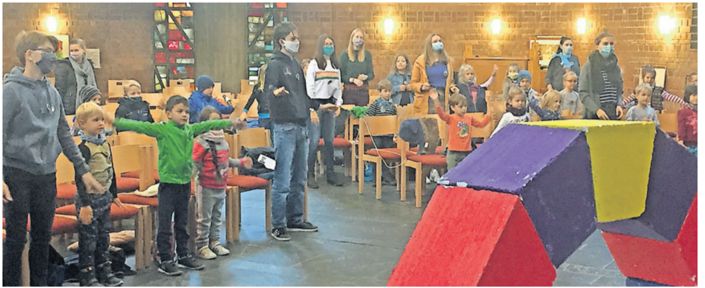
Die Kinder machen begeistert mit.