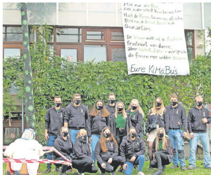
Die Kirmesburschen und -mädchen bei der Baumaufstellung.

Für die nötige Sicherheit sorgten extra angefertigte Mund-Nasen-Bedeckungen. Der schwarz gestrichene Baum war mit grünen Corona-Viren, Desinfektionsmittel und Masken geschmückt. Zusätzlich wurde noch ein großes Plakat an der Halle gehisst, mit der Hoffnung 2021 wieder gemeinsam feiern zu können. Nach Aufstellen des Baumes begab sich das Maskottchen „Bernd Bursch“ umgehend in Quarantäne und der Schwan zog mit seiner Fischerin, seit Jahrzehnten der Kirmeshit in Berstadt, frustriert von dannen. Auch die Vereinsgemeinschaft hofft im nächsten Jahr wieder eine Kirmes ausrichten zu dürfen.