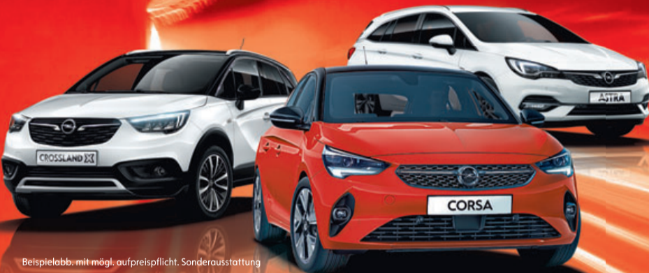
Beispielabb. mit mögl. aufpreispflicht. Sonderausstattung

IHR PREISVORTEIL JETZT bis zu 1) 4.874,41 €