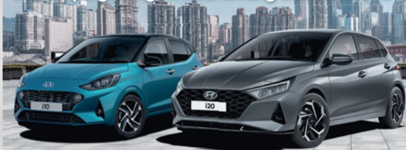
Hyundai i10 Pure Benzin 1.0 mit 49 kW (67 PS) Neuwagen

Jetzt supergünstig in Anschaffung und Unterhalt!