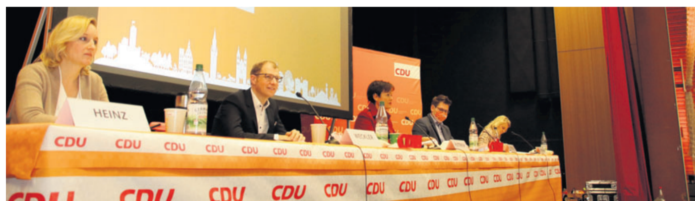
Die Wetterauer Union geht mit Landrat Jan Weckler (2.v.l.) an den Start um Mandate im kommenden Wetterauer Kreistag. Im Gegensatz zu ihrem Koalitionspartner im Kreis, die SPD, hielt sich die CDU mit Kritik an diesem zurück.