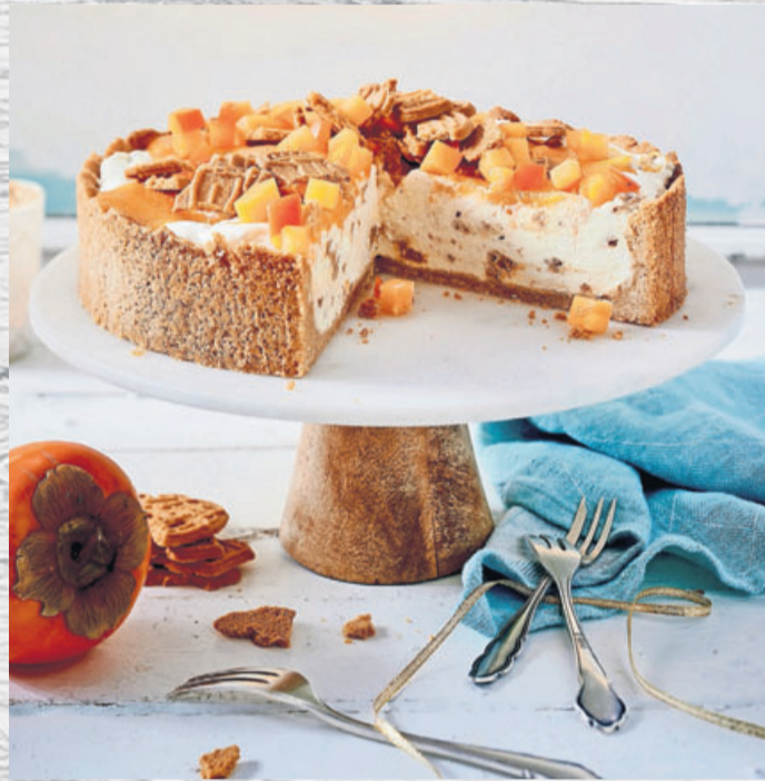
Toller Hingucker beim Adventskaffee.

50 g Spekulatius fein mahlen. Mit Mehl, 125 g Zucker, Backpulver, Butter, Ei zu glattem