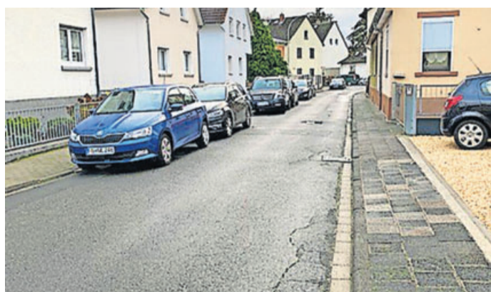
Die Fahrbahn inklusive Kanal und Gehweg soll saniert werden.