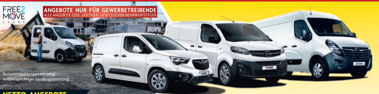
Beispielabbildungen mit mögl. aufpreispflichtiger Sonderausstattung

Kraftstoffverbrauch der beworbenen Modelle komb. 4,8-4,1 l/100 km, CO 2 -Emissionen komb. 109-93 g/km. Energieeffizienzklassen B-A. www.opel-nau.de