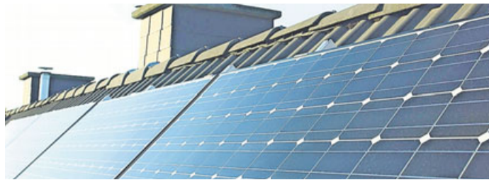
Mit einem Bauspardarlehen lassen sich viele technische Extrawünsche erfüllen.

Wer Geld in einen Bausparvertrag anlegt, kann seinen Traum von den eigenen vier Wänden mit einem zinsgünstigen Darlehen finanzieren - das wissen die meisten. Doch neben Kaufen und Bauen gibt es noch viele weitere Vorhaben, die mithilfe eines Bauspardarlehens realisiert werden können. Einzige Voraussetzung: Das Geld muss für eine wohnwirtschaftliche Maßnahme verwendet werden. Mit einem Bauspardarlehen lassen sich viele technische Extrawünsche erfüllen: Alarmanlagen für ein erhöhtes Gefühl von Sicherheit oder auch Fahrstühle beziehungsweise Treppenlifts für mehr Mobilität im Alter sind ebenfalls Optionen. Sogar der Kabelanschluss