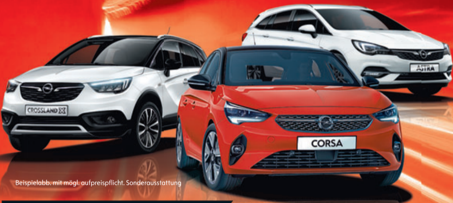
Beispielabb. mit mögl. aufpreispflicht. Sonderausstattung