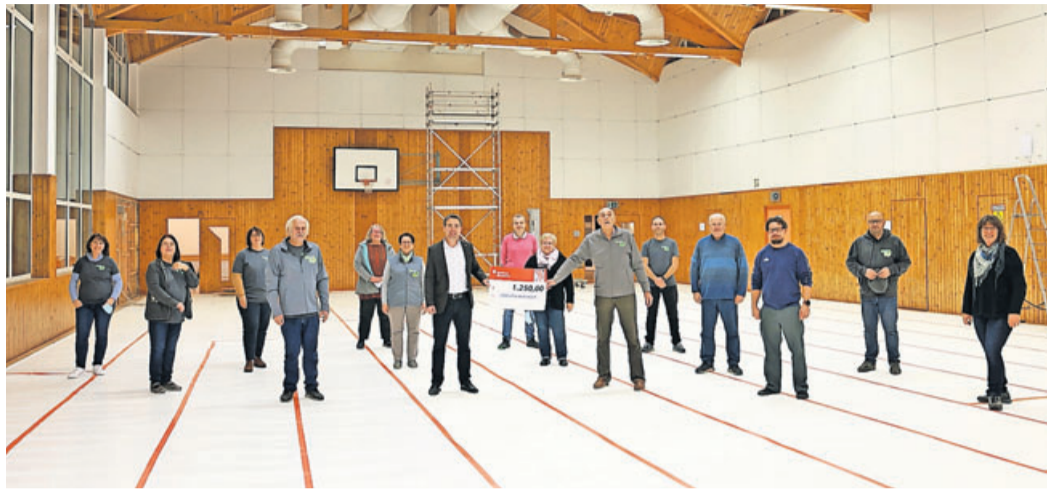
Übergabe der Spende im Rahmen einer Sitzung in der Wohnbacher Turn- und Sporthalle.

Wohnbacher Bürger planen das kommende Jubiläum