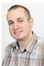
Kai Hergenröther Druckereiverwaltung