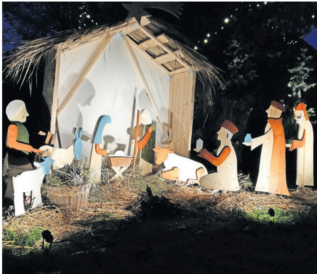
Am Valence-en-Brie-Platz in Rendel wurde eine Krippe mit großen Holzfiguren aufgebaut.