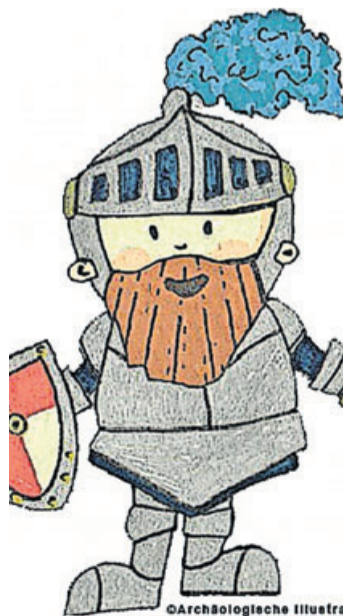
„Gambi“ als Ritter in der Stauferzeit auf der Burg Münzenberg.

Münzenberg. „Glockenbechermann Gambi“ ist eigentlich im Gambacher Heimatmuseum zu Hause. Doch nun hat der über 4.000 Jahre alte Urgambacher seine gläserne Ruhestätte im Obergeschoss des Alten Rathauses verlassen und erkundet seine neuzeitliche Heimat. Gambis Erkenntnisse sind in einem Wimmelbuch „dokumentiert“. Auf 14 Seiten führt er die Leser durch die Stadt Münzenberg mit all ihren Stadtteilen. Im Wimmelbuch gilt es die zahlreichen Besonderheiten, Eigenarten und viel Wissenswertes über die Stadt, ihre Geschichte und ihre Bewohner zu entdecken. Auch Liebhaber der Burg und der Natur rund um die Stadt kommen auf ihre Kosten. Geschickt sind die markantesten Aspekte der Stadt detail-