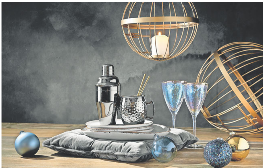
Mehr ist mehr - das gilt besonders zur Weihnachtszeit. Butlers setzt dabei unter anderem auf Glitzern und Opulenz. Schön festlich und trotzdem modern.