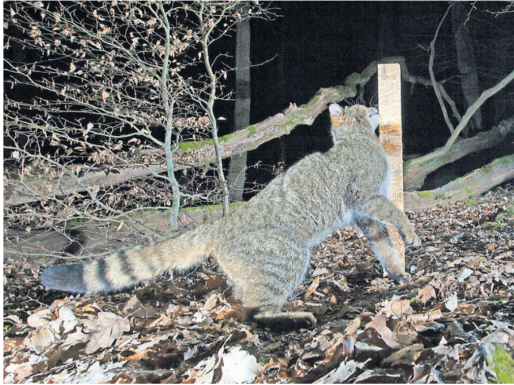
Eine der seltenen Wildkatzen im Butzbacher Wald.