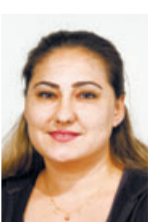
Navruz Koc Weiterverarbeitung