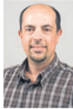
Frank Dietz Anzeigenabteilung