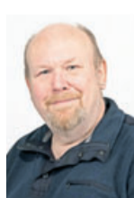
Peter Mayer Redaktion