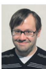
Jens Kirschner Redaktion