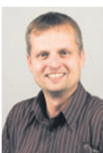
Michael Heil Redaktion