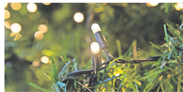
LED-Lichterketten sparen im Vergleich zu herkömmlichen Lämpchen viel Strom. Das macht sich am Ende des Monats auch auf der Stromrechnung bemerkbar.

Glühlampen-Lichterkette 16,6 Kilowattstunden. Dafür müssten man - auf Grundlage eines durchschnittlichen Strompreises von rund 28 Cent pro Kilowattstunde - 4,65 Euro bezahlen. Die LED-Lichterkette hingegen benötigt im gleichen Zeitraum nur 1,7 Kilowattstunden, die Stromkosten liegen dann bei 0,48 Euro. Auch zur Stromersparnis haben die Experten ein Rechenbeispiel: Verwendet man anstatt herkömmlicher Lämpchen LED, könnte man im gleichen Zeitraum 15 Mittagessen für vier Personen auf einem Elektroherd kochen, mehr als sieben Stunden mit einem Dampfbügelisen bügeln oder sich an jedem Abend drei Stunden auf einem 55-Zoll-LED-Fernseher etwas anschauen.