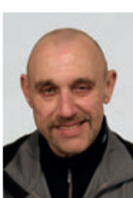
Raimund Knapp Versand