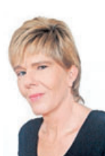
Petra Lückel Redaktion