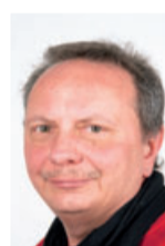
Reiner Kaufmann Weiterverarbeitung