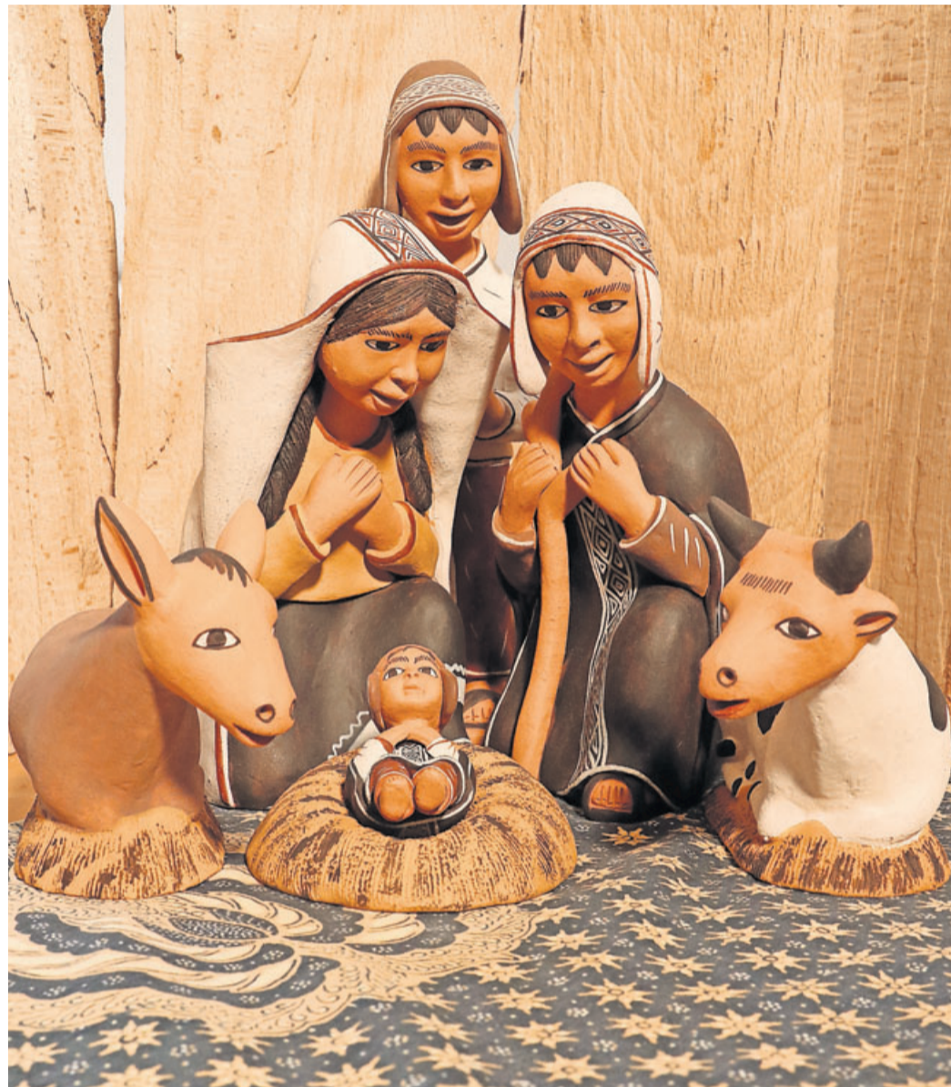
Weihnatskrippe aus Peru.

Und das ist die gute Nachricht: Auch wenn vieles in diesem Corona-Jahr ganz anders ist als sonst: Es wird trotzdem Weihnachten! Denn das Wichtigste an Weihnachten hängt nicht an uns. Gott lässt es Weihnachten werden. Gott kommt zu uns, schenkt uns im Christuskind Hoffnung für diese Welt, bringt Frieden und Licht, gerade da, wo es besonders dunkel und schwer ist. Diese frohe Botschaft kann kein Virus aufhalten. Diese Botschaft dringt auch durch Atemschutzmasken, durch Sorgen und Traurigkeit, durch Mauern aus Einsamkeit und Gleichgültigkeit: „Euch ist