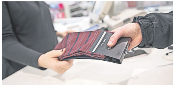
Wenn die Socken nicht passen, sind Kunden beim Umtausch auf die Kulanz des Händlers angewiesen.