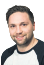
Philipp Franz Redaktion