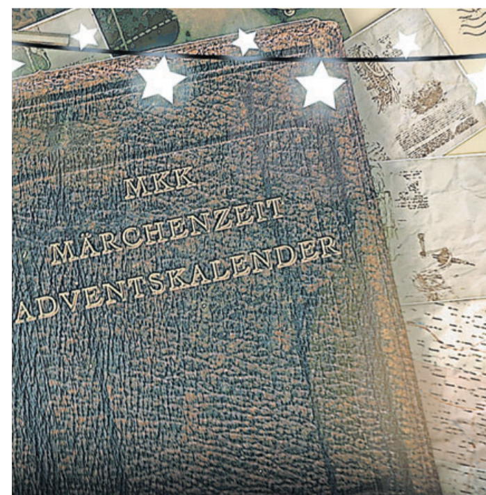
Die MKK-Adventszeit erfreut sich bei Jung und Alt großer Beliebtheit. Jeden Tag gibt es etwas zu gewinnen, dafür muss lediglich eine Frage aus dem jeweiligen Tages-Märchen richtig beantwortet werden.