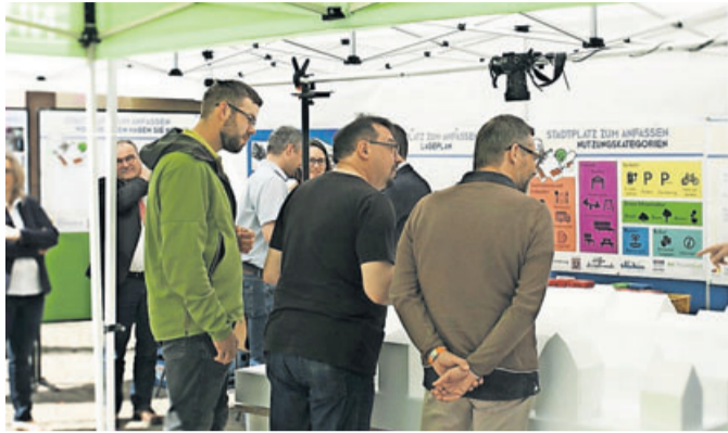
Zahlreiche Bürger beim Sandboxverfahren.

Das weiß ich. Das ist auch immer das Spannungsfeld, in dem man sich in einer pluralistischen Gesellschaft bewegt.“ Dass im Nachgang an eine umfassende Bürgerbeteiligung plötzlich aber der bereits geäußerte Bürgerwille infrage gestellt werde, verwundert den Bürgermeister dennoch. „Das halte ich für nicht besonders demokratisch. Wir haben innerhalb eines Zeitraums von drei Jahren versucht, so viele Interessengruppen wie möglich zu berücksichtigen. Wir haben Hunderte von Bürgern befragt, wir haben transparent kommuniziert und wollen jetzt genau die zusammengetragenen Wünsche umsetzen.“ Es sei einiges getan worden um herauszufinden, was auf dem Stadtplatz gewünscht ist. Es habe ein sogenanntes Sandboxverfahren während des Hellen Marktes gegeben, bei dem die Bürger aufzeigen konnten, was sie sich auf dem