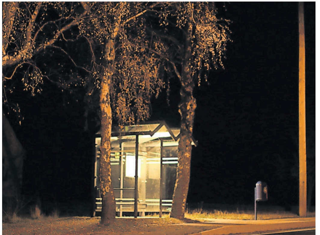
Das Buswartehäuschen Nüsterrasen in Hofbieber nach der Umrüstung.

LNG Fulda rüstet Beleuchtung an Buswartehäuschen um