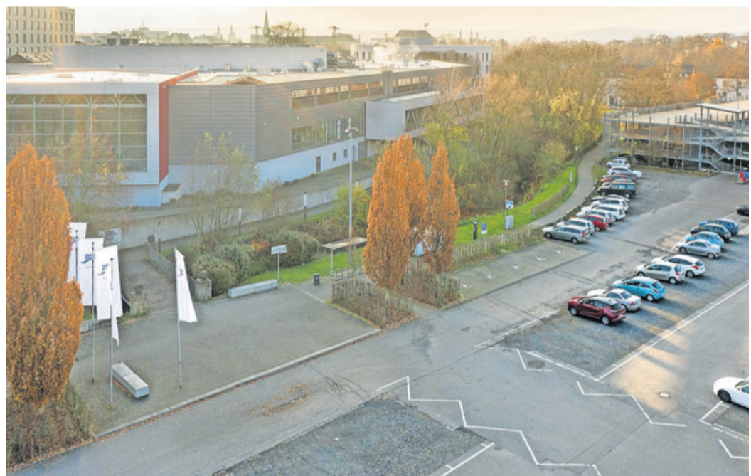
Das Corona-Impfzentrum Fulda wird in der Waideshalle des Kongress- und Tagungshotels Esperanto eingerichtet.

Zur Grundlage der Entscheidung für den Standort Esperanto zählen unter anderem die zentrale Lage, die gute Erreichbarkeit durch Bus und Bahn sowie die große Anzahl der Parkplätze. Zudem ist dort die Möglichkeit gegeben, die Einsatzkräfte unmittelbar zu versorgen. Darüber hinaus ist eine Erweiterung am Standort möglich, und alle logistischen Notwendigkeiten sind vorhanden. Ausführliche Informationen zum Impfzentrum Fulda gibt es online unter www.corona-fulda.de .