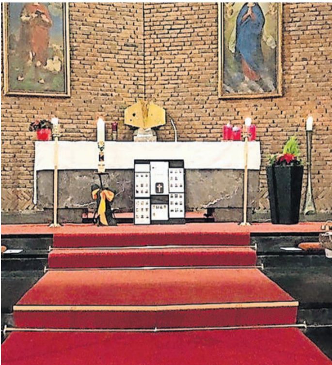
Altar mit Gedenktafel für die Toten und der Kolpingkerze.