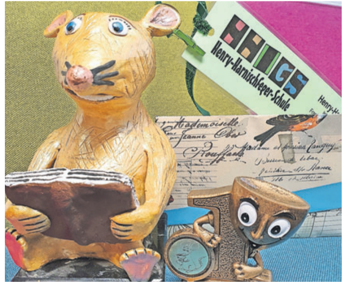
Die Preise für die Gewinner des Lesemarathons an der Henry-Harnischfeger-Schule.