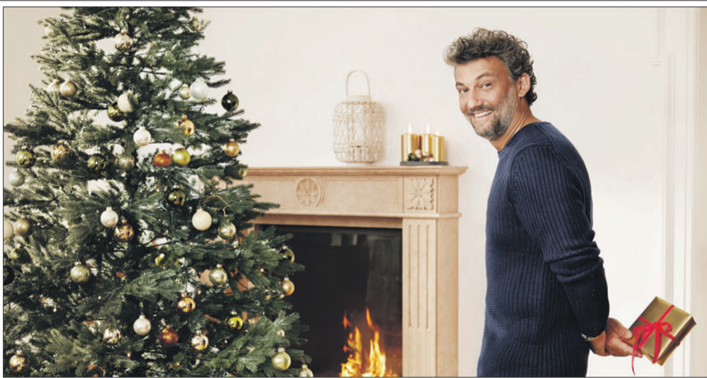
Startenor Jonas Kaufmann möchte die ZDF-Zuschauer bei einem Streifzug durchs Salzburger Land in weihnachtliche Stimmung versetzen.