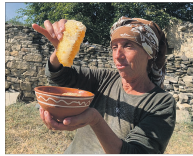
Die letzte Wildbienen-Imkerin Nordmazedoniens beschreibt, was Nachhaltigkeit und Klimawandel für ihr Leben bedeuten.

Im Mittelpunkt der Reportage von Wolf-Christian Ulrich stehen starke Frauen, zum Beispiel eine junge Kampfpilotin, die bereit ist, mit ihrem russischen MIG-Bomber die NATO zu verteidigen. Eine beeindruckende Begegnung hatte er zudem mit zwei jungen Geschäftsfrauen, die in Bulgarien ein IT-Startup hochziehen und sich vehement und intelligent gegen die Korruption im Land wehren.