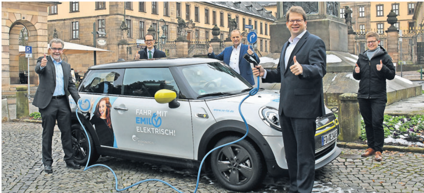
Die Fahrzeuge an ihren Standplatz mit einer extra dafür vorgesehenen E-Ladesäule am Bonifatiusplatz.