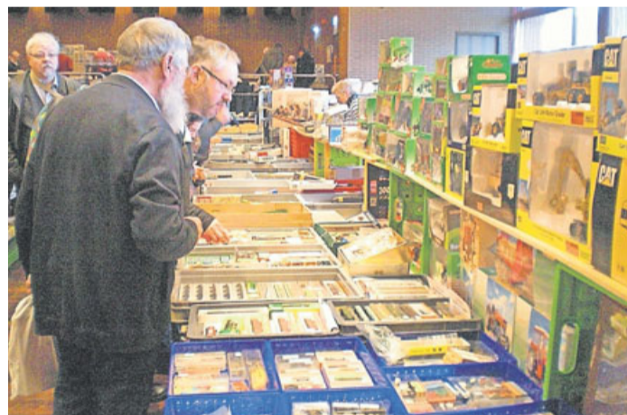
Alle Stände fanden das rege Interesse der vielen Besucher.