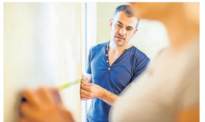
Schon vor dem Kauf des neuen Zuhauses können Interessenten Räume ausmessen und überprüfen, ob die angegebenen Maße stimmen.

Um sich abzusichern, nehmen viele Bauträger eine Toleranzgrenze zwischen zwei und fünf Prozent in den Kaufvertrag auf, so Feuersängers Erfahrung. Der Käufer muss dann Abweichungen der Wohnfläche bis zu dieser Grenze hinnehmen. „Das Beste für sie wäre, die Klausel streichen und eine Beschaffenheitsgarantie festlegen zu lassen. Dann muss der Bauträger die vertraglich vereinbarte Wohnfläche garantieren.“ Wegen der starken Nachfrage nach Immobilien sitzen die Käufer aber in der Regel am kürzeren Hebel. Eine andere Möglichkeit wäre, die Klausel aus dem Vertrag streichen zu lassen, ohne etwas anderes zu vereinbaren. Das ist aber riskant, er-