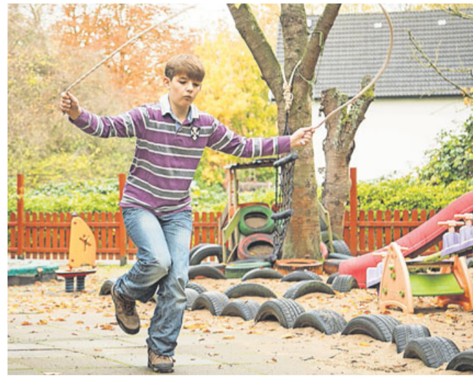
Im Park, auf dem Spielplatz oder einfach nur toben – aktiv sollten Kinder bei jedem Wetter sein.

Die Bundeszentrale für gesundheitliche Aufklärung (BZgA) empfiehlt in einer Broschüre zum Thema neben dem Sportverein etwa Fitness- oder Bewegungsapps, die Eltern gemeinsam mit dem Nachwuchs auswählen können. Auf Videoplattformen gibt es Kanäle mit Sportangeboten für zu Hause. Vielleicht findet der Nachwuchs ein Vorbild – das motiviert.