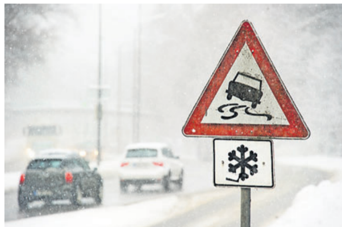
Bei Eis, Schnee und Glätte ist wegen des verlängerten Bremswegs zusätzlicher Abstand zu anderen nötig.

Egal, ob schon länger Schnee liegt oder es plötzlich glatt wird: Auf rutschigen Straßen ist wegen des verlängerten Bremswegs zusätzlicher Abstand zu anderen nötig. In solchen Situationen sei der sonst als Faustregel übliche halbe Tacho Abstand keinesfalls genug, warnt der TÜV Süd. Autofahrer sollten sich merken, dass mit jedem Meter zusätzlicher Distanz zu Vorausfahrenden die Reaktionsmöglichkeiten wachsen. Wer merkt, dass er auf glatter Straße zu dicht dran ist, sollte aber keinesfalls hektisch bremsen, sondern langsam vom Gas gehen – auch um den nachfolgenden Verkehr nicht zu gefährden. Ohnehin raten die Experten bei prekären Straßenverhältnissen, besonders vorausschauend zu fahren und heftige Lenkbewegungen sowie starkes Beschleunigen zu vermeiden. Beides vergrößere die Rutschgefahr. Insbesondere vor Kurven gelte es, die Geschwindigkeit zu reduzie-