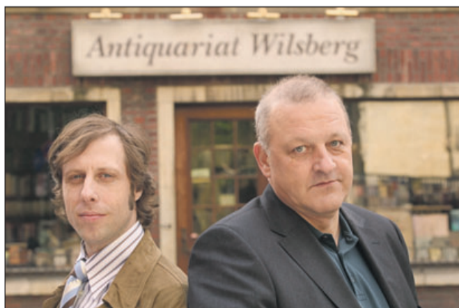
Legendäres Team: Georg Wilsberg (Leonard Lansink) und sein Kumpel Ekki (Oliver Korittke).