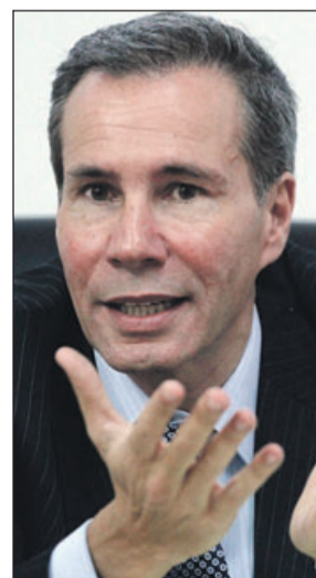
Starb am 18. Januar 2015 auf ungeklärte Weise: Staatsanwalt Alberto Nisman.

Thema ist der mysteriöse Tod des argentinischen Staatsanwalts Alberto Nisman, der im Jahr 2015 mit einem Kopfschuss aufgefunden wurde – einen Tag bevor er seine Ermittlungsergebnisse zu einem Bombenattentat öffentlich präsentieren wollte. Bei dem Anschlag im Jahr zuvor auf ein jüdisches Kulturzentrum in Buenos Aires waren 85 Menschen gestorben und mehr als 300 verletzt worden. Anscheinend gab es Drahtzieher aus Politik und Wirtschaft.