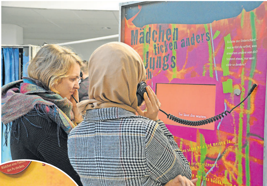
Die Ausstellung „Echt krass“, die aktuell im Berufsbildungswerk Karben zu sehen ist, ist interaktiv gestaltet. Es gibt Denkspiele, Hörbeispiele, kleine Videofilme und überall gibt es die Möglichkeit, selbst etwas zu erleben und eigene Erfahrungen zu machen.

Das Thema kommt nicht von ungefähr. Abwertendes Verhalten, verbale, sexualisierte Gewalt und Grenzverletzungen spielen im Umgang von Jugendlichen untereinander eine wichtige Rolle. Das ergab auch eine hessenweite Umfrage im Rahmen der Speak-Studie unter knapp 2.700 Schülern der Jahrgänge neun und zehn. Demnach haben 55 Prozent der Mädchen und 40 Prozent der Jungen mindestens einmal sexualisierte Gewalt erlebt – verbal, körperlich oder im Internet: sexuelle