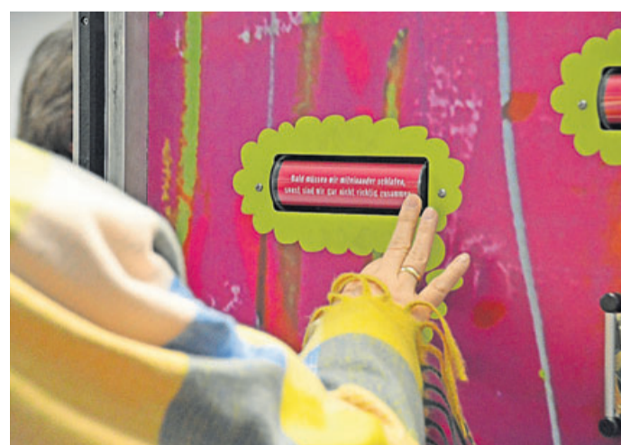
„Bald müssen wir miteinander schlafen, sonst sind wir gar nicht richtig zusammen“ – nur eine der Ängste und Zweifel, die Jugendliche rumtreibt.