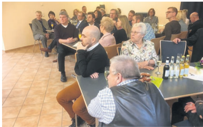
Über einen gut besuchten Neujahrsempfang freute sich der CDU-Stadtverband Münzenberg.

Neujahrsempfang der CDU Münzenberg richtet Blick auf kommende Herausforderungen