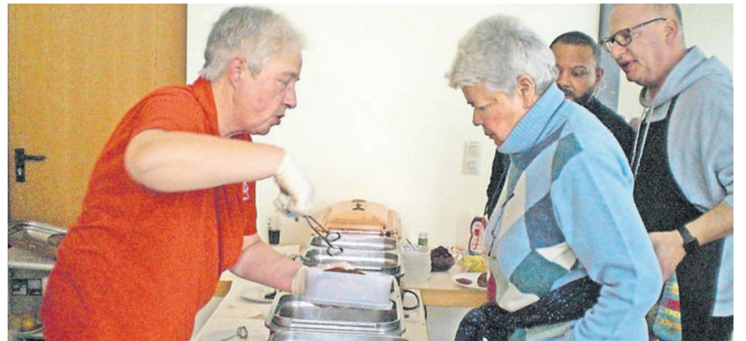
An der Essensausgabe wurde mit Freundlichkeit bedient.