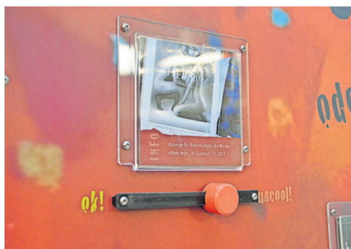
„Sex sells“, das gilt vor allem für Werbung. Teil der Ausstellung ist es auch, Anzeigen zu bewerten – der Grad zwischen „akzeptabel“ und „sexistisch“ ist oft gar nicht so leicht zu ziehen.