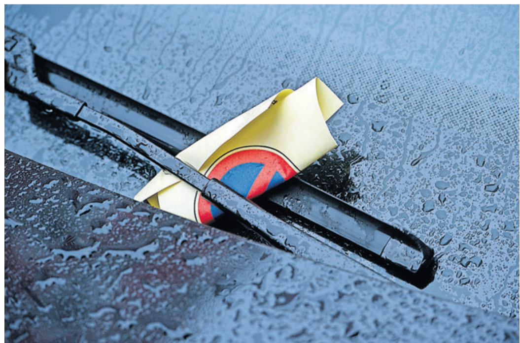
Strafzettel an der Scheibe: Für die Parkraumüberwachung ist in der Regel der Staat verantwortlich.

Bad Orb: Nähe Therme, 3 ZKB, 102 m², 2 Balkone, ab 01.03.2020, KM 600,- €. ☎ 06052/2633