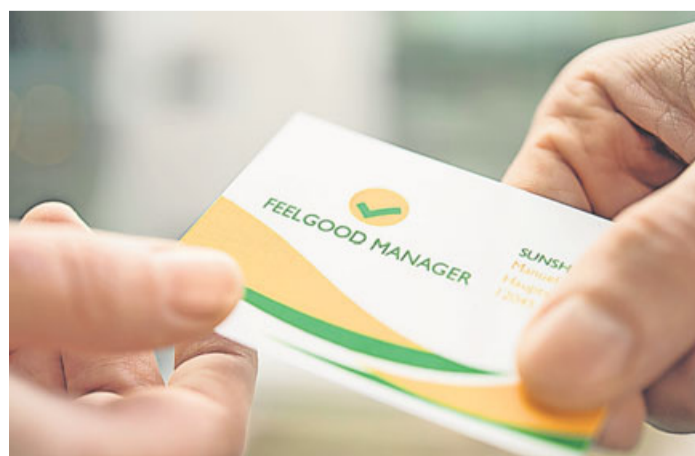
Feelgood Manager schmeißen nicht etwa den Flipperautomaten an. Vielmehr sollen sie dafür sorgen, dass das Betriebsklima gut ist - zum Beispiel, indem sie für Weiterbildungen sorgen.