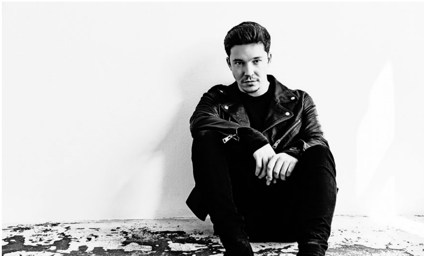
Mit Stücken wie „Home“, „Rooftop“ und „Safe“ wurde Nico Santos bekannt.