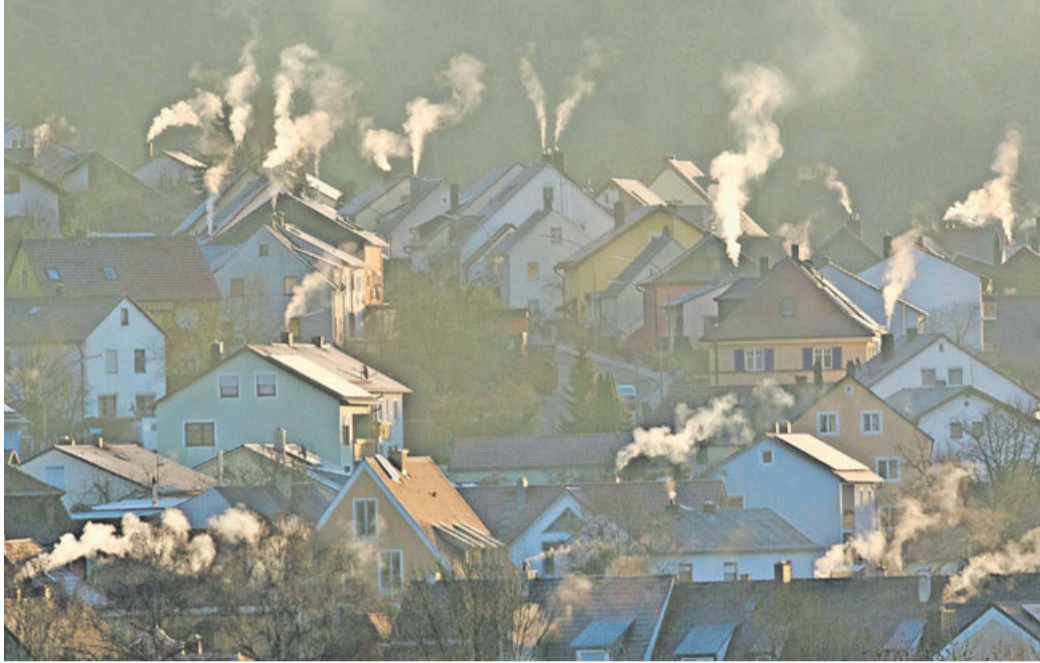
Über Schornsteine stoßen Holzöfen nicht nur Kohlenmonoxid, sondern auch Feinstaub aus.

Betroffen sind ummauerte Feuerstätten mit einem industriellen Heizeinsatz und einer Leistung von mindestens vier Kilowatt, die zwischen 1985 und 1994 errichtet wurden und deren Emissionswerte für Feinstaub 0,15 Gramm pro Kubikmeter Abgas und für Kohlenmonoxid 4 Gramm pro Kubikmeter überschreiten. Diese Anlagen müssen eine verschließbare Tür haben.