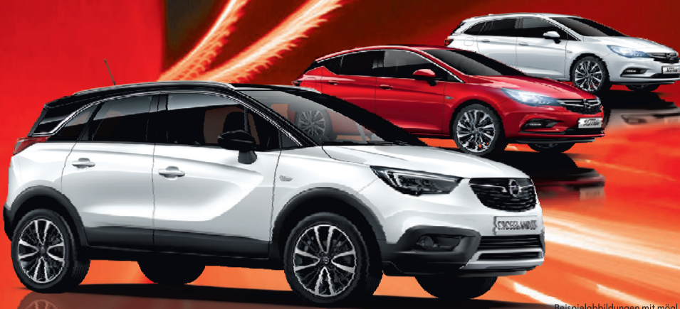
Beispielabbildungen mit mögl. aufpreispflichtiger Sonderausstattung

IHR PREISVORTEIL JETZT bis zu 1) 7.500,- €