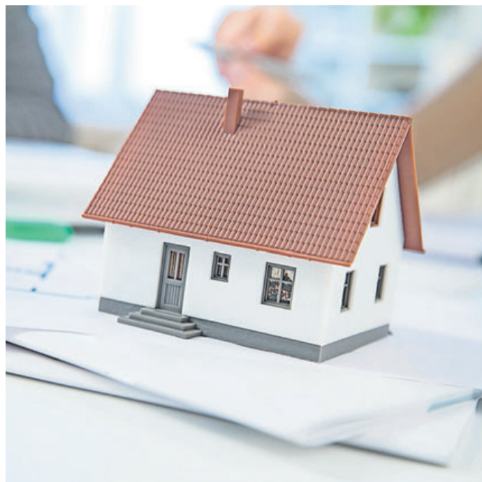
Wer ein Haus kaufen möchte, holt vorher möglichst viele Informationen ein und prüft verfügbare Pläne.

Kommt ein passendes Haus auf den Markt, müssen sich Kaufinteressenten derzeit oft schnell entscheiden. Dennoch sollten sie wichtige Unterlagen und Verzeichnisse einsehen, rät der Verband Privater Bauherren (VPB). Mit einem Blick ins Grundbuch können Interessenten prüfen, ob dem Verkäufer die Immobilie wirklich gehört, ob sie mit Hypotheken belastet ist oder Wohn- und Wegerechte eingetragen sind. Diese gelten auch nach dem Kauf fort und können die Nutzung einschränken. Gleiches gilt für öffentlich-rechtliche Beschränkungen, die im Baulastenverzeichnis vermerkt sind. Das kann etwa eine Abstandsfläche für ein Nachbargrundstück sein, die dort liegt, wo der Wintergarten angebaut werden sollte. Was sich bald in der Nachbarschaft verändert, verrät der Bebauungsplan. Nach der Einsicht beim Bauamt ahnen