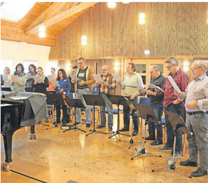
Auf dem Programm beim Probenwochenende stand das Festigen der Stimme – einzeln sowie im Gesamtchor.

„BönCanto“ probt intensiv für neues Programm