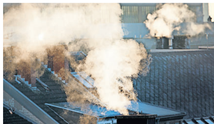
Landläufig gilt die Zeit vom 1. Oktober bis 31. März als Heizsaison.