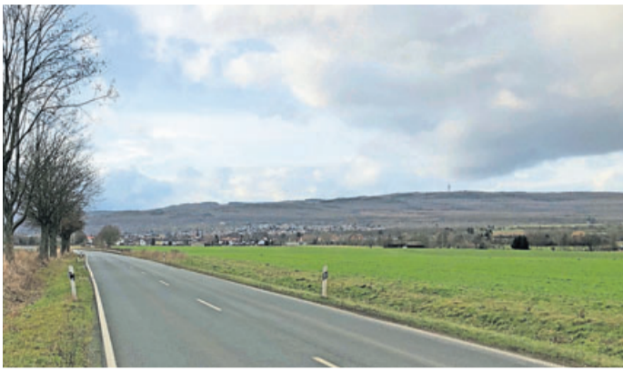
Der Radweg soll parallel zur Kreisstraße 11 verlaufen.

Zwischen Nieder-Rosbach und Ober-Wöllstadt