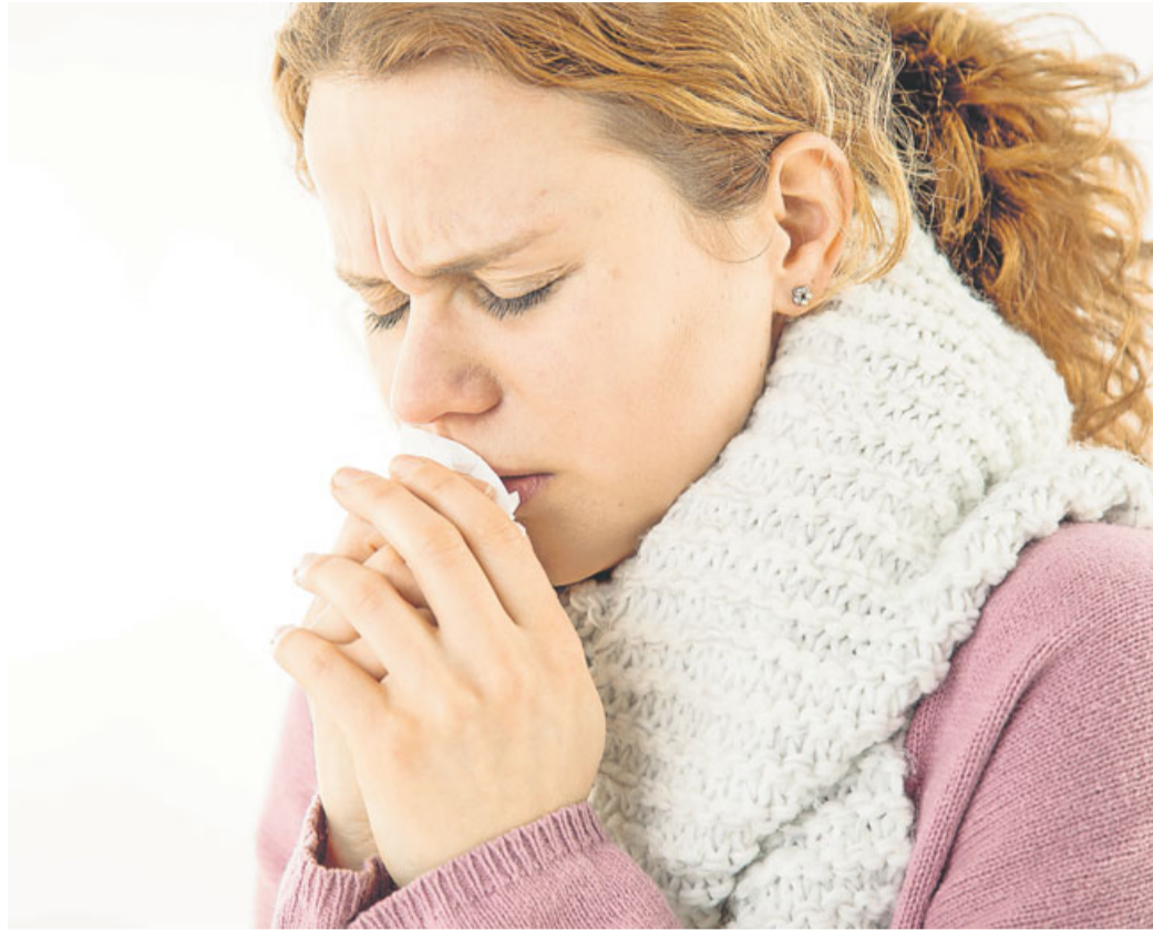
Überfallartige Beschwerden: Im Gegensatz zur Erkältung bricht eine Grippe ganz plötzlich aus.

Die Symptome der Grippe ähneln denen einer ganz normalen Erkältung, sind allerdings oft schwerer und langwieriger. Größtes Unterscheidungsmerkmal ist der Beginn der