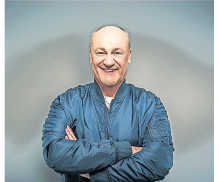
Der ehemalige Radio- und TV-Moderator Robert Treutel alias Bodo Bach ist gebürtiger Frankfurter und bekannt durch seine Späßenrufe mit der Einleitung: „Ich hätt da gerne mal ein Problem“.

Der ehemalige Radio- und TV-Moderator Robert Treutel alias Bodo Bach ist gebürtiger Frankfurter. Bekannt wurde