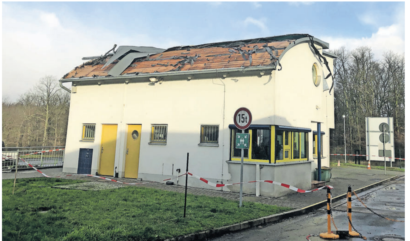
Sturmtief Sabine deckte das Dach des Betriebsgebäudes der Kompostierungsanlage in Ilbenstadt ab.

Sturmtief Sabine: Polizei und Kreisverwaltung ziehen Bilanz