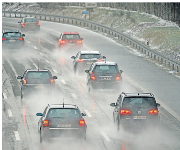
Glättegefahr: Wenn Regen auf gefrorene Böden fällt, kann es für Autofahrer gefährlich werden.

Auf komplett spiegelglatten Straßen sind das elektronische Stabilitätsprogramm ESP und das Antiblockiersystem ABS wirkungslos, so der ACE. Wer von Glatteis überrascht wird, sollte besser eine kleine Pause einlegen, um abzuwarten, bis der Winterdienst die Straße geräumt hat, und dann entsprechend vorsichtig weiterfahren.