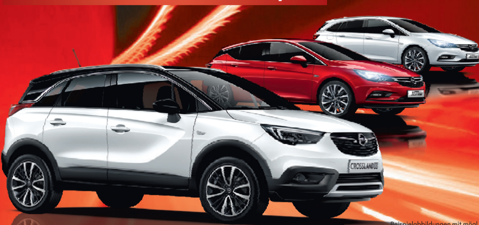
Beispielabbildungen mit mögl. aufpreispflichtiger Sonderausstattung

IHR PREISVORTEIL JETZT bis zu 1) 7.500,- €