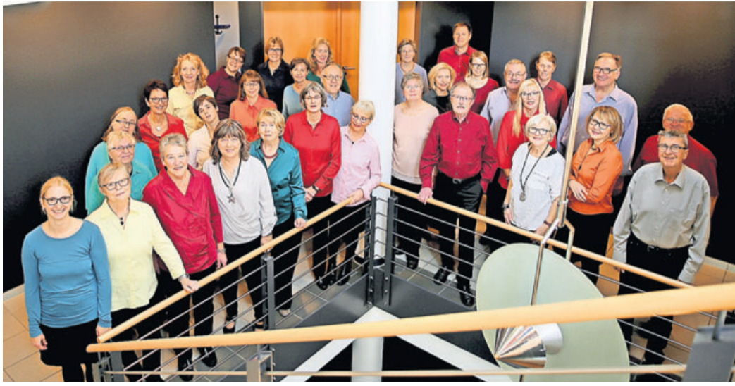
Der Gesangverein Frohsinn 1845 Assenheim feiert in diesem Jahr sein 175-jähriges Bestehen.

Gesangverein Frohsinn 1845 Assenheim feiert 2020 sein 175-jähriges Bestehen