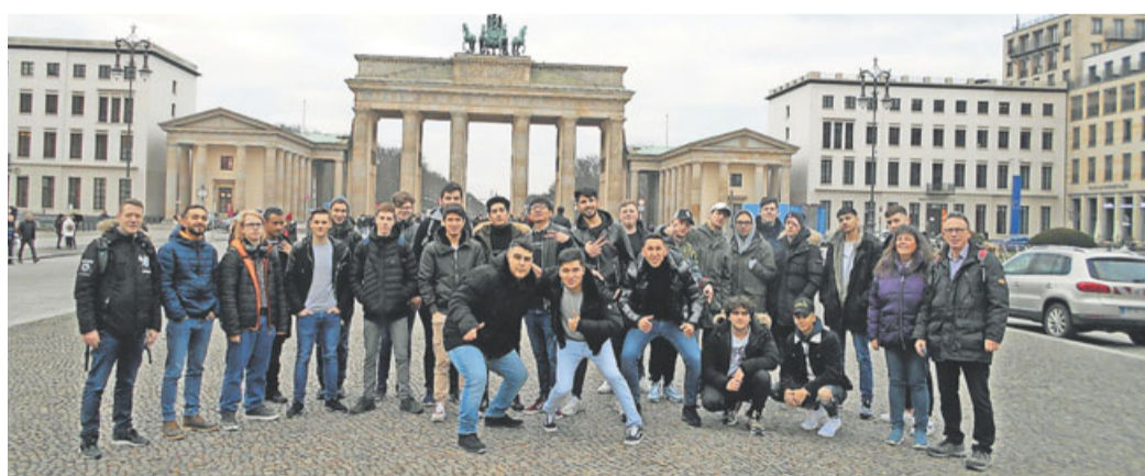
Die Butzbacher Berufsschüler mit ihren Lehrern.

Butzbacher Berufsfachschüler lernen Berlin von vielen Seiten kennen