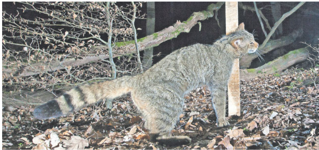
Nutzt die Wildkatze den Griedeler Markwald als Lebensraum oder ist sie am stark frequentierten Hausberg unterwegs? Dieser Frage geht der BUND Butzbach auf die Spur.

BUND Butzbach untersucht mit Hilfe von Lockstöcken die Verbreitung