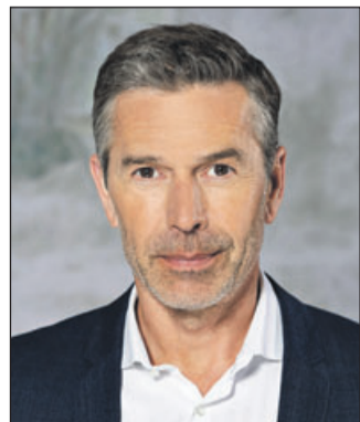
Moderiert die neue dreiteilige „Terra X“-Dokumentationsreihe: Dirk Steffens.

Eine Woche darauf geht es um das Thema Luft. Zurzeit steht