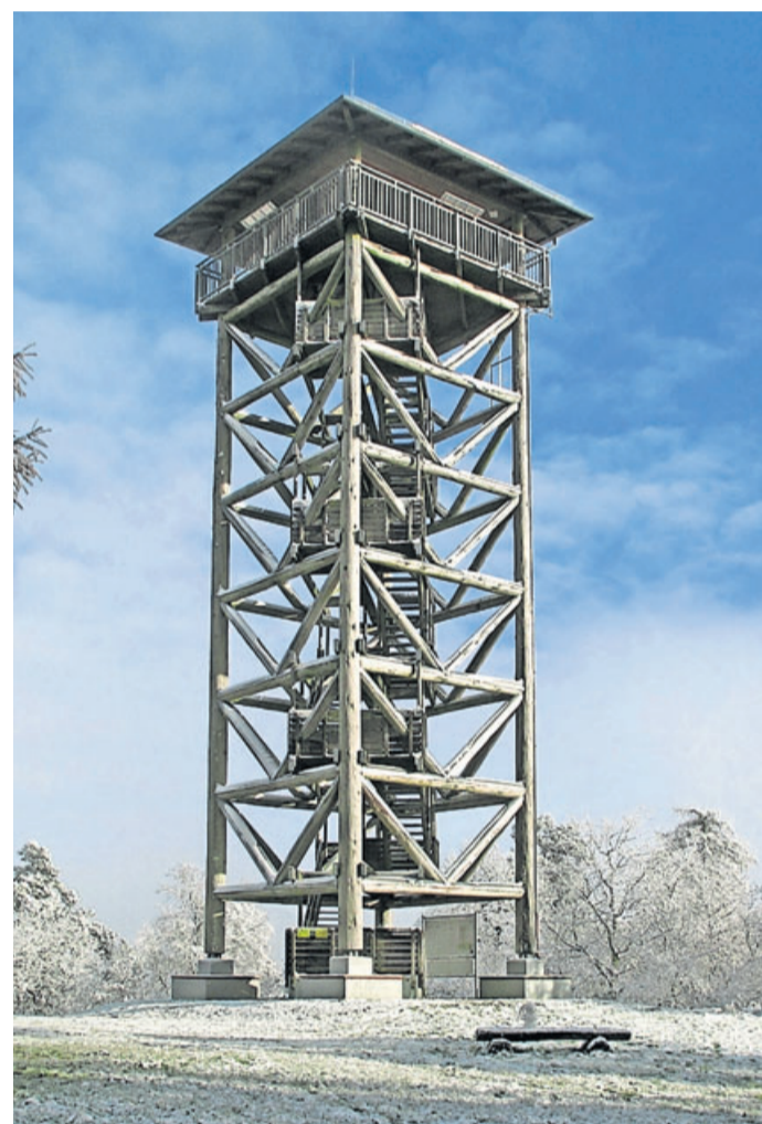
Auf dem Hausbergturm installierte der Förderverein acht neue Kameras.

Vereinshöhepunkt des Jahres 2019 war die 1.-Mai-Feier auf dem Hausbergplateau, die auf Grund des hervorragenden Wetters einen Besucherrekord verzeichnete. Am Ende der Versammlung