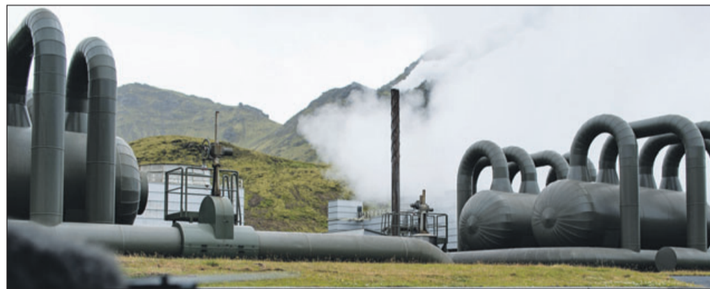
Das Geothermalkraftwerk Hellisheiði in Island. Ziel des Projekts ist es, CO 2 (Kohlendioxid) dauerhaft in Gestein zu binden.