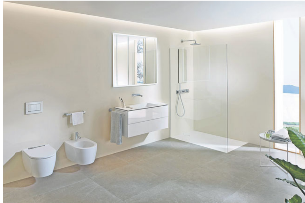
In Online-Badplanern kann man seine neue Badausstattung schon mal vorplanen.

Es lohnt sich, zunächst ein paar Überlegungen anzustellen, welche individuellen Bedürfnisse ein neues Bad erfüllen soll. Wer keine Lust aufs Badputzen hat, für den ist eine reinigungsfreundliche Ausstattung wichtig. Dies bieten zum Beispiel spülrandlose Rimfree-WCs, abnehmbare Toilettensitze oder Duschrinnen, in denen sich kein versteckter Schmutz bilden kann. Für Komfort ohne Barrieren stehen bodenebene Duschen oder Waschtische, bei denen der Siphon in die Wand verlegt ist. Für mehr Frische im Alltag sorgen Dusch-WCs, die den Po mit