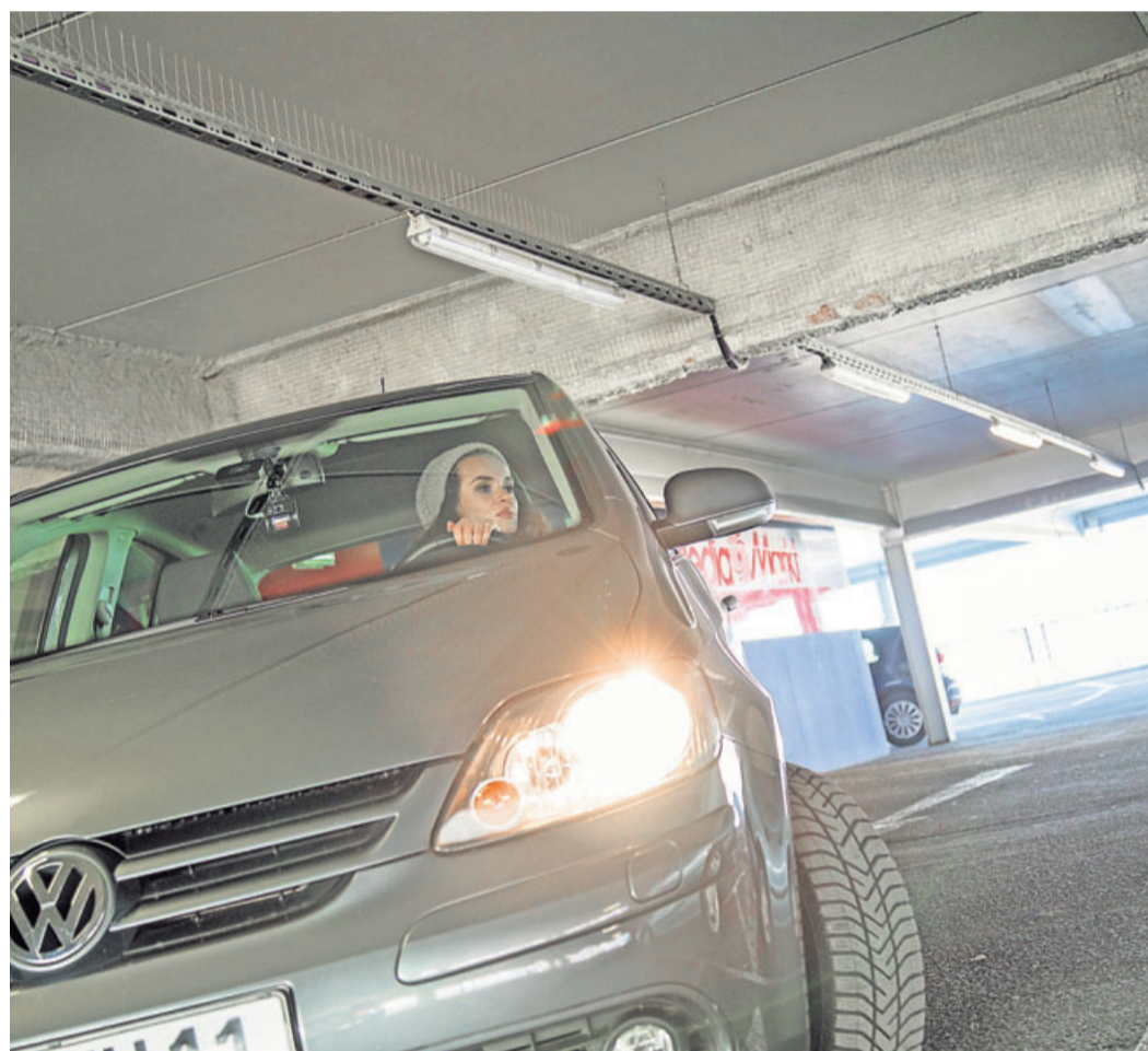
Bitte möglichst zügig zur Ausfahrt: Allzu lange trödeln sollten Autofahrer nach dem Bezahlen nicht.

Das Parkhausticket ist bezahlt – doch das Fahrzeug steht im letzten Winkel des Gebäudes. Der Fahrer kommt ins Schwitzen: Reicht die Zeit? Oder muss ich am Ende nachzahlen? Die Parkhausbetreiber legen selbst fest, wie viel Karenzzeit sie fürs Rausfahren einräumen. Das können weiche Formulierungen wie „genug Zeit“ oder ganz konkrete Zeitfenster wie 20 Minuten sein. Eine all-