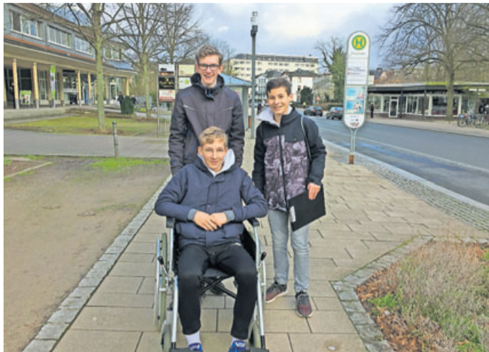
Mit dem Rollstuhl erkundeten die Konfirmanden der evangelischen Kirchengemeinde Bad Nauheim die Stadt auf der Suche nach Stolperfallen und Hindernissen.

Alle Erkenntnisse werden nun in der Bad Nauheim Stadtmarketing und Tourismus GmbH zusammengeführt. Von dort kam auch der Rollstuhl, den gehbehinderte Touristen bei einem Besuch in Bad Nauheim in der Tourist Information ausleihen können. „Wir vom Stadtmarketing freuen uns über diese Initiative der