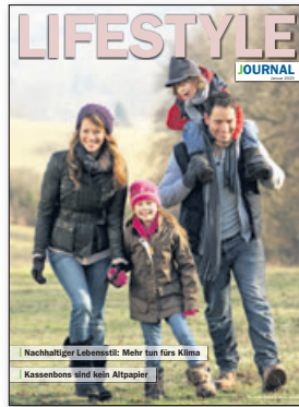
Trends im Visier