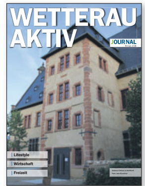
Die lokalen guten Seiten