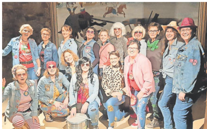
Mit Sambarhythmen sorgten die Mirlar Dibbeklobber wieder für gute Stimmung.

Telefon: 06051/833-268 E-Mail: b.stenger@gnz.de