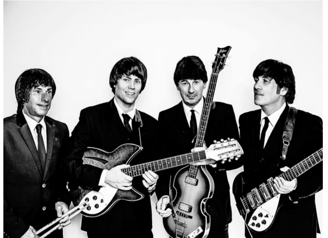
Neben originalgetreuen Instrumenten und Outfits erwartet den Zuschauer eine erstklassige Performance der „Silver Beatles“.

Neben originalgetreuen Instrumenten und Outfits erwartet den Zuschauer eine erstklassige Performance. Von „Please Please Me“ bis zum