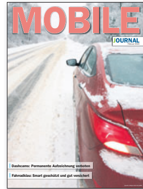
Fahrzeuge im Fokus