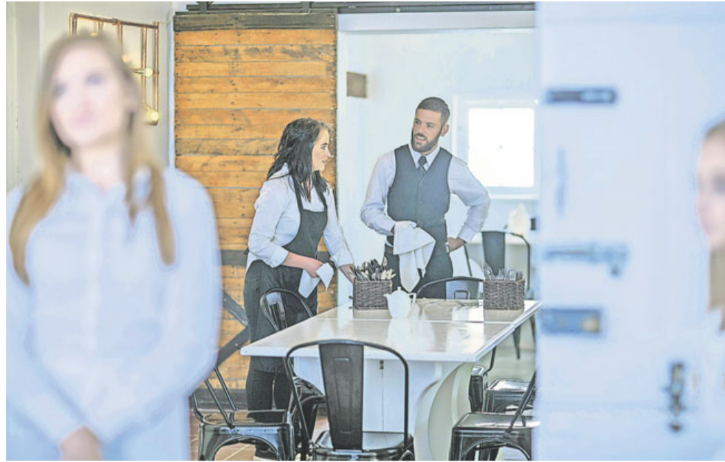
Guter Überblick in der Lehre.