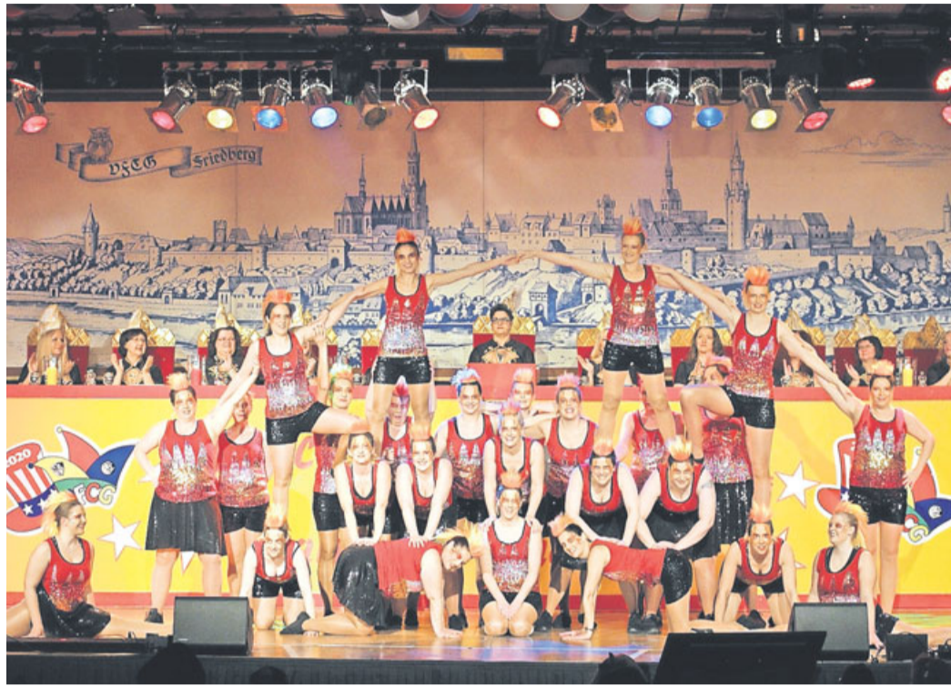
Erfahrung sammeln hieß es in diesem Jahr wieder für den MCC-Nachwuchs: Mit ihrem Tanz „Olympische Fackeln“ konnten die Celebrations in der ausverkauften Friedberger Stadthalle erneut punkten.

Auch der Mörlauer Nachwuchs war in diesem Jahr zu Gast in Friedberg. Schon im vergangenen Jahr sind die MCC Celebrations der Einladung der VFCG gefolgt und ernteten viel Applaus für ihren Auftritt bei der ersten Wetterauer Weiber-Fremden-