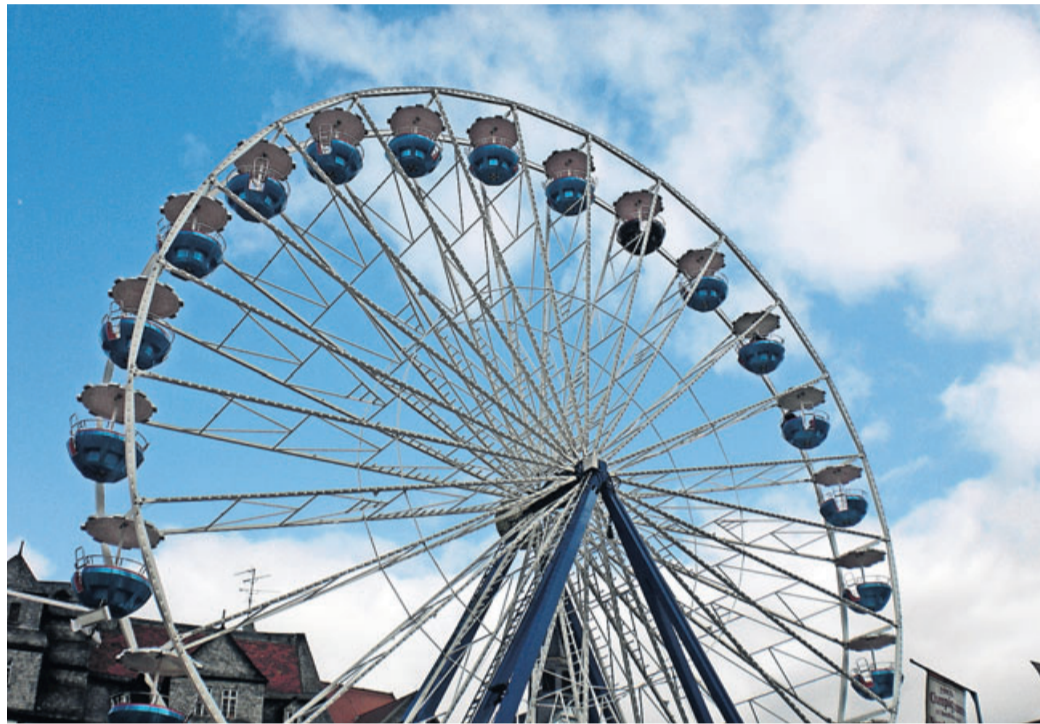
Das 36 Meter hohe Riesenrad war wieder die Attraktion auf dem Marktplatz.