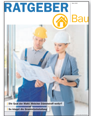
Wohnen & Leben