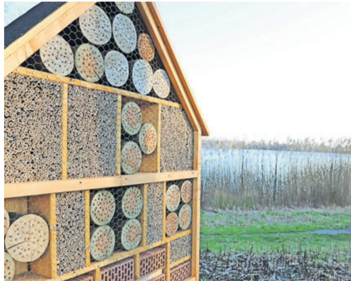
Ein weiteres Insektenhotel konnte vor wenigen Tagen am Ufer des Wölfersheimer Sees aufgestellt werden und ergänzt nun den dort vorhandenen Barfußpfad.

Die meisten Menschen denken bei Bienen an Honigbienen. Weniger bekannt ist die unglaubliche Vielfalt der heimischen Wildbienen und deren erstaunliche Anpassung an die verschiedensten Lebensräume und Bedingungen. Während sich der Bestand der Honigbiene dank zahlreicher Imker mittlerweile wieder erholt hat, leidet die Wildbiene unter anderem unter Nahrungsmangel. Um zur Bewusstseinsbildung beizutragen, hat man den Zukunftspfad Sodila im Jahr 2018 um ein Insektenhotel erweitert. „Es ist wirklich faszinierend, ein solches Insektenhotel zu beobachten. Wer sich etwas Zeit nimmt, wird bestätigen können, dass ein