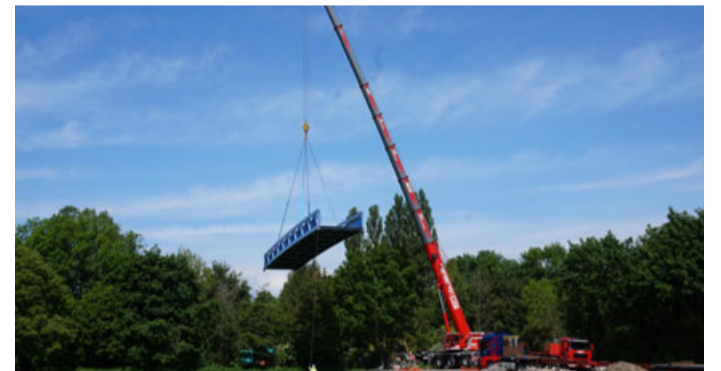
In luftiger Höhe balanciert der Schwerlastkran die neue Niddabrücke in Dortelweil.