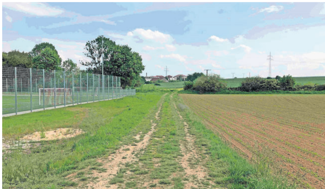
Die Erweiterung des Gewerbegebiets „Am Kalkofen“ und die spätere Bebauung soll nach dem Willen der Wöllstädter Christdemokraten möglichst klimafreundlich umgesetzt werden.

Die CDU strebt eine nachhaltige und klimafreundliche Bauleitplanung in der Gemeinde Wöllstadt an. Gerade Unternehmen in Gewerbegebieten benötigten in der Regel viel Energie und produzierten dadurch eine größere Menge des Treibhausgases Kohlendioxid, heißt es bei der Union. Eine Gewerbeansiedlung könne sich jedoch mit Weitblick in der Planung durchaus selbst zum Beispiel mit regenerativer Energie versorgen und weitgehend klimaneutral ar-