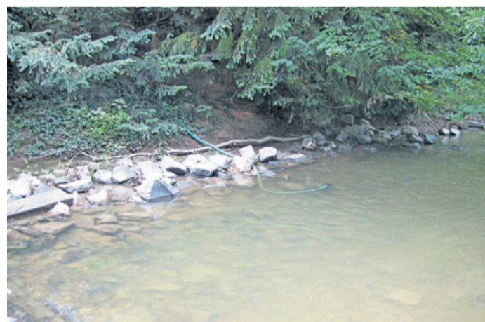
Das ist künftig nicht mehr erlaubt: Wasserentnahmen aus der Usa mithilfe eines Gartenschlauches und einer elektrischen Pumpe.

Nachdem es im Januar und Februar noch durchschnittlich geregnet habe, seien ergiebige Niederschläge seit Anfang März eine Seltenheit. Im Winterhalbjahr sei das Regendefizit aus den Jahren 2018 und 2019 nicht ausgeglichen worden. Nach wie vor sei es viel zu trocken. „Was wir brauchen, ist ergiebiger Re-