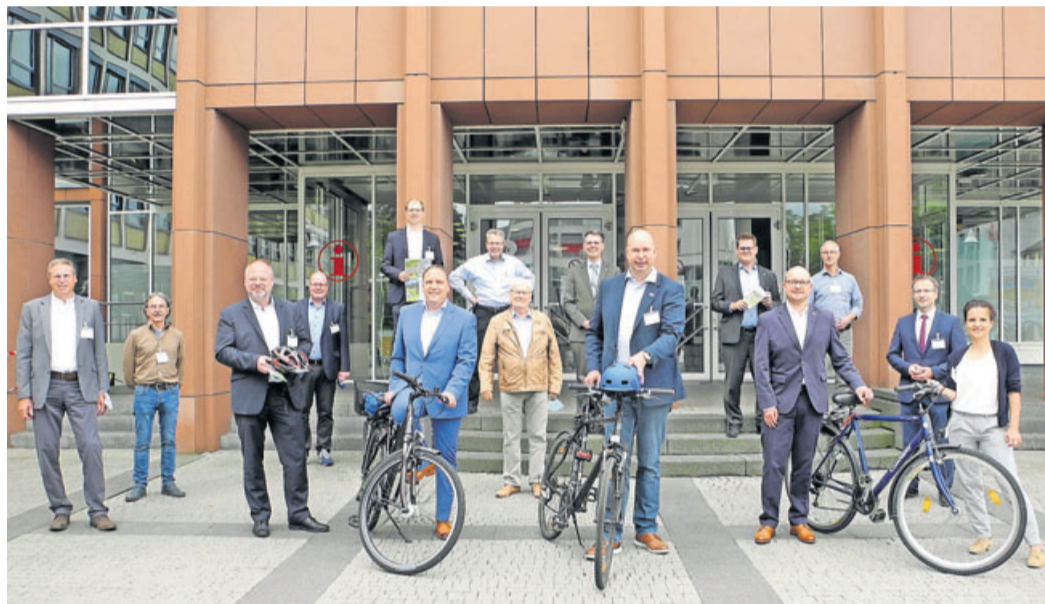
Über die Unterzeichnung des Kooperationsvertrages freuen sich Vertreter der Städte Butzbach, Friedberg, Bad Nauheim, Karben, Bad Vilbel, der Gemeinde Wöllstadt sowie des Wetteraukreises und des Regionalverbands FrankfurtRheinMain.

Es wird davon ausgegangen, dass die Kosten der Machbarkeitsstudie bei etwa 100.000 Euro liegen. Das Land Hessen bezuschusst Machbarkeitsstudien dieser Art in der Regel mit rund 50 Prozent. Der Wetteraukreis hat die Übernahme von bis zu 25.000 Euro zugesagt. Die restlichen Kosten teilen sich die genannten Kommunen zu gleichen Teilen. Der Regionalverband bringt sein Personal ein und koordiniert den gesamten Projektprozess. Damit wird auch der Norden der Region an das künftige Netz der Radschnellwege rund um Frankfurt angebunden, wel-