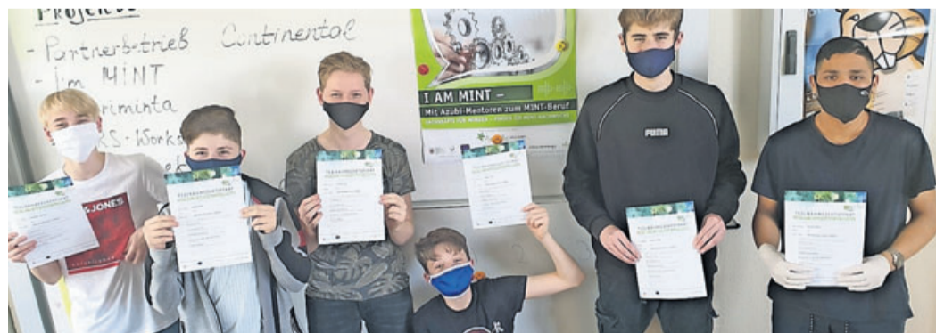
Die Schüler des Wahlpflicht-Informatikkurses im Jahrgang 9 mit ihren Teilnahmeurkunden.

Delegation der Adolf-Reichwein-Schule besucht Continental im Rahmen des „I am MINT“-Projektes