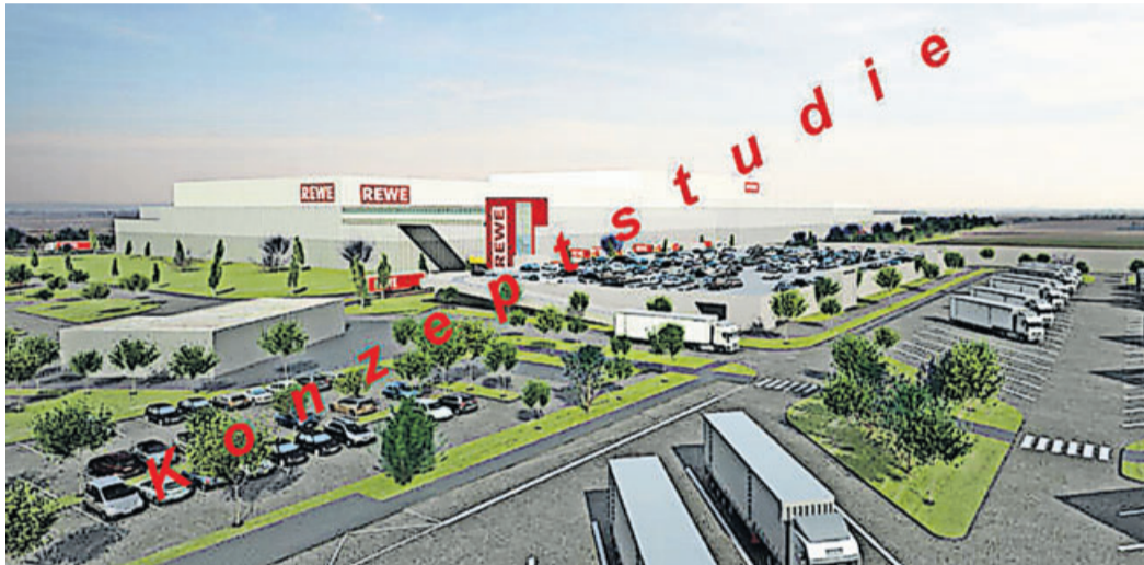
Die aktuelle Konzeptstudie.

Um ein Projekt wie dieses zu realisieren sind viele Schritte notwendig. Bereits im vergangenen Jahr wurde der Regionale Flächennutzungsplan in der Verbandsversammlung des Regionalverbandes beschlossen und das Regierungspräsidium Darmstadt genehmigte ihn. Der Regionale Flächennutzungsplan regelt in welchen Bereichen Wohn- oder Gewerbegebiete entstehen dürfen. Auf diesem Plan basiert der Bebauungsplan, der parallel aufgestellt wurde. Der Beschluss diesen Plan aufzustellen wurde bereits im März 2017 von der Gemeindevertretung gefasst. Seither wurden die benachbarten Kommunen, Behörden und anderer Träger öffentlicher Belange mehrmals zu den aktuellen Planungen befragt. Auch Bürgerinnen und Bürger hatten die Möglichkeit die Unterlagen einzusehen und Stellungnahmen abzugeben. Im Dezember 2017 wurde ein frühzeitiges Beteiligungsverfahren durchgeführt. Etwa ein Jahr später wurde der Bebauungsplan offengelegt. Aufgrund der Anregungen wur-