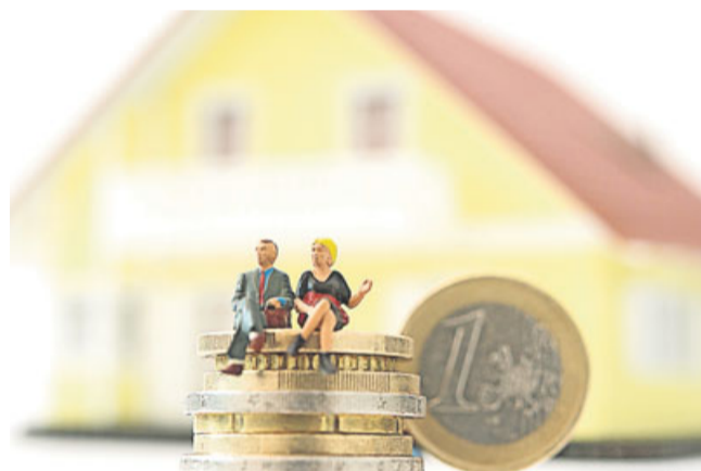
Immobilienkredite sind meist keine Frage des Alters: Viele Kreditinstitute haben hier keine Obergrenze festgelegt.

Wichtig also für Verbraucher: Nicht gleich bei der Hausbank einen Finanzierungsvertrag abschließen, sondern vergleichen. Einen guten Überblick haben nach Angaben der Stiftung Warentest Kreditvermittler, gute Angebote gibt es aber auch bei regionalen Banken. Damit die Angebote vergleichbar sind, sollten immer die gleichen Vorgaben gemacht werden - also Kreditsumme, Zinsbindung, Monatsrate, Tilgungssatz und Rückzahlungsoptionen bei allen Anfragen übereinstimmen.