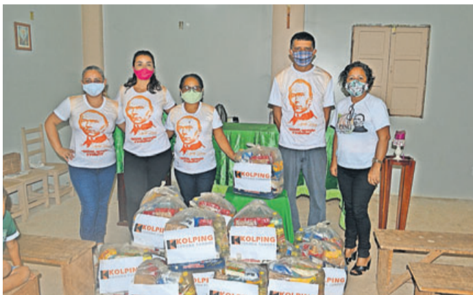
Spenden für das Projekt.

Lebensmittelversorgung und Sozialbetreuung