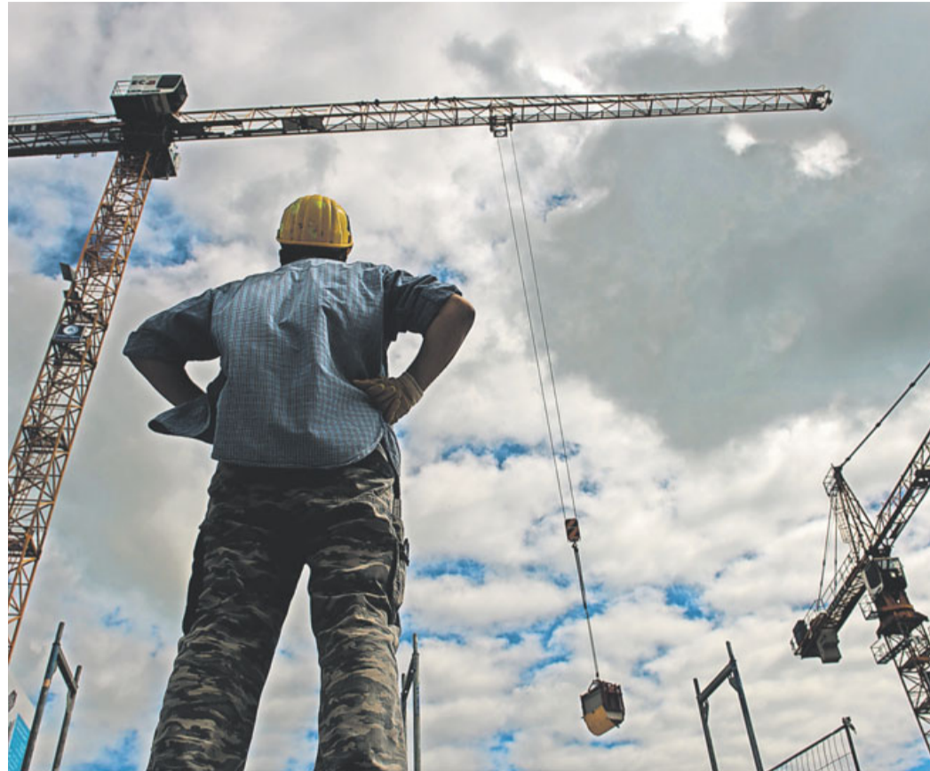
Ungelernte können mit ihrem Arbeitgeber Qualifizierungsmöglichkeiten ausloten.