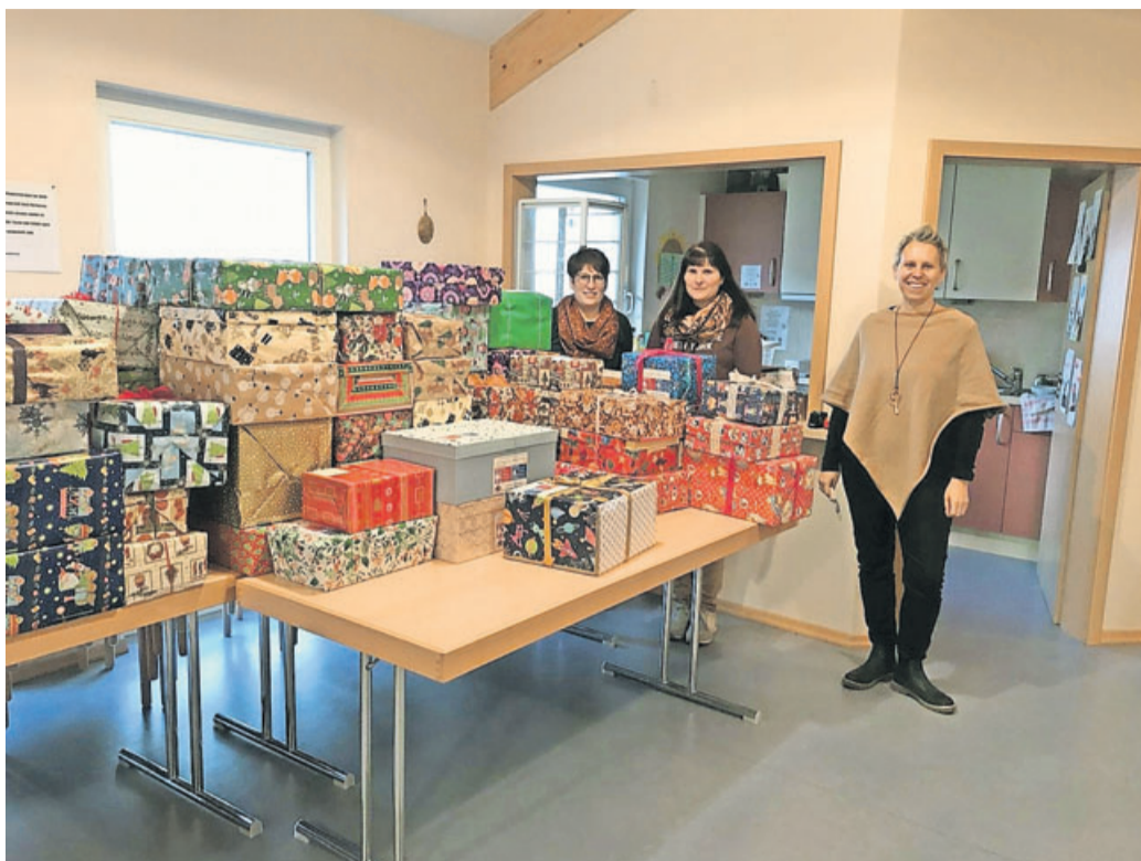
125 Päckchen sind in Weichersbach zusammen gekommen.

Weihnachtspäckchenaktion für Kinder in Rumänien