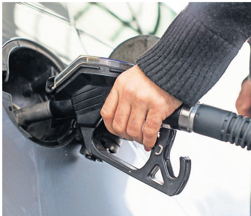
Zum falschen Schlauch gegriffen? Wer sich vertankt, sollte das Auto auf keinen Fall starten.

Wurde lediglich eine falsche Sorte Superbenzin getankt und dabei eine geringere als die geforderte Qualität eingefüllt, kann man vorsichtig weiterfahren. Vollgas ist dann aber tabu, und Fahrer sollten laut Tüv sobald wie möglich