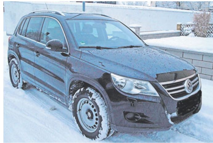
Der ACE rät: Auto vollständig von Schnee und Eis befreien, um sich möglichst unfallfrei bewegen zu können.