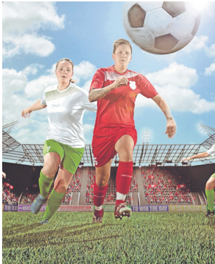
Mithilfe im Verein deutet auf Engagement und Einsatzwillen hin.

Soft Skills Fähigkeiten, die nicht in einer Ausbildung oder in der Schule als Fachwissen erworben wurden, sondern die sich auf die Persönlichkeit beziehen. Teamfähigkeit gehört dazu, Kommunikationsstärke oder Verantwortungsbewusstsein ebenso.