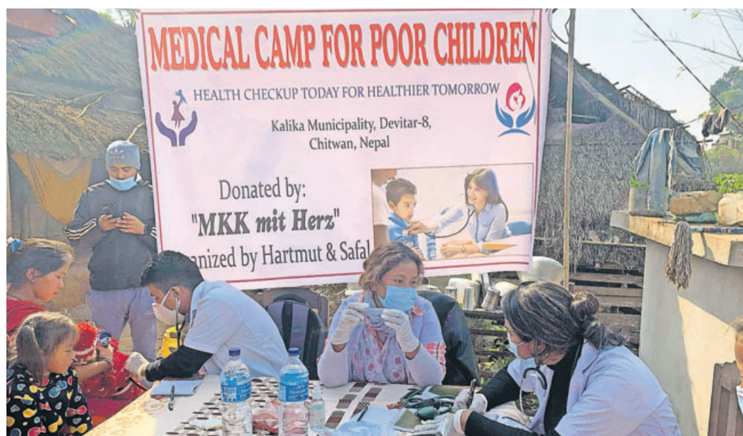
Im Medical Camp in Nepal.