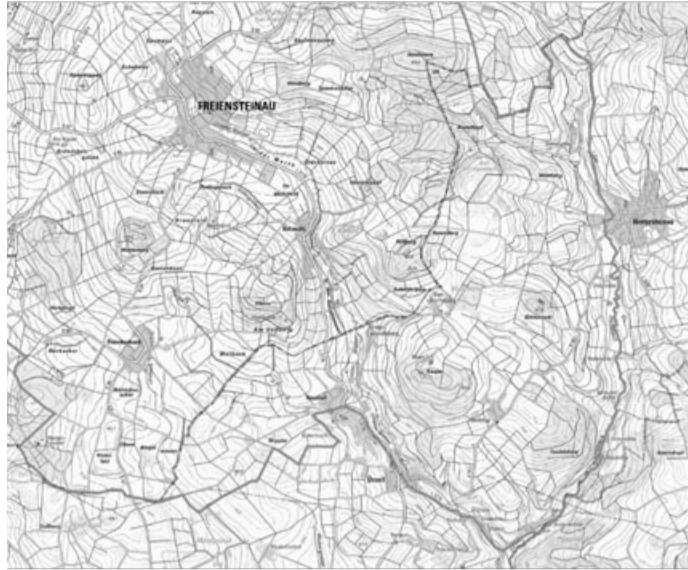
Anlage 1 : Sperrbezirk in Worten siehe Punkt I der Allgemeinverfügung