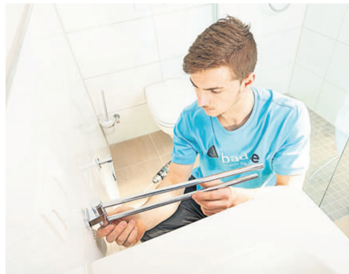
Eingespielte Handwerkerteams sorgen für eine schnelle und hochwertige Badsanierung.

Der erste Schritt, um kleine Bäder großzügiger erscheinen zu lassen, ist die passende Farbwahl. Fliesen im Dunkelbraun der 90er-Jahre lassen den Raum noch enger wirken.