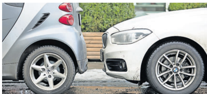
Bevor es dunkel wird: Nicht vergessen, das Auto über Nacht in die Garage zu fahren, wenn Sie es mit Ihrer Versicherung so vereinbart haben.

Wer bei der Versicherung angibt, sein Auto nachts in einer Garage einzustellen, sollte das auch wirklich immer tun. Denn steht es davor, darf die Versicherung den Anspruch nach einem Diebstahl reduzieren. Das zeigt ein Urteil des Landgerichts Magdeburg (Az.: 11 O 217/18), über das Arbeitsgemeinschaft Verkehrsrecht des Deutschen Anwaltvereins (DAV) berichtet. Im konkreten Fall war mit der Kaskoversicherung vereinbart worden, dass der Besitzer sein Auto nachts in eine Garage einstellt. Das hatte ihm eine günstigere Eingruppierung