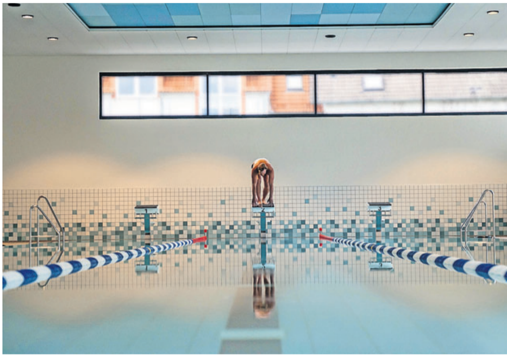
Die heimischen Wasser-Spitzensportler sind dankbar für die Trainingsmöglichkeiten im 25m-Schwimmbecken der Spessart Therme

Die Aktivitäten im 25 Meter-Schwimmbecken sind nach Rücksprache mit dem Ord-