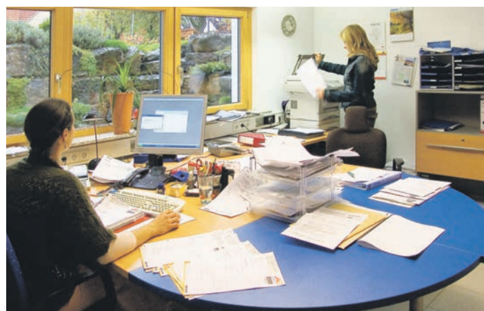
Ein gut gestalteter Keller lässt sich problemlos in ein Büro verwandeln.

Unabhängig von den Erdarbeiten kostet ein Quadratmeter Keller gut 30 bis 40 Prozent dessen, was für einen Quadratmeter im Obergeschoss fällig wird – abhängig von der gewünschten Ausbaustufe. Das sollten Baufamilien bei der Raumplanung bedenken. Gerade in der aktuellen Coronakrise, in der ganze Familien gezwungen waren, über längere Zeit zu Hause zu bleiben, hat sich gezeigt, dass der Trend zu offenen Räumen oder zum sogenannten Tiny House an Grenzen stößt. Hier kann ein neuer Trend einsetzen, der für die Zukunft ein anderes Raumlayout in Betracht zieht.