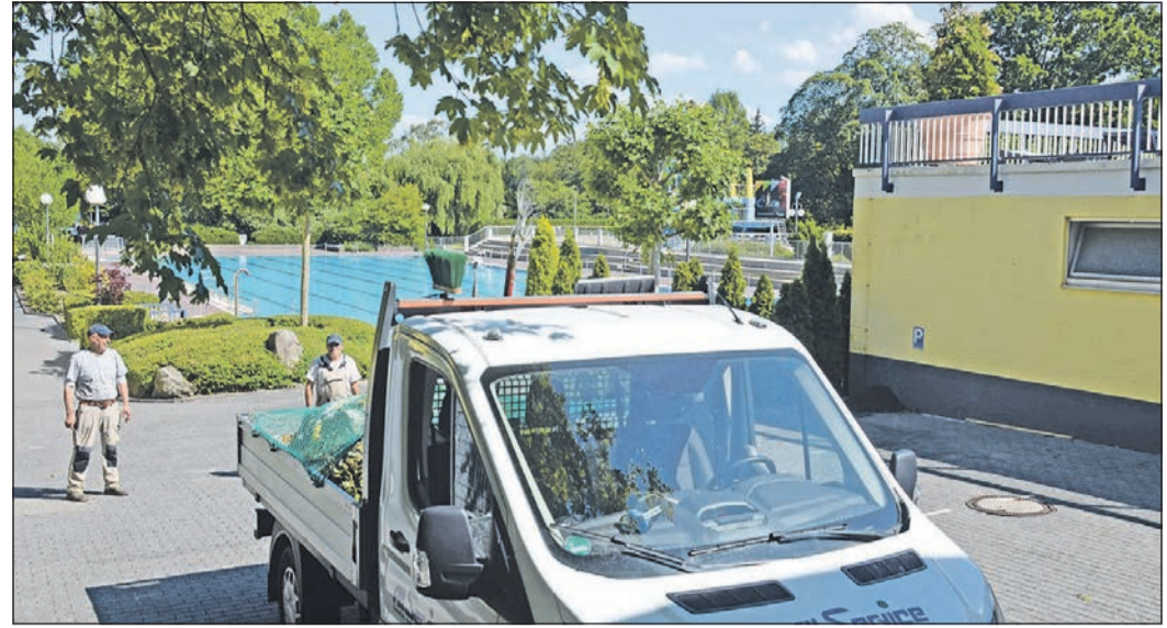
Das Seedammbad präsentiert sich bereits rausgeputzt bis in den hintersten Winkel. Die letzten Handwerker verlassen am späten Freitagnachmittag das Gelände.

Im Seedammbad läuft alles nach Plan. „Wir wussten, was kommt, wir sind vorbereitet“, sagt Stadtwerke-Direktor Ralf Schroedter. Nach der Freigabe des Schwimmbadbetriebs durch die Landesregierung in der vergangenen Woche konnte Bad Homburg schnell reagieren. „Das Konzept steht, wir müssen es nur noch umsetzen.“ Im Verbund mit den Nutzern, die das Seedammbad zumindest in der Anfangszeit völlig neu erleben werden. Wenn am Freitag, 26. Juni, um 7 Uhr morgens zwei Eingänge geöffnet werden, wird das Wasser voraussichtlich wie üblich eine Temperatur von 26 Grad haben, sonst aber wird alles an-