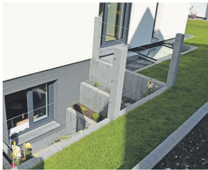
So könnte eine moderne Kellerlösung aussehen, bei der für viel Lichtzufuhr gesorgt ist.

Voraussetzung für eine flexible Nutzung des Kellers ist eine vorausschauende Planung. Wichtig sind die Faktoren Raumhöhe, Dämmung und Licht – selbst, wenn das Geschoss erst später ausgebaut wird, stellt man hier bereits die Weichen für einen deutlichen Mehrwert des Hauses. Für viel Tageslicht sorgen beispielsweise Fenster sowie Lichtschächte, Lichtbänder oder vorgesetzte Lichthöfe. „Eine