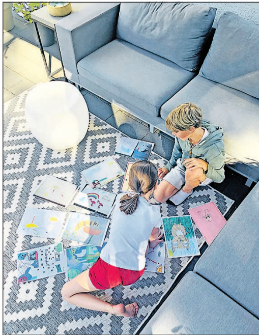
Die Kinderjury nimmt ihre Aufgabe beim Malwettbewerb sehr ernst.