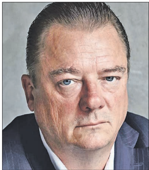
Peter Kurth wird am 21. März 2021 zu Gast sein. Er liest aus Henry Millers „Das Lächeln am Fuße der Leiter“.

Die gekauften Tickets behalten ihre Gültigkeit für die Nachholtermine. Kann der Ersatztermin nicht wahrgenommen werden oder besteht der Wunsch, die Tickets bis zum 31. Dezember gegen Karten für andere Veranstaltungen des Bad Homburger Poesie- und Literaturfestivals einzutauschen, ist das an den jeweiligen Ticketshops möglich. Gegen Vorlage der Originaltickets wird auch der Ticketpreis zurückgezahlt. In diesem Falle sollten sich Kartenbesitzer an den Ticketanbieter wenden, bei dem das Ticket erworben wurde.