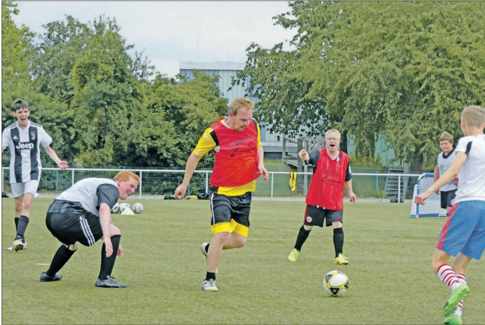
Immer mit einem Lachen im Gesicht: Die Freude darüber, dass endlich wieder trainiert werden darf, ist den Spielern vom Team United anzusehen.