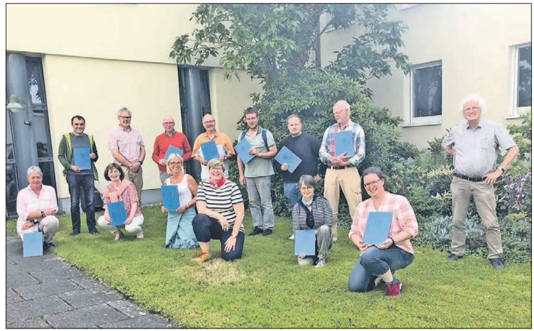
Diese Frauen und Männer haben sich ein Jahr lang weiterqualifiziert: Im Kloster Dernbach wurden jetzt die Zertifikate überreicht.