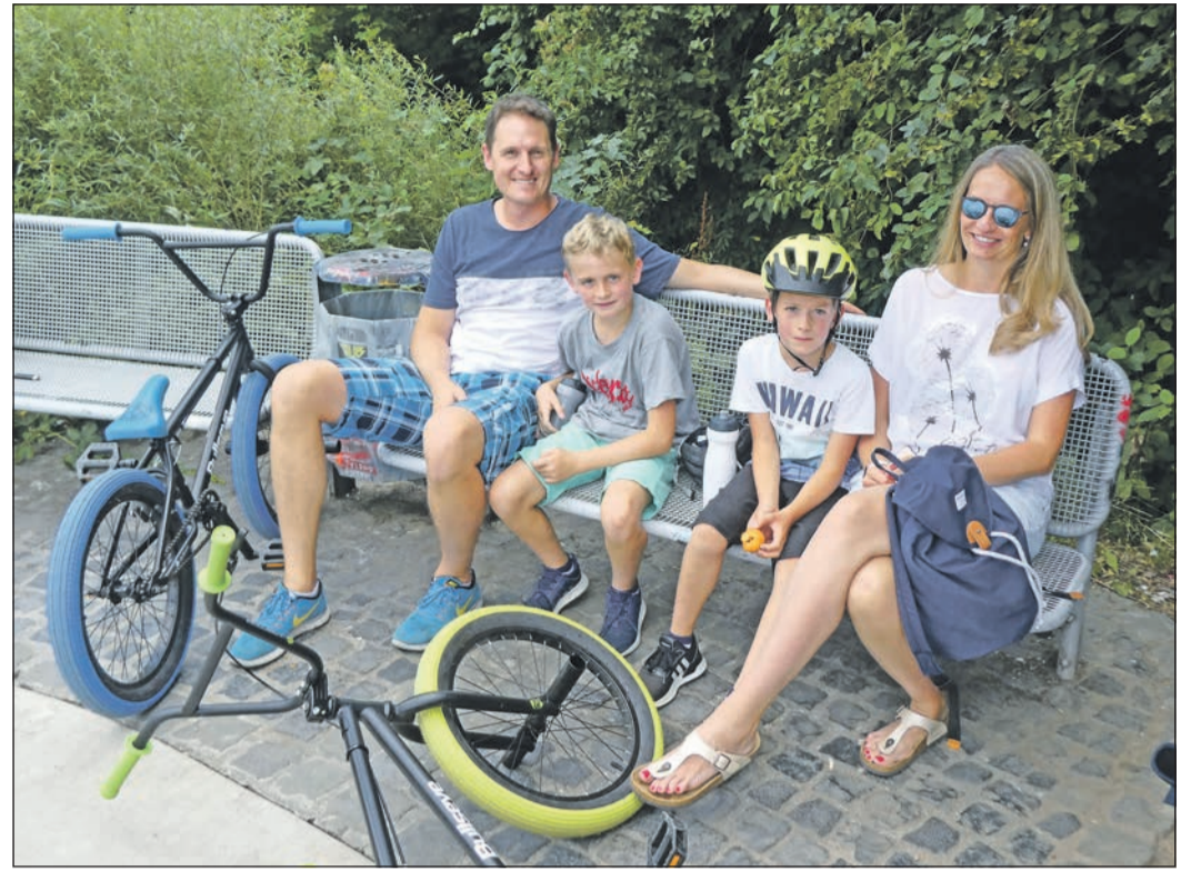
Zwei BMX-Räder, vier teils lachende, teils erschöpfte Gesichter: Der Skaterpark in Karben bietet das ideale Ziel für einen gelungenen Familienausflug.

Das Niddaufer mitsamt dem renaturierten Abschnitt grenzt direkt an das Freizeitgelände an. Vom Skaterpark aus führt der Fuß- und Fahrradweg nach rechts und nach wenigen hundert Metern zu einer Brücke, die die Nidda quert und zur Günter-Reutzel-Sportanlage führt. Nach wenigen Schritten gelangt man zu den Wiesenterrassen und der Boule-Bahn. Auch das Baden bietet sich an dieser Stelle an. Die Nutzung ist kostenfrei. Das benachbarte Restaurant „Fleißiges Liezchen“ im Günter-Reutzel-Weg 6 hat dienstags bis samstags von 17 bis 0 Uhr und sonntags von 12 bis 23 Uhr geöffnet. Das Restaurant-Team bittet um eine Online-Reservierung. Um den derzeitigen Reinigungsvorschriften gerecht zu werden, arbeitet das Restaurant-Team derzeit mit einem Zwei-Schicht-Reservierungssystem. Reservierungen können von 17 bis 19.15 Uhr und von 19.30 bis open end vorgenommen werden. Sonntagmittags gilt dieses System nicht. Weitere Infos im Internet unter www.fleissiges-liezchen.de .