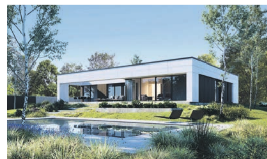
Großzügiges Wohnen auf einer Ebene: Bungalows in einem modernen Look mit viel Glas verbinden Komfort mit praktischen Vorteilen.

entwickelt. Hochwertige Faserzementplatten mit schönem Patinaeffekt oder mit natürlichem Charme rahmen die gläsernen Wände ein und verleihen dem Eigenheim einen Loftstil. Bei der Innengestaltung und der Wahl von Materialien und Farben haben die Bauherren zu großen Teilen freie Hand, ein Innenarchitekt steht beratend zur Seite. Unter www.danwoodvision.de gibt es ausführliche Informationen sowie eine Kontaktmöglichkeit.