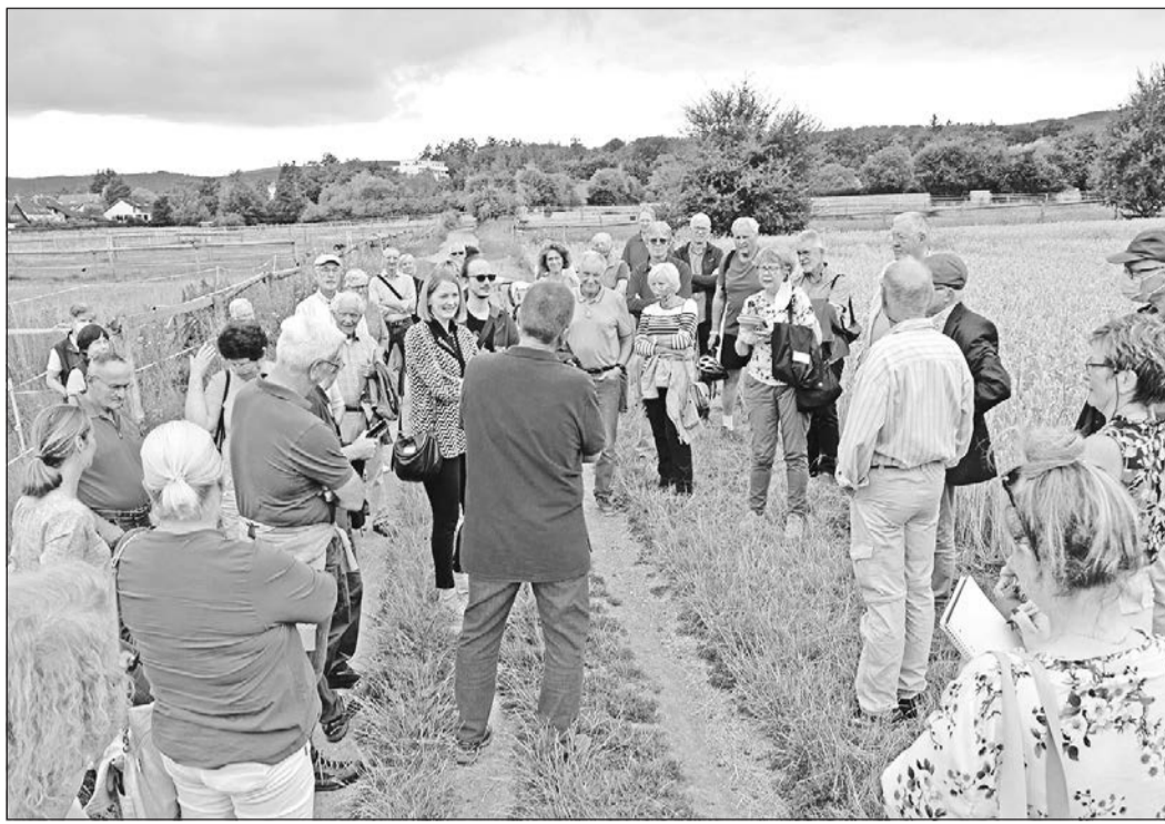
Immer wieder werden Pausen für Diskussionen auf der Oberurseler Seite der Tannenwaldallee eingelegt.