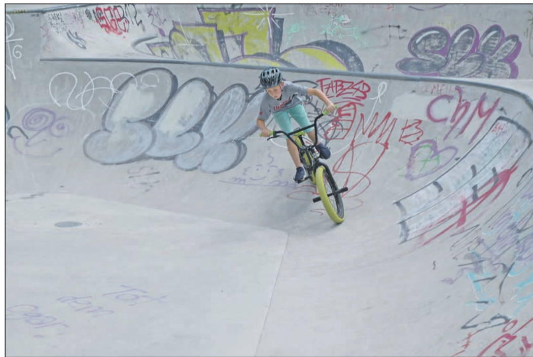
Höchste Konzentration und die richtige Balance ist beim Fahren durch die Steilkurven der Skatebowl gefragt. Wie überall gilt auch hier: Übung macht den Meister.

Neben der Bowl wird die Anlage ergänzt durch eine Funbox, die sich zum Herantasten an größere Hindernisse eignet. Zudem gibt es eine Flatrail – eine Geländerstange, die vor allem Skateboarder zum Einüben neuer Tricks einlädt. Geeignet ist die Anlage neben dem Skateboard-Fahren und dem BMX-Fahren auch zum Inline-Skating. Der zehnjährige Tim aus Karben hat sich schon auf verschiedenen Gerätschaften ausprobiert. Mit seinen Freunden komme er mehrmals in der Woche zum Skaterpark. Sie verabreden sich über eine eigene WhatsApp-