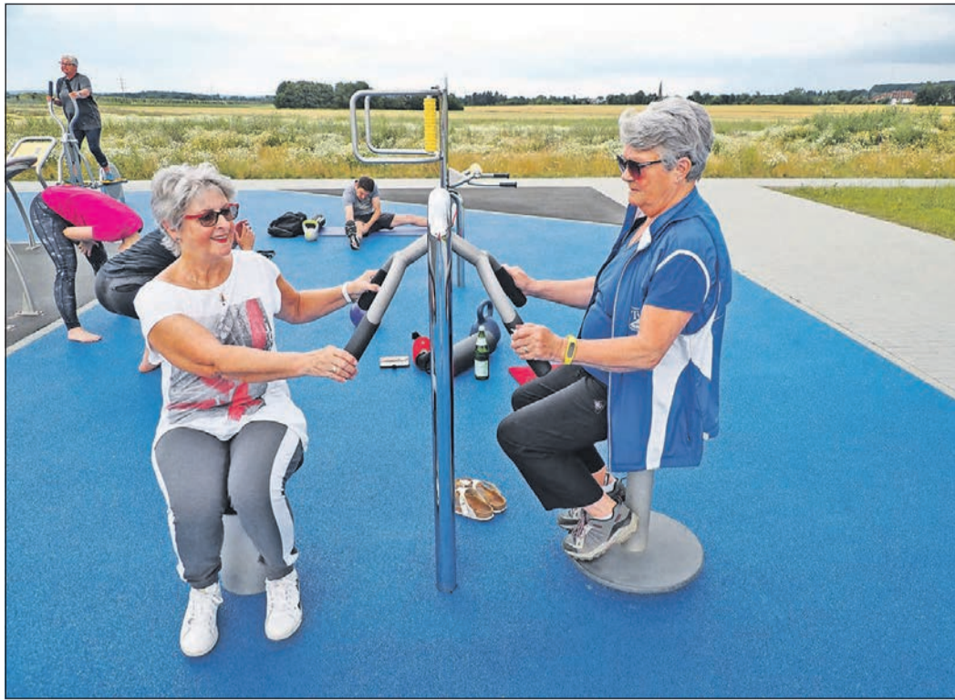
Nach dem „Walk“ zum Sportpark wird dort noch eifrig an den Geräten trainiert. In der Gruppe macht das besonders viel Spaß.