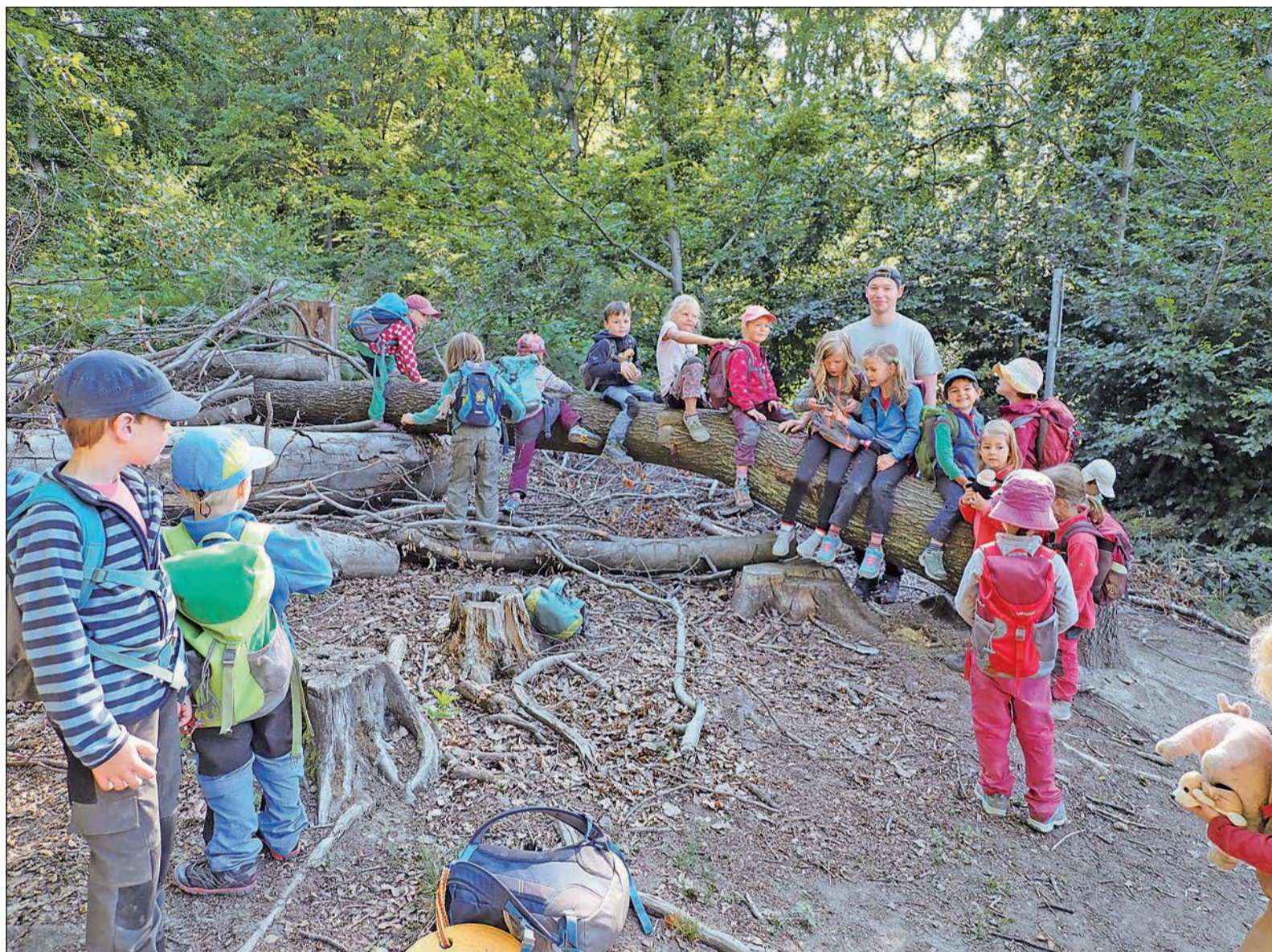
Den „Fledermäusen“ vom Waldkindergarten Friedrichsdorf macht es Spaß im Wald zu spielen und dabei ein Verständnis für die Natur und deren Bewohner zu entwickeln.