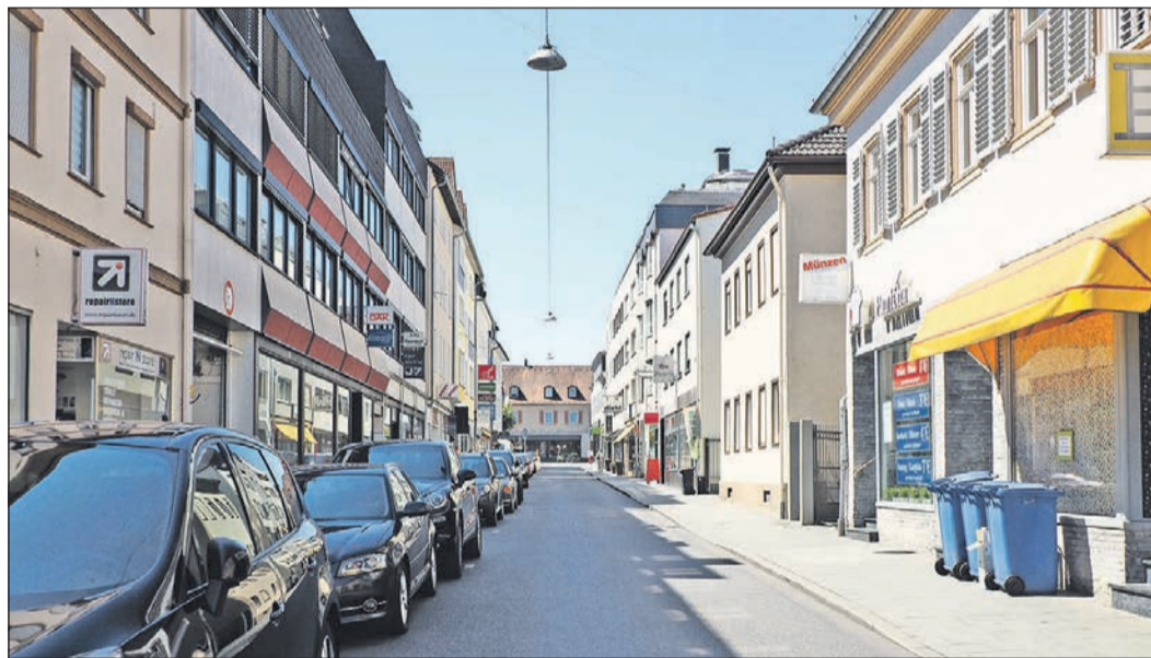
Die Haingasse verströmt das triste Flair einer Durchfahrtsstraße ohne Aufenthaltsqualität.