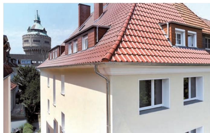
Nachhaltig gedämmt: Nach Jahrzehnten der Nutzung kann diese Wärmedämmfassade eines Wohnhauses in Münster recycelt werden.

weitere Nutzungen verwenden lassen. Einige Kommunen fördern diese nachhaltige Dämmung, indem sie für recyclingfähige Systeme Zuschüsse vergeben. Beispielsweise in einem 1952 gebautem Mehrfamilienhaus in Münster, dessen Fassade mit dem Wärmedämm-Verbundsystem weber.therm circle saniert wurde. Nach der regulären Nutzungszeit lassen sich die Systemkomponenten voneinander trennen - eine Voraussetzung für die Wiederverwertung.