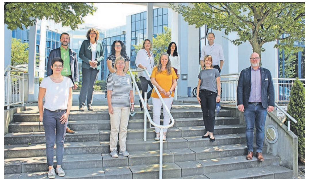
Lob gibt es für das Team der Agentur für Arbeit in Bad Homburg.

wesen war. Derzeit arbeiten 30 der 180 Mitarbeiter in den Bereichen des Kurzarbeitergelds und in der Arbeitslosengeldbewilligung. Mittlerweile sind die Rückstände der vergangenen Monate bearbeitet, bei Vorliegen aller Unterlagen dauert die Bearbeitung aktuell höchstens drei Tage. Die restlichen Mitarbeiter sind für die Hotline eingesetzt, die täglich mehr als 500 Kundenanliegen beantwortet. Trotz der hohen Arbeitsbelastung ist der Krankenstand niedrig und die Motivation der Mitarbeiter hoch. Die geänderten Arbeitsstrukturen werden die Mitarbeiter noch länger beschäftigen, und neue Aufgaben wie beispielsweise die Bearbeitung von Insolvenzgeldanträgen könnten schon bald hinzukommen. Das Vorstandsmitglied zeigte sich offen für die Belange der Mitarbeiter und fragte gezielt nach. Die Erarbeitung und Umstrukturierung von Abläufen, die die Mitarbeiter in diesen Zeiten entlasten sollen, hat er sich ebenso auf seine Fah-