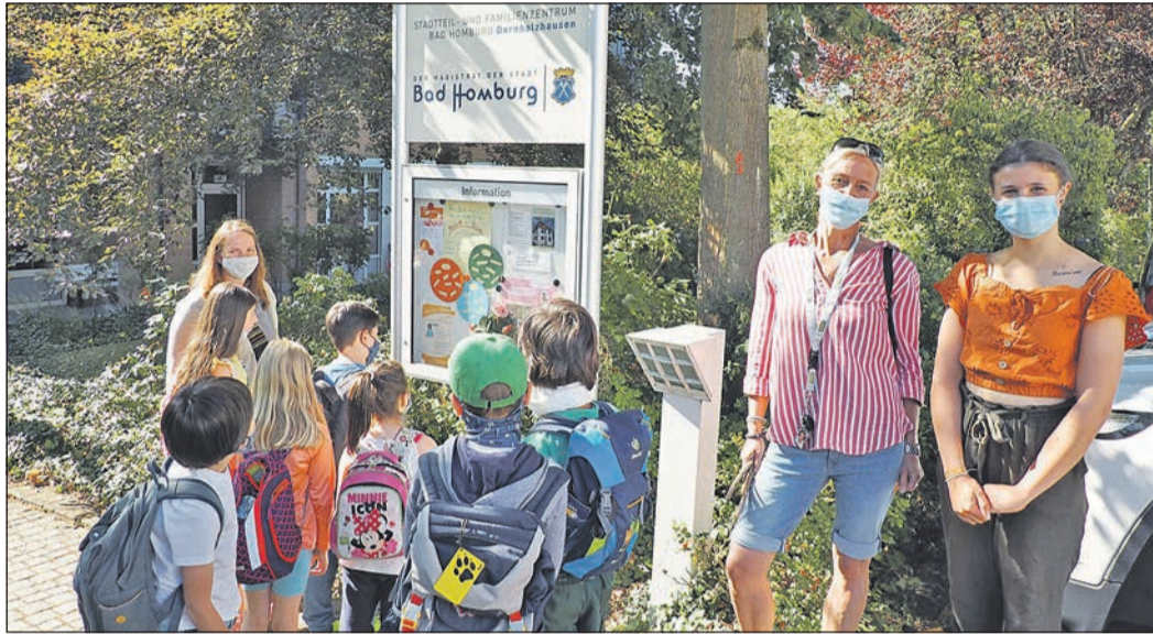
Zweit- und Viertklässler aus der Betreuung der Grundschule Dornholzhausen entdecken im Schaukasten Dornröschen und versuchen alle Fragen zum Märchen zu beantworten.