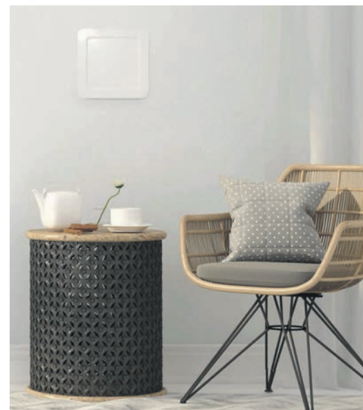
Durch sein dezentes Design fügt sich der Wandlüfter unauffällig in das Raumkonzept ein.

Der Wandlüfter passt den Volumenstrom automatisch und bedarfsgesteuert an die Raumbedingungen an, seine sparsame Betriebsweise und hohe Wärme-