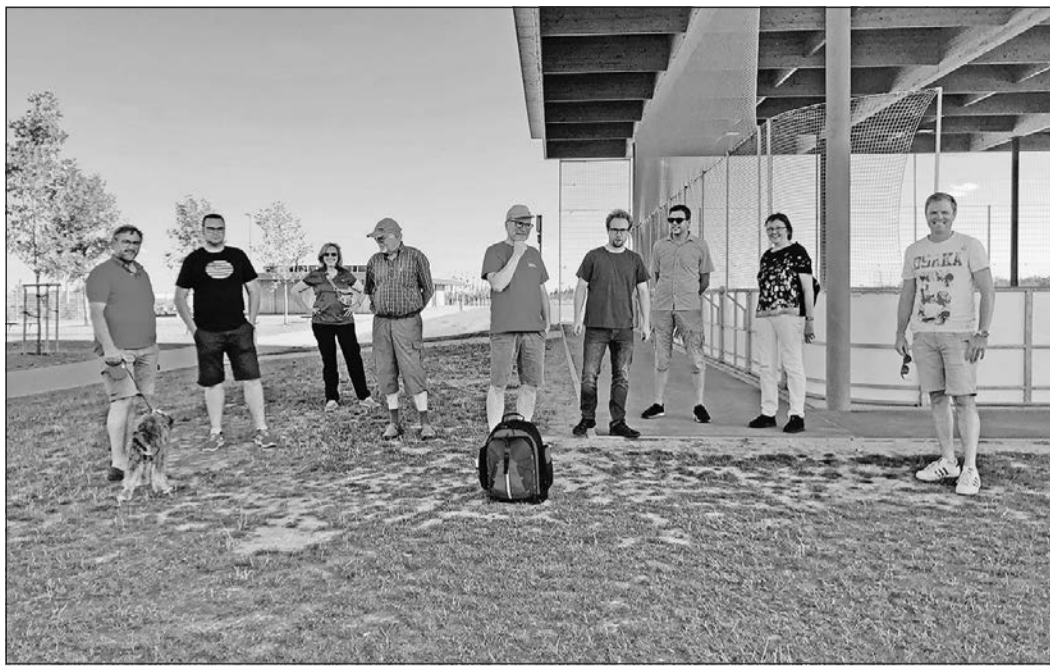
An der Rollschuhbahn im Sportpark treffen sich die Teilnehmer an der Sommertour der SPD Friedrichsdorf.