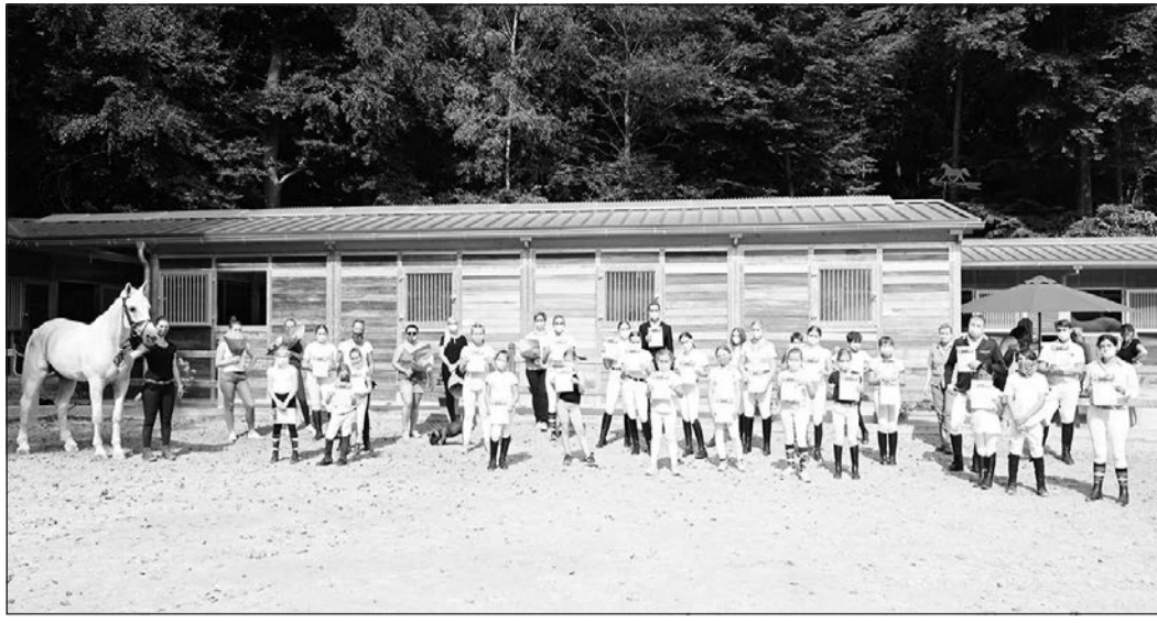
Teilnehmerrekord: 30 Reiter des Reit- und Fahrvereins Bad Homburg haben ihre Prüfungen gemeistert.