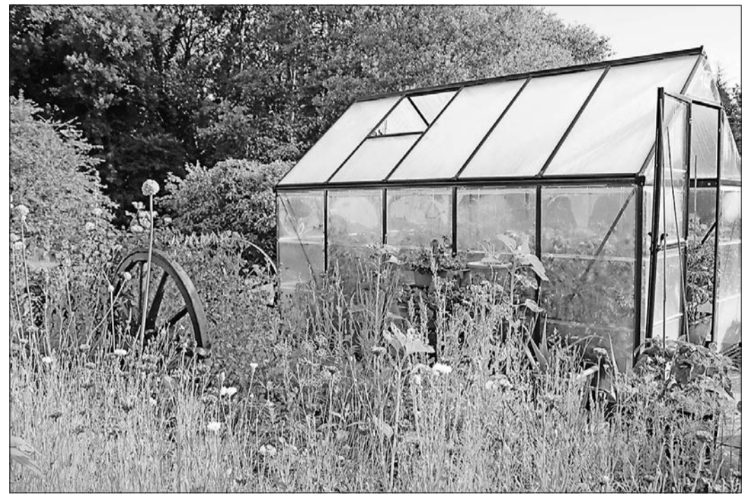
So schön blüht es derzeit im Stationsgarten bei Gewächshaus 2 dank der aktiven Gartenarbeit vieler Patienten.

Friedrichsdorf. Der Kunstraum Shin (Hugenottenstraße 85) erhält im Rahmen einer Projektförderung für das Katalogprojekt „!...?JaKyung Shin metalworks“ vom Ministerium für Wissenschaft und Kunst eine finanzielle Unterstützung in Höhe von 2300 Euro. Der Kunstraum Shin ist ein Raum für Kunstprojekte, offen für alle und ein Ort der Begegnungen. Eine Plattform für Künstler mit kreativen Projekten, sowie Kultur- und Kunstinteressierte mit aufgeschlossenen Augen. „Auch deshalb ist die gezielte Förderung eines der besonderen Anliegen der hessischen Landesregierung“, stellt Holger Bellino Landtagsabgeordneter der CDU fest, der die Förderung sehr begrüßt. „Ein reges kulturelles Leben im Landkreis stärkt dessen Lebensqualität und fördert die Identifikation der Einwohner mit dem Kreis, in dem sie leben“, führt er weiter aus.