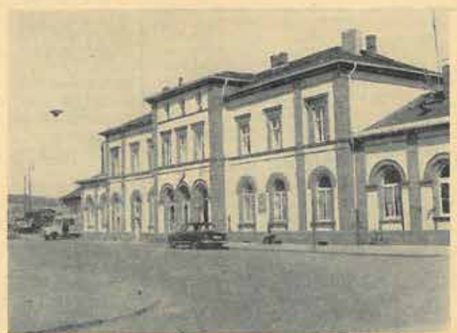
Im Herbst 1961 wird die Strecke Frankfurt—Fulda elektrifiziert sein. Mit den Arbeiten wird bereits begonnen.

Um aber bei der Bundesbahn zu bleiben, sei weiter zu erwähnen, daß das äußere Gewand des Bahnhofgebäudes auch Aussicht hat, lange Zeit sein helles und sauberes Aussehen zu bewahren: die Zeit der Dampfloks — damit auch der Ruß und Schmutz — geht im Kinzigtal seinem Ende entgegen.