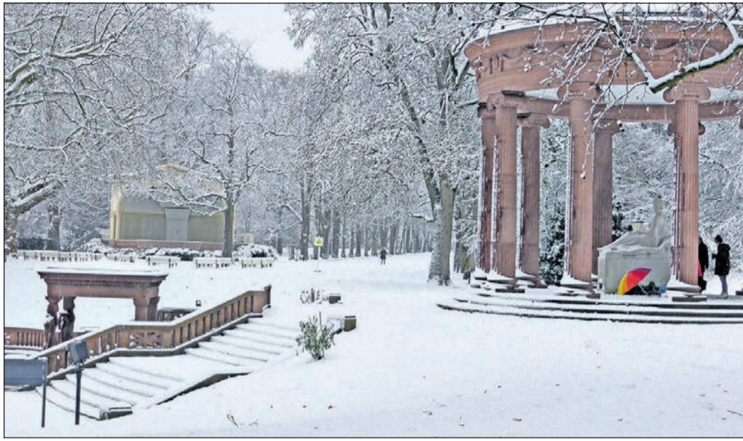
Seltener Anblick: Die Brunnenallee im Bad Homburger Kurpark bedeckt von einer Schneedecke.