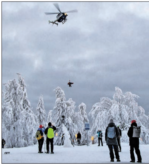
Spektakuläre Rettung am Sonntag am Altkönig: Per Hubschrauber und Seilwinde wird ein verletzter Spaziergänger geborgen und ins Krankenhaus gebracht.

Dazu arbeitet die Bergwacht mit der Polizeiliegertafel der Landespolizei in Egelsbach zusammen, deren Hubschrauber binnen weniger Minuten in der Luft sind und eine Einsatzstelle auch im abgelegenen Gelände direkt anfliegen können. Der Patient wurde mit einem speziellen Luftrettungssack zum Helikopter aufgezogen und in Begleitung des Bergwachtarztes direkt ins Unfallkrankenhaus nach Frankfurt geflogen.