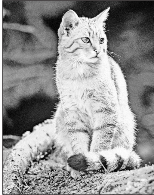
Die Europäische Wildkatze scheint sich in einigen Regionen Deutschlands langsam weiter auszubreiten.

mit sich. Steib: „Gerade in Gebieten, in denen noch wenige Wildkatzen leben, ist jede überfahrene Katze ein harter Verlust, der den gesamten kleinen Bestand gefährden kann.“ Der BUND ruft deshalb dazu auf, in diesen Monaten besonders auf Wildwarnschilder zu achten, die die Geschwindigkeitsbegrenzungen einzuhalten und den Straßenrand im Auge zu behalten.