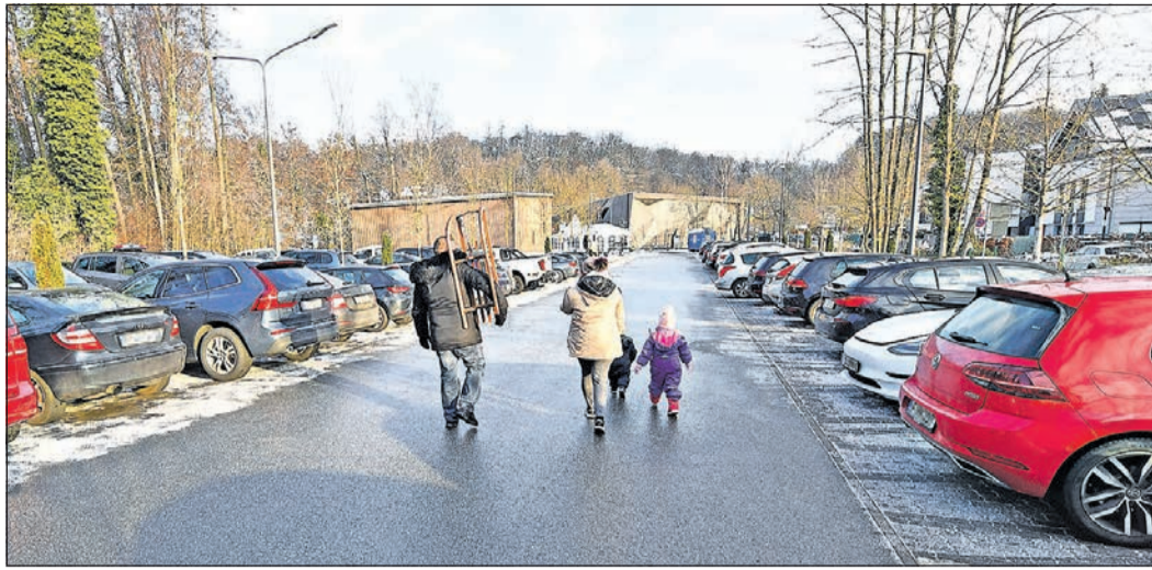
Rodelausflug im Schnee vom Taunus-Informationszentrum aus. Diese Idee haben viele Tages- touristen, wie der volle Parkplatz an der Hohemark zeigt.