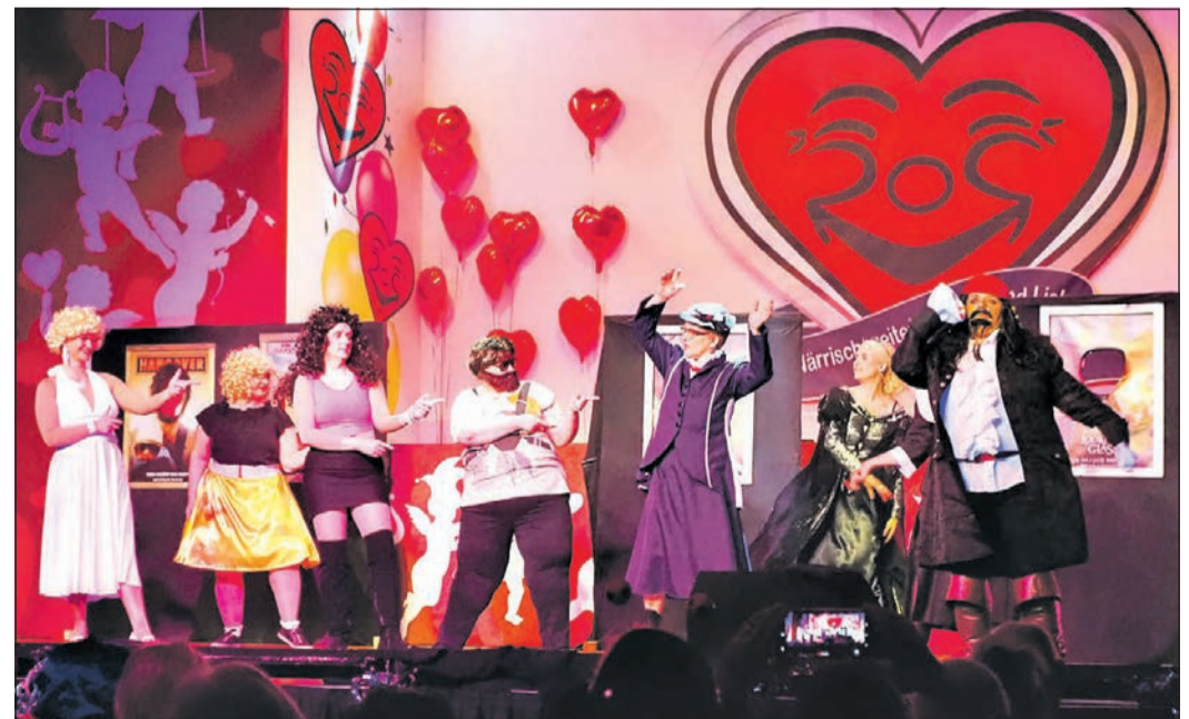
Ausgelassen gefeiert wurde noch im vorigen Jahr bei der HCV-Galasitzung, wo die „Silly Hearts“ einen Schautanz zum Thema Film und Kino zeigten. Diese Zeiten sind vorbei.

Eine Tradition wollen sich zumindest die „Orscheler“ Frohsinn-Narren auch vom Virus nicht nehmen lassen. Das Heringessen am Aschermittwoch muss sein. Und wenn's den kalten Fisch mit Pellkartoffeln eben nur in der Version „Hering to go“ gibt. Vorab bestellt, damit er am Drive-In-Schalter vor dem Vereinshaus keimfrei abgeholt werden kann. Ein Service, der in diesem verrückten Jahr allerdings nur für Vereinsmitglieder gilt.