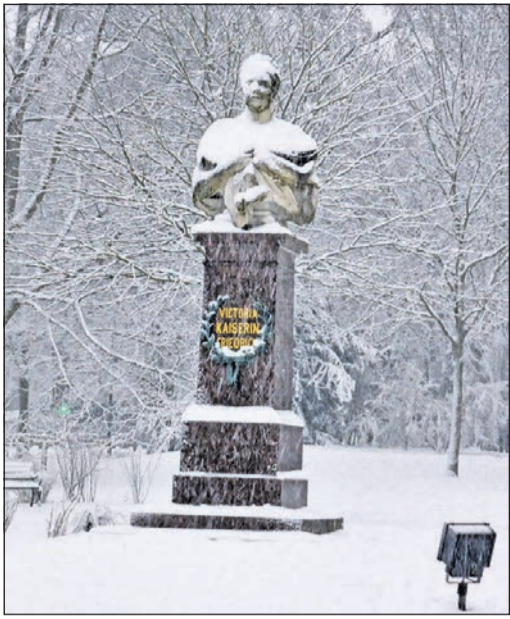
Verzaubert vom Schnee: Auguste Viktoria auf ihrem Sockel.