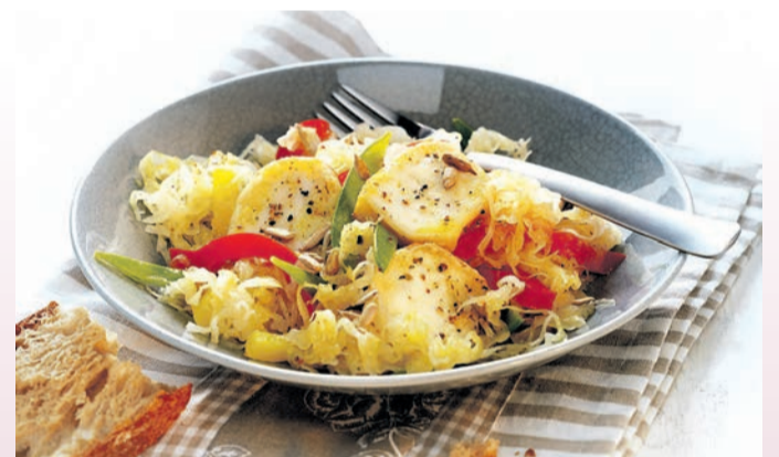
Sauerkraut trifft auf Paprika und leckeren Ziegenkäse.

Gesellschaft für Ernährung (DGE). Außerdem unterstützen die enthaltenen Ballaststoffe und die Milchsäure die Verdauung und sorgen für eine gesunde Darmflora - und das alles bei nur 22 Kalorien pro 100 Gramm. In der Küche ist das Gemüse-Kraftpaket herrlich vielseitig, schmeckt nicht nur traditionell als Beilage, sondern auch als Belag herzhafter Kuchen, als knackiger Salat oder Zutat für köstliche Ofengerichte. Im Internet finden gesundheitsbewusste Genießer tolle Sauerkrautrezepte, von „Sauerkraut-Salat mit geräuchertem Forellenfilet“ über „Wraps mit Sauerkraut, Räucherlachs und Kresse“ bis hin zu „Gefüllte Kalbsröllchen mit Riesling-Kraut“ und „Piroggen mit Sauerkrautfüllung“. Lecker - nicht nur für Vegetarier - ist der Sauerkraut-Salat mit Ziegenkäse.