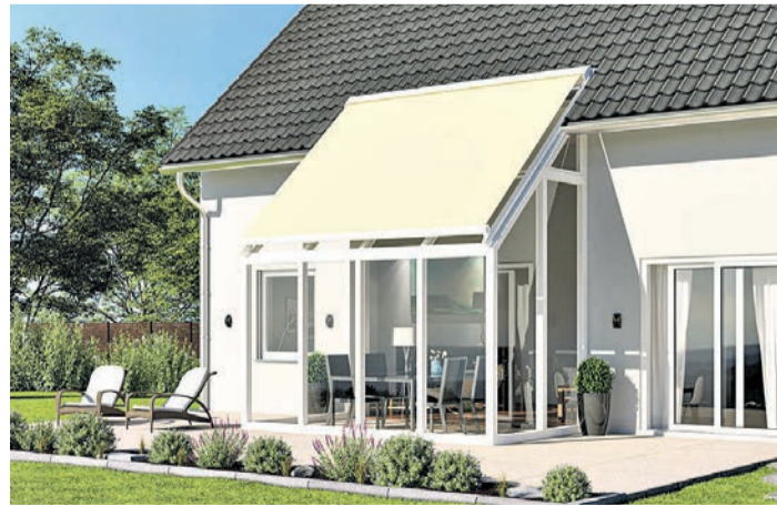
Jedem Glasdach seine Markise: Im Herbst und Frühling wärmt die Sonne die Flächen unter Glas angenehm auf, an wärmeren Tagen kann es ohne Sonnenschutz zu heiß werden.

zur Rundum-Verglasung mit perfektem Wetterschutz ausbauen, der den Aufenthalt auf der Terrasse bis weit in den Herbst und bereits im zeitigen Frühjahr zu einem Vergnügen macht. Modular aufgebaute Systeme wie die Murano-Baureihe von Lewens Markisen lassen sich schnell, einfach und ohne viel Aufwand errichten, Infos dazu unter www.lewens-markisen.de . Mit integriertem Sonnenschutz oder einer Aufdach- oder Unterdachmarkise machen sie den heimischen Outdoorbereich fast das ganze Jahr lang nutzbar.