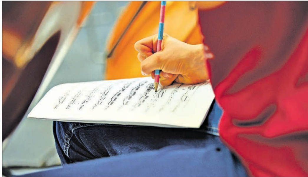
Vom 6. bis 13. Juli findet in der Bad Homburger Jugendherberge die Probenwoche für das Jugend-Sinfonie-Orchester Hochtaunus statt.

Bad Homburg (hw). Oberbürgermeister Alexander Hetjes lädt für Mittwoch, 20. Januar, zur persönlichen Bürgersprechstunde ins Rathaus oder alternativ zur Videosprechstunde ein. Bad Homburger Bürger, die ihr Anliegen gerne persönlich mit dem Oberbürgermeister besprechen möchten, haben während der Bürgersprechstunde die Gelegenheit dazu. Es wird um Einhaltung der geltenden Corona-Schutzmaßnahmen gebeten. Voraussetzung für die Teilnahme an der Videosprechstunde ist ein kostenloser Gastzugang via Microsoft Teams sowie ein Endgerät mit Kamera und Mikrofon (Kopfhörer). Damit für alle Bürger genügend Zeit eingeplant werden kann, bittet die Bürgerbeauftragte um vorherige Anmeldung und eine kurze Schilderung des Anliegens per E-Mail an buergersprechstunde@bad-homburg.de . Anmeldungen werden bis zum 18. Januar entgegengenommen. Die Bürgerbeauftragte wird sich nach Anmeldeschluss nochmal mit den jeweiligen Bürgern in Verbindung setzen. Es wird um Verständnis gebeten, dass je nach Anmeldelage einige Anliegen schriftlich durch den Oberbürgermeister oder telefonisch durch die Bürgerbeauftragte beantwortet werden.