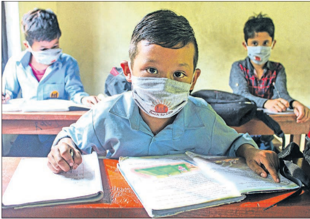
Die Mädchen und Jungen, die der Bad Homburger Verein „Back to Life“ in Nepal betreut, sind glücklich, endlich wieder zur Schule gehen zu können.