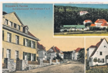
Historische Postkarte „Nervenheilanstalt Köppern“

dem Gründer Emil Sioli, einem engagierten Arzt, der bei der Behandlung der „Geisteskranken“ konsequent für die damalige Zeit noch ungewöhnliche Wege ging. Statt die Patienten wegzusperren, setzte er auf Zuwendung, Geduld und Güte. Er führte bereits 1888 an der Frankfurter „Anstalt für Irre und Epileptische“ begleitete Spaziergänge statt der Verwahrung in Zwangsjacken ein. Als zur Entlastung dieser Einrichtung ein Neubau anstand, wurde unter seiner Leitung „Die Neuen Heilanstalten Neufeld und Hüttenmühle für physisch Kranke und Nervöse der Stadt Frankfurt am Main im Köpperner Tal“ errichtet. Ein historisches Zeugnis dieser Zeit legt auch das Teehaus von Emil Sioli ab, das auf dem Gelände des Waldkrankenhauses zu besichtigen ist. Daneben findet sich auf dem Klinikgelände auch noch ein historisches Fachwerkgebäude, das damals als Barackengebäude zu der „agrikolen Kolonie zur Therapie von alkoholkranken Männern“ gehörte. Verbunden mit der ruhigen ländlichen Umgebung, sollten damals agrikole Kolonien mit landwirtschaftlicher Arbeit zur Gesundung verhelfen.