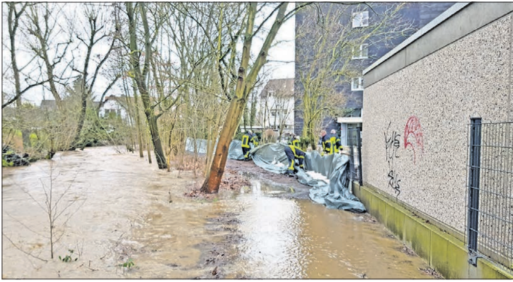
Zwischen dem in weiten Teilen überschwemmten Uferweg und den Hochhäusern in der Kurhessenstraße hat die Feuerwehr eine lange Barriere aus Sandsäcken und Plastikplanen errichtet.