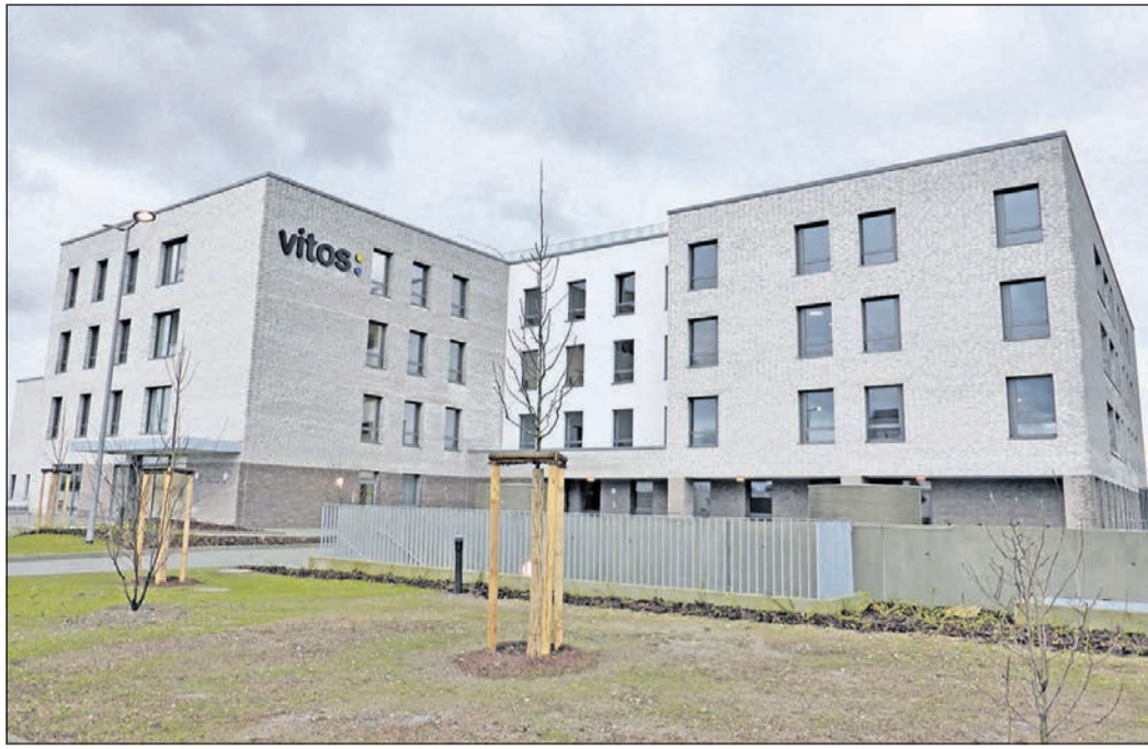
Ein Haus mit vielen Fenstern: Ab 15. Februar werden Patienten, Ärzte und medizinisches Personal aus dem Klinikum Köppern in den Neubau der Vitos Kliniken für Psychiatrie, Psychotherapie und Psychosomatik auf den Gesundheitscampus umziehen.