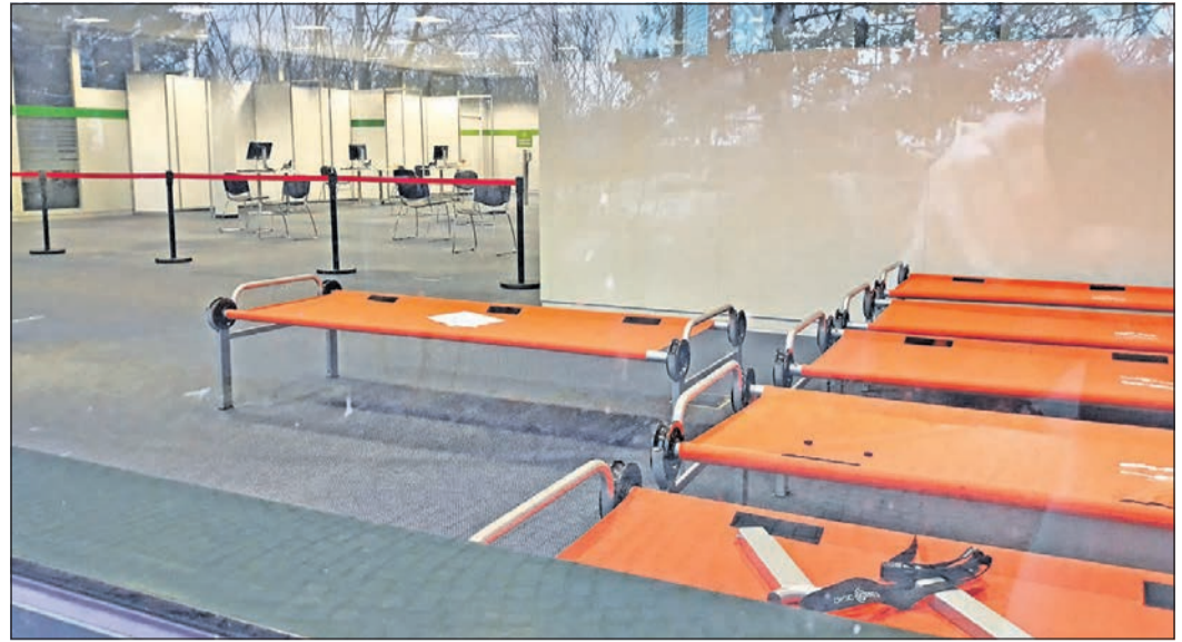
Im riesigen Wartezimmer können rund 40 Impfwillige in ausreichendem Abstand auf den Nadelstich warten. Im Hintergrund der Bereich mit den Impfkabinen, für die Ausruhzonen stehen orangefarbene Liegen bereit.

„Ein Jahr werden wir brauchen“, schätzt der Gesundheitsdezernent des Kreises, Thorsten Schorr. „Bis zu 1000 Impfungen könnten wir pro Tag hinkriegen“, so Schorr, wenn genug Impfstoff da ist. Im Zwei-Schicht-Betrieb soll täglich von 7 bis 22 Uhr gearbeitet werden. Je 100 Ärzte, Apotheker, Beschäftigte aus den Bereichen Krankenpflege, pharmazeutisch-technische Assistenz oder mit vergleichbarer Qualifikation sollen die Arbeit bewältigen, ungefähr 850 Bewerbungen sind insgesamt laut Schorr beim Kreis eingegangen. Hinzu kommen die mobilen Teams, die bereits seit Ende Dezember unterwegs sind und in Alten- und Pflegeheimen impfen. Rund 60 Prozent der Senioreneinrichtungen haben bereits Besuch von einem Impfteam bekommen, 3400 Menschen eine Erstimpfung erhalten, 1400 bereits die zweite Dosis. Schorr: „Bis Ende Februar wollen wir alle Alten- und Pflegeheime im Kreis durchgeimpft haben.“ Ein Risiko bleibt natürlich: Nicht alle Bewohner sind bereit zu