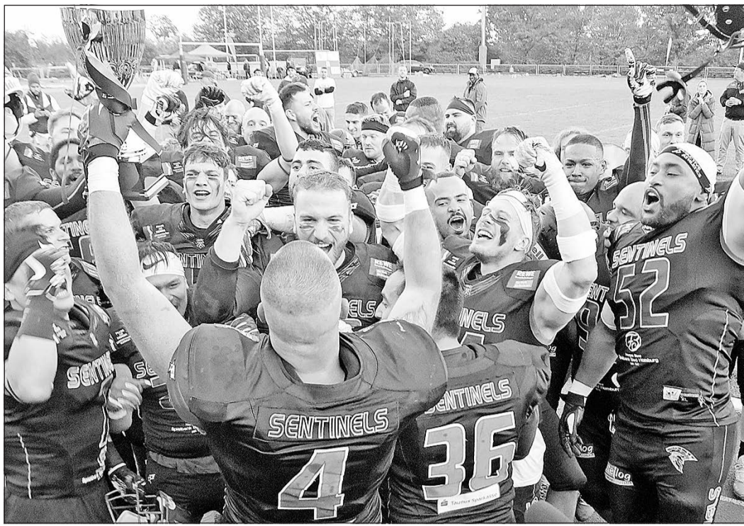
Nach der Meisterschaft in der Football-Regionalliga Mitte freuen sich die Bad Homburg Sentinels auf die Saison 2021 in der 2. Bundesliga Süd.