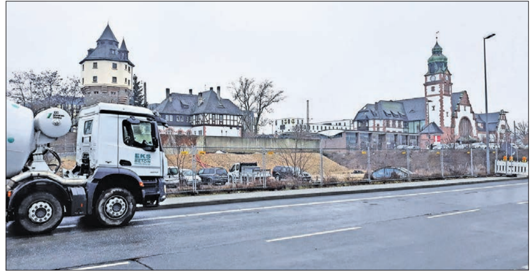
Der Bau des Kinocenters mit Club am Bahnhof gehört zu den Langzeitprojekten. Wohl schon Mitte Februar könnte der Spatenstich anstehen.