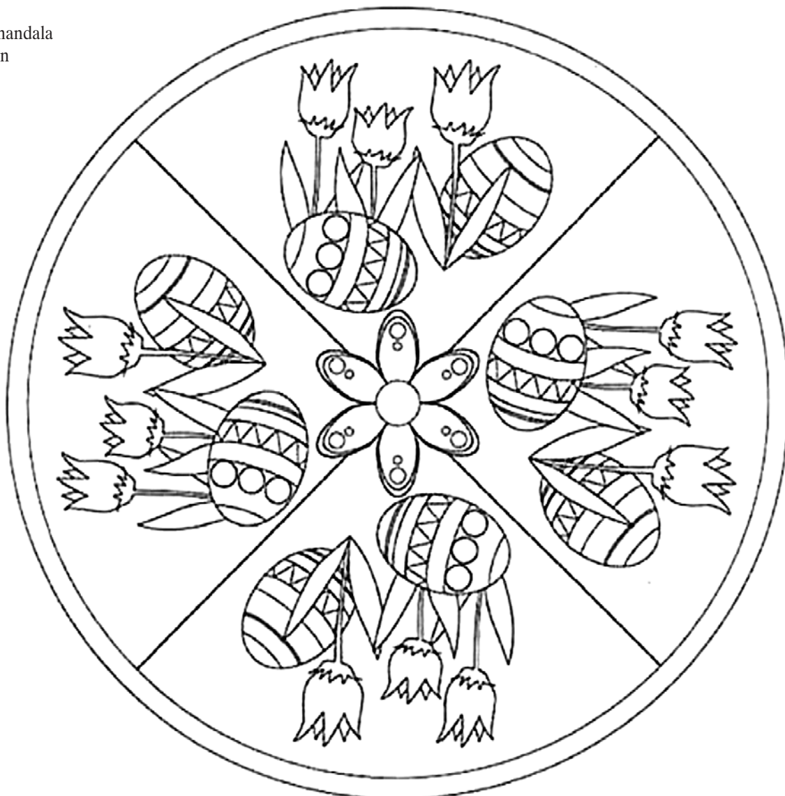
Kleines Ostermandala zum Ausmalen