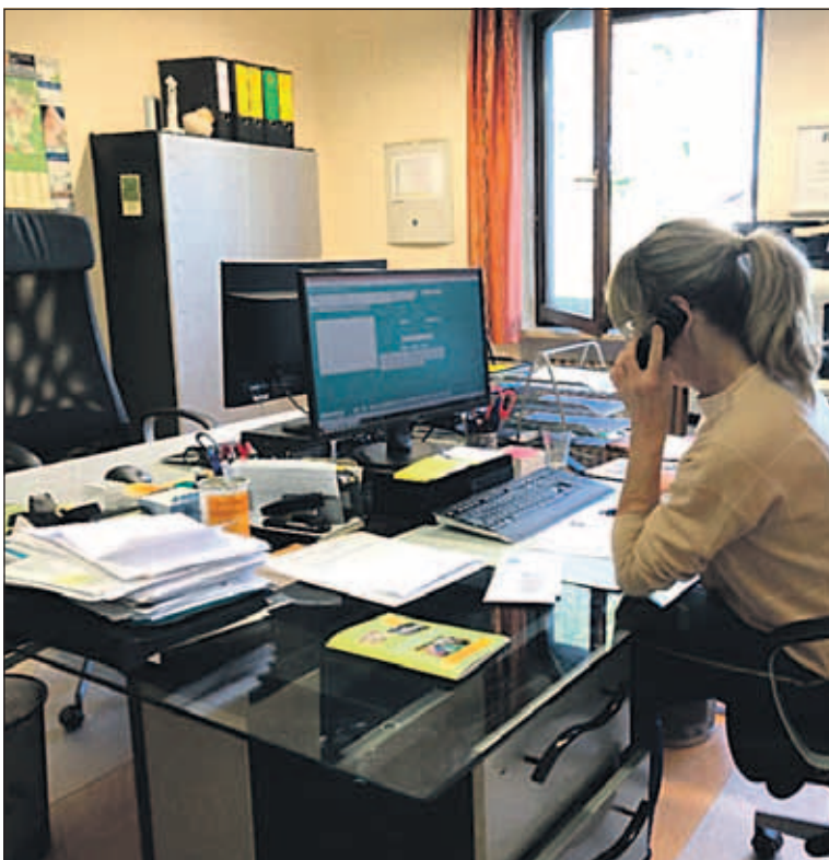
„Bürodienst der Nachbarschaftshilfe“

Das Büro der Nachbarschaftshilfe ist telefonisch zu erreichen: 06128 740 123 Montag und Mittwoch von 10:00 bis 12:00 Uhr Dienstag und Donnerstag von 16:00 bis 18:00 Uhr Außerhalb dieser Zeiten können Sie uns Ihre Nachricht auf dem Anrufbeantworter hinterlassen. Per Mail: kontakt@nachbarschaftshilfe-taunusstein.de