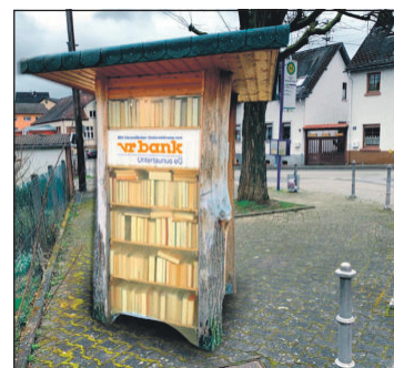
Illustration Bücherturm Orlen – so könnte er aussehen.

Die erforderlichen Materialkosten werden über Spenden gesammelt. Die vr bank Untertaunus eG hat dazu ein Projekt auf Ihrer Finanzierungsplattform „Viele schaffen mehr“ bereitgestellt. Auf dieser Internetseite der Region dürfen gemeinnützige Vereine für Projekte werben und Spenden sammeln