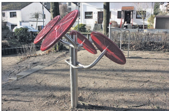
Auf einem separaten Gelände neben dem Spielplatz Am Dattenbach stehen Fitnessgeräte für Erwachsene.

„Die Kinder haben ihn längst erobert“, hat Nachbarin Elke Mussong-Plugge beobachtet, aber sie glaube schon, dass auch ältere Menschen die vier Fitnessgeräte nutzen werden, „sobald es wieder warm ist“. Ähnlich äußert sich auch Anwohnerin Karin Lüttich, im Sommer seien viele Jogger und Spaziergänger am Dattenbach unterwegs. „Es wäre allerdings gut, wenn die Stadt auf einem Schild an der Straße darauf hinweisen würde“, sagt sie. So hielten viele die Trainingsgeräte für Kinderspielgeräte.