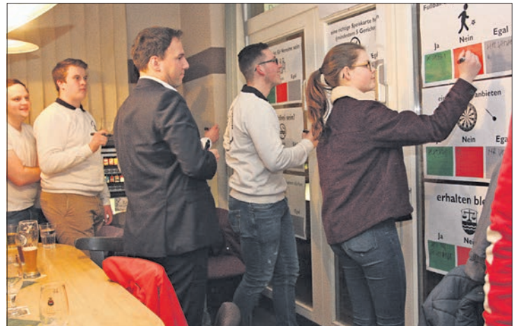
Viele Ehrlhalterner nutzten die Gelegenheit, ihre Wünsche fürs Bistro mitzuteilen.

SPD-Stadtverordnete Marion Küttemeyer schlug vor, eine Genossenschaft zu gründen, damit Bürger den Betrieb der Gaststätte selbst organisieren können. Simon zieht diese Option erst als letzte Möglichkeit in Betracht, „wenn wir keinen neuen Pächter finden“. Ortsvorsteher Michael Kilb berichtete, dass er ge-