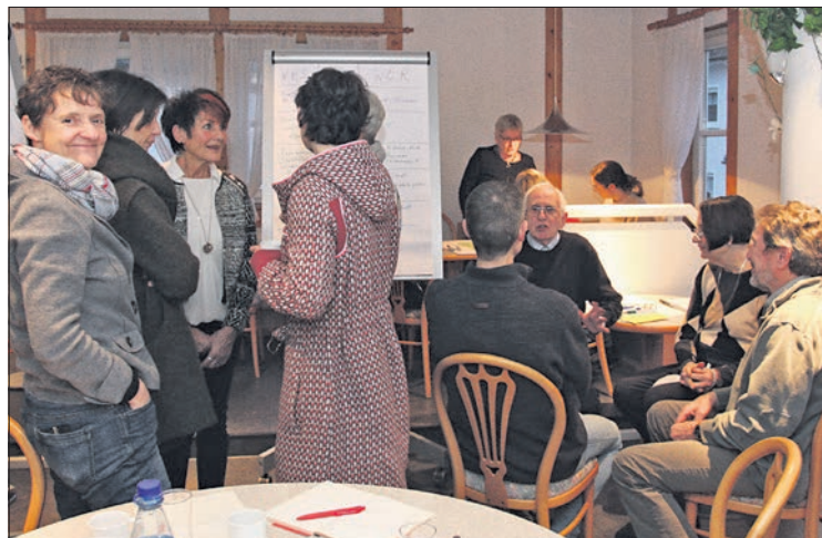
Die Workshop-Teilnehmer arbeiteten und sprachen in kleinen Gruppen über neue Projekte.

Über Fördermittel hatte sich eine Gruppe um