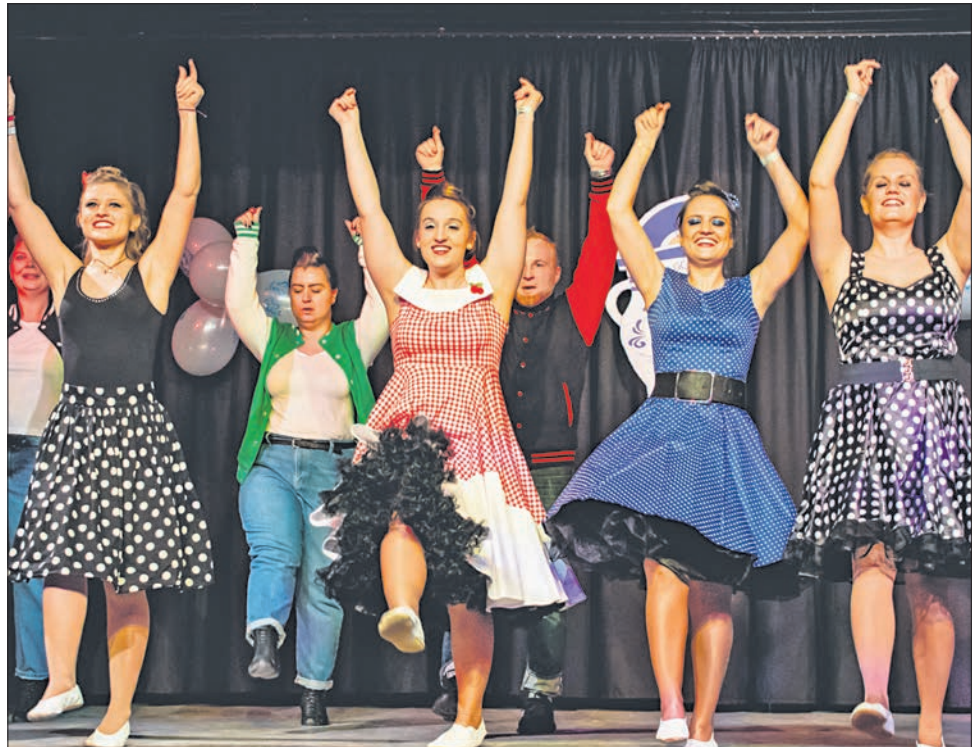
In Pettycoat und Jeans begeisterte die Garde Solaris mit Grease.

Sturmtief „Sabine“ hielt mit Böen mit Windgeschwindigkeit von rund 100 Km/h in der gesamten Region Feuerwehren und Rettungsdienste auf Trab. Im MTK rückten sie im Laufe des Sonntags und Montags zu 60 Einsätzen aus. In Eppstein wurde die Feuerwehr allein zu 15 Einsätzen gerufen. Weiter auf Seite 11