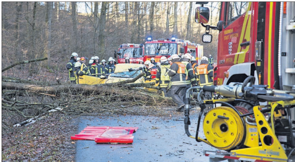
Ein Baum stürzte am Montagmorgen auf der Straße zwischen Oberjosbach und Niederjosbach auf ein fahrendes Auto. Die Feuerwehr befreiten den verletzten Fahrer.

Der erste Alarm zum Sturminsatz in Eppstein traf in der Nacht zum Montag gegen 3.12 Uhr in der Leitstelle ein. In den darauffolgenden Stunden bis gegen 16 Uhr rückten die fünf Stadtteilwehren teilweise gemeinsam zu 15 Einsätzen im Stadtgebiet aus: In der Burgstraße riss ein Baum das Vordach eines Hauses ab. In der Nachbarschaft fiel ein Baum in eine Stromleitung und verursachte einen Stromausfall. Die Feuerwehr schnitt den Baum zurück, während Techniker des Stromversorgers Syna