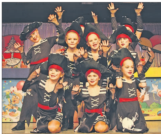
Die Mädchen der Mäuse-Garde beim Piratentanz.

Nach der Polka der Delphine und Schmetterlinge traten die beiden Rathausoberen gemeinsam als Schultheiß und Schatzkanzlerin, zwei Zeitreisende aus dem Mittelalter, in die Bütt. Alle Ausgaben der Eppsteiner Zeitung der vergangenen zwölf Monate hätten sie studiert und festgestellt: „Kaum waren Bürgermeister und Kämmerin wiedergewählt, wurde an der Steuerschraube gedreht.“ Eine Biosphärenregion wär' was Feines, „wenn's kommt aus der Region“, nahm Schultheiß Simon das neueste