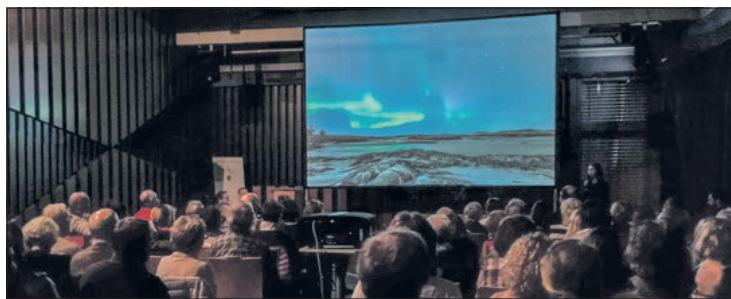
Karge Landschaften, sternenhelle Nächte und magische Himmelslichter über den Lofoten beeindruckten die Zuschauer.