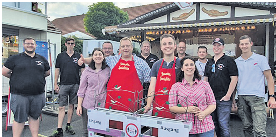
Die Kerbeurschen machten auf Ihrer Spenden-Tour bei Axels Imbiss-Team Pause.