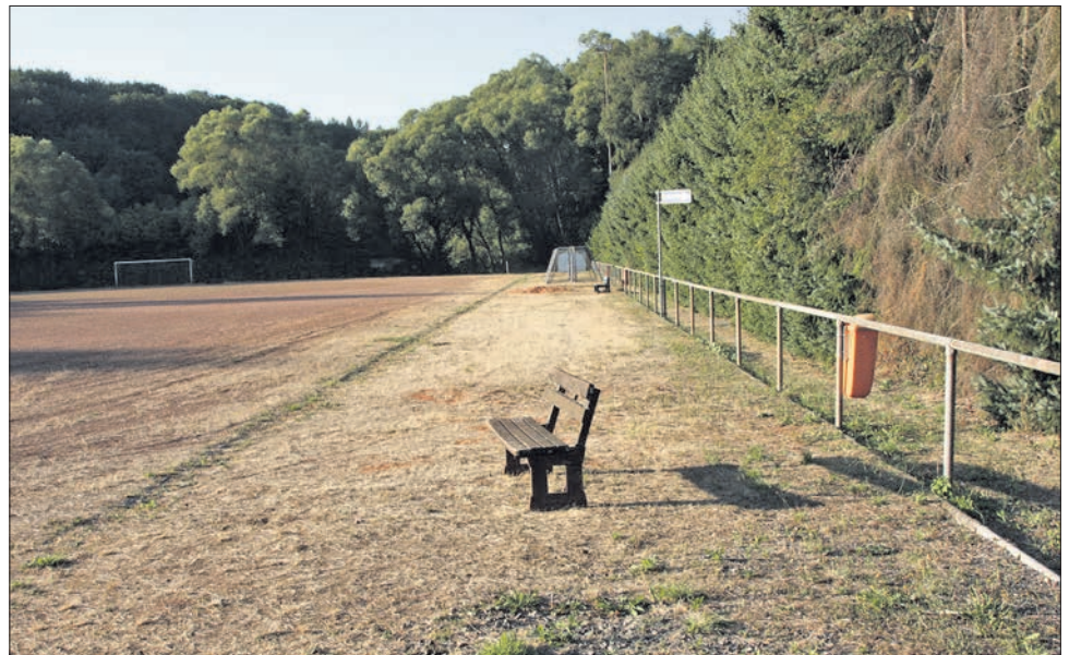
Links der Fußballplatz der Sportfreunde, rechts weist ein Schild auf den Durchgang zum TSV-Gelände hin. Eine einsame Bank erinnert daran, dass hier früher Zuschauer die Fußballer anfeuerten.

Zu einer Informationsveranstaltung interessierter Glasfaser-Unterstützer lädt die Initiative „Glasfaser für Alt-Eppstein“ für Mittwoch, 19. August , um 19.30 Uhr in das Botanical, Am Quarzitbruch 5, im Eppsteiner Gewerbegebiet in Bremthal ein (s. Meldung auf Seite 5).