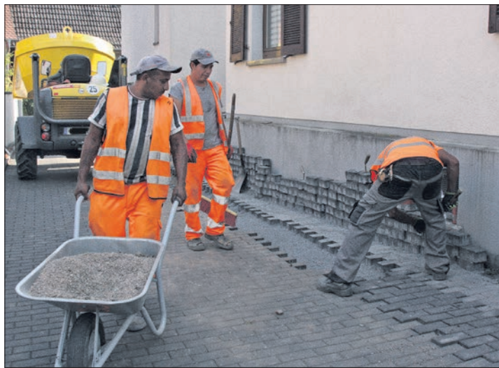
Zurzeit werden Hausanschlüsse in der Wiesbadener Straße verlegt. jp

Auch im Gewerbegebiet Guldenmühle startet die Stadt einen erneuten Aufruf an die dort angesiedelten Gewerbebetriebe. Auch sie haben laut Bürgermeister Alexander Simon noch einmal die Möglichkeit, sich für einen Glasfaseranschluss durch die DG zu entscheiden. Zwar liegt das Gewerbegebiet unmittelbar an einem Glasfaserknotenpunkt. Bisher scheint es jedoch nicht gelingen zu sein, die Betriebe zufriedenstellend ans Glasfasernetz anzuschließen.