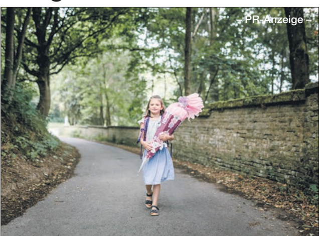
Den besonderen Moment der Einschulung hält Miriam Castle-Weiss in natürlichen Fotos fest.

Gemeinsam mit der Grafikerin Sandra Diepolder aus Eppstein hatte sie die Idee für das Schulstart-Fotoshooting. Miriam fotografiert Schulanfänger in der Natur mit ihrer Schultüte und ihrem Ranzen, Sandra kümmert sich um die Deko. Zusätzlich können Fotos mit den Eltern und der ganzen Familie aufgenommen werden. Natürliche Portraits ohne Schul-