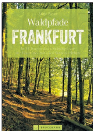
Wanderwege im Wald.