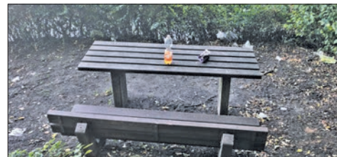
Kein malerischer Anblick im Malerwinkel.

Auch die Kritik der SPD zur Erneuerung von Straßenmarkierungen in Höhe des katholischen Kindergartens in Bremthal sei angekommen, sagte der Rathauschef. „Wir haben diese Markierung im Plan“, meinte Simon, allerdings sei es extrem schwierig, eine Firma zu finden, die solche Einzelaufträge annimmt. „Wir sammeln schon immer, damit mehrere Arbeiten zusammenkommen“, sagt Simon und versichert: „Das Piktogramm für den Kindergarten steht auf unserer Liste.“ bpa