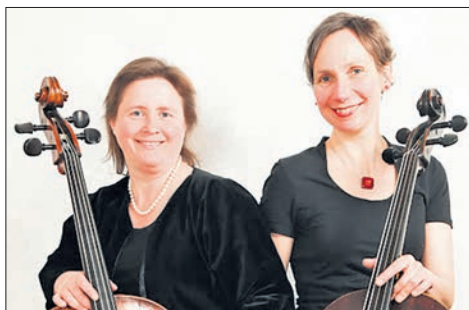
Klingende Saiten – das Duo Le cor-de sonanti.

Da die Anzahl der Besucher wegen der Corona-Abstandsregeln begrenzt ist, ohnedies alle Gäste ihre Kontaktdaten und Adresse angeben müssen zur Rückverfolgung etwaiger Infektionen, wird eine vorherige Anmeldung unter der Nummer 8533 oder E-Mail gemeinde@talkirche.de erbeten. Spontane Gäste sind, soweit der Platz reicht, willkommen. Bis zum Einnehmen und beim Verlassen des Sitzplatzes ist einen Mund-Nasen-Schutz zu tragen.