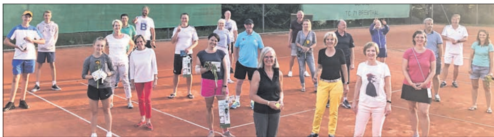
Gut gelaunt bei den Clubmeisterschaften Mixed im TC 71 Bremthal: Wer Lust und bis zum Schluss ausgeharrt hatte, kam auch auf das Gruppenbild.

Der TC 71 Bremthal kürte am vergangenen Wochenende seine Clubmeister im Mixed. Mit insgesamt 54 ausgetragenen Spielen in den Kategorien Mixed und Mixed50 übertraf das Turnier mit 20 Teams sogar den Wettbewerb des vorigen Jahres. Bei