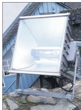
Die alten Stromfresser haben ausgedient. Die neue Beleuchtung hat insgesamt so viel Leistung wie einer der alten Strahler.

Euro für die neue Burgbeleuchtung. Spenden von fast 33 000 Euro im Jahr 2019 – darunter allein 15 000 Euro von Arne Fiedler, der das Beleuchtungskonzept sponsort. Das Prestige-Projekt des Burgvereins ist auf der Zielgeraden.