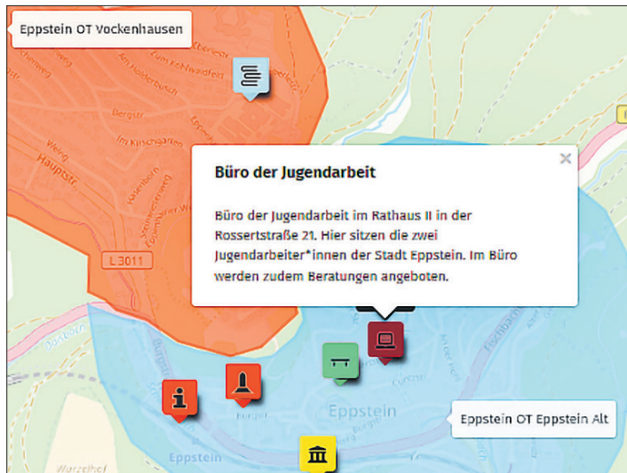
Auf der Sozialen Landkarte sind Institutionen, Einrichtungen und Orte, die für Jugendliche von Bedeutung sind, abgebildet.

Vereine verstehen ihre Aufgabe darin, generationsübergreifend zu arbeiten, hat Carls den Interviews entnommen. Sie erleben, dass Jugendliche zunehmend unter Stress stehen und regen an, Orte zu schaffen, an denen Jugendliche zusammenkommen können und die sie selbst gestalten können. In den Interviews wurde auch über Alkoholkonsum und andere Substanzen gesprochen. Viele Vereine verstehen ihre Aufgabe neben der Vermittlung des Vereinszwecks auch darin, dass Jugendliche sich innerhalb bestimmter Grenzen aus-