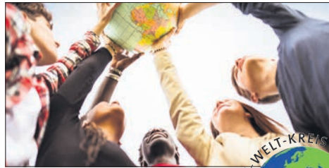
Im Mittelpunkt der Fairen Woche und der Arbeit des Eine-Welt-Kreises steht der faire Handel als Beitrag zu globaler Gerechtigkeit sowie Nachhaltigkeit.

Der Eine-Welt-Kreis Eppstein beteiligte sich