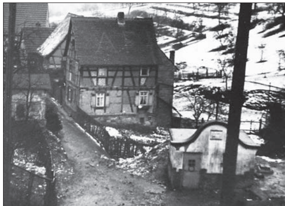
Das Pumpenhaus am Bornberg um 1950.

Die Entscheidung, wie das Pumpenhäuschen in Zukunft aussieht, wird jedoch vom Denkmalschutz mitbestimmt. bpa