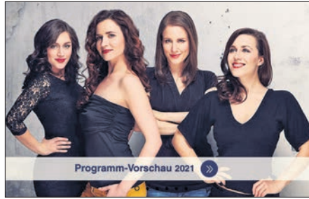
Auf seiner neu gestalteten Internetseite wirbt der Kulturkreis für sein Programm.

Am 3. September tritt das bereits zweimal vergeblich eingeeplante A-Cappella-Ensemble Les Brunettes in Eppstein auf. Seit dem Bestehen des Ensembles haben die schönen brünetten Sängerinnen rund 350 Konzerte gegeben. Auch mit namhaften Orchestern wie dem britischen Pasadena Roof Orchestra oder der HR-Big Band sind sie schon aufgetreten.