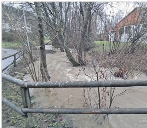
Regenfälle und Schneeschmelze im Januar ließen den Dattenbach in den Ehlhaltener Rainwiesen anschwellen.

Berichte der in die Eppsteiner Gremien gewählten Parteien und Wählergruppen sind namentlich gekennzeichnet. Für den Inhalt sind die Verfasser/Parteien verantwortlich.