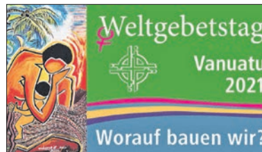
Das Logo des Weltgebetstags.

Zweckgebundene Spenden für die Projekte des Deutschen Weltgebetstagskomitees können mit dem Verwendungszweck „WGT-Kollekte Vanuatu“ bis 28. März überweisen werden an: Katholische Kirchengemeinde Eppstein, IBAN: DE35 5125 0000 0047 0008 58 oder Evangelische Frauen in Hessen und Nassau, IBAN: DE14 5206 0410 0004 1007 19.