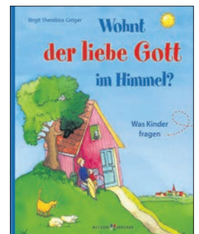
Das Buch hat Birgit Gröger mit schönen Zeichnungen illustriert.

„Wohnt der liebe Gott im Himmel?“ ist im Verlag Butzon & Bercker erschienen. Es hat 60 Seiten und ist illustriert für 9,95 Euro im Buchhandel erhältlich.