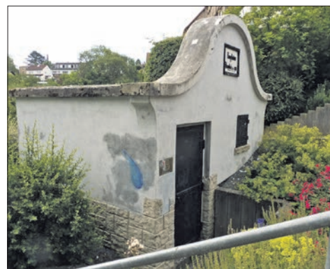
Helfer der SPD Bremthal haben Risse am Putz des Pumpenhauses ausgebessert und abgedichtet und Schmierereien entfernt. Jetzt fehlt noch ein neuer Anstrich und die Bitumenabdeckung für den Frontbogen.

Jetzt hofft Lange, dass die Stadt bald einen Gutachter beauftragt, der den ursprünglichen Farbanstrich zutage bringt. Die Stadt habe bereits zugestimmt, das prüfen zu lassen, berichtet Lange. Er vermutet, dass der Anstrich einmal weiß oder grau war.