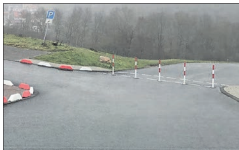
Der neue Fußweg, den der Kreis anlegen ließ, ist rechts im Bild.