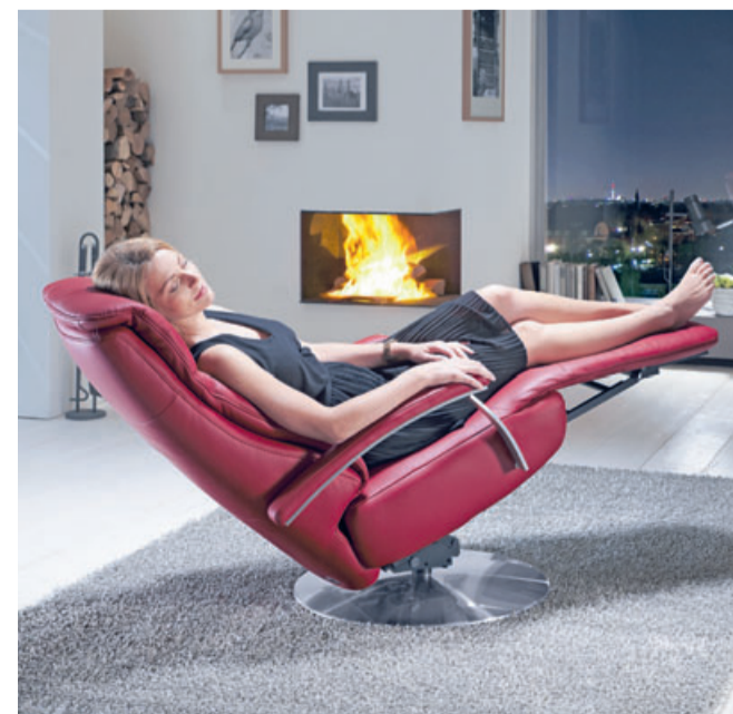
Endlich Feierabend – die Herz-Waage-Position ist Entspannung pur.

T-Steppung ausgestattet ist, ist die motorische Aufstehhilfe integriert. „Ein maßgefertigter Orthopädika Relaxsessel hat alles, um zum Lieblingsplatz zu werden. Wir konzentrieren uns ganz darauf unseren Kunden zu Ihrem Lieblingsplatz zu verhelfen.“ cp