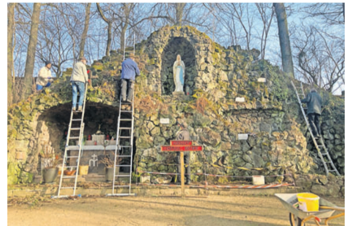
Freiwillige Helfer bei der Arbeit.