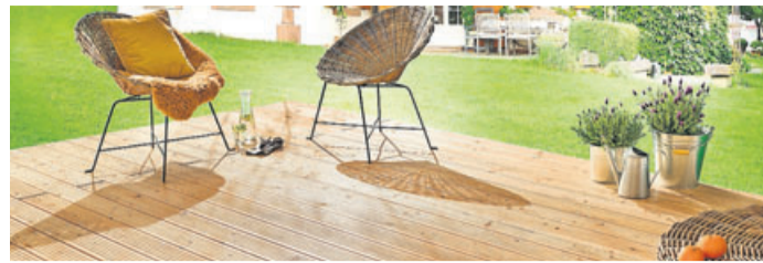
Nachhaltiges Terrassenholz erkennt man am Siegel.

Wohnzimmer im Grünen mit heimischen Hölzern