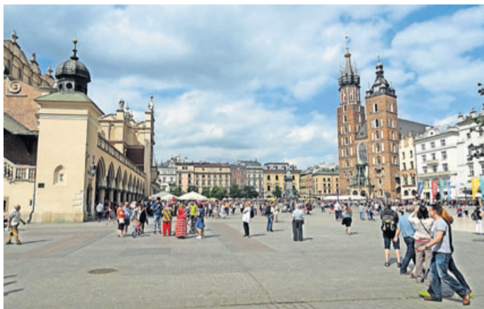
Rathausplatz der Stadt Krakau, die in diesem Jahr neben Jarocin wieder einmal vorrangiges Ziel der Reise sein wird.

Einen Schwerpunkt der Studien- und Begegnungsreise ins Nachbarland Polen bilden Besuch und ausgiebige Besichtigungen in der alten Königsstadt Krakau an der Weichsel, wegen ihres einzigartigen historischen und kulturellen Erbes auch die „heimliche Hauptstadt Polens“ genannt. Hier war die Wirkungsstätte des Erzbischofs Karol Wojtyła. Als – inzwischen heiliggesprochener – Johannes Paul II. ist er als Papst in die Weltgeschichte eingegangen, der den Eisern