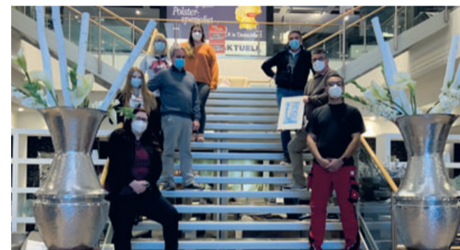
Das ganze Polster Aktuell Team freut sich auf Sie.

„Wir haben bereits die Erfahrung gemacht, dass unsere Kunden es besonders schätzen, dass sie einen persönlichen Beratungstermin vereinbaren können“, so Müller. „Das Gespräch mit einem Mitarbeiter kann dann ganz entspannt, vertrauensvoll, sicher und in einer völlig stressfreien Atmosphäre stattfinden.“ cp