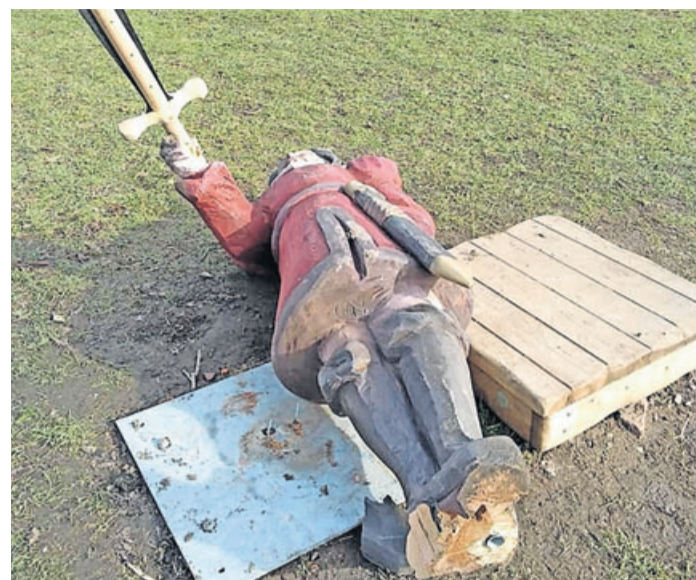
Die Figur ist aus der Verankerung gerissen und schwer beschädigt.

Bürgermeister Dominik Brasch und die Fraktionen verurteilen Zerstörungswut