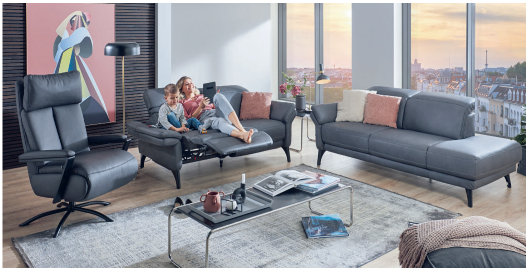
Polster Aktuell setzt mit seinen Möbeln Maßstäbe – sowohl beim Sitzkomfort wie auch im Design.