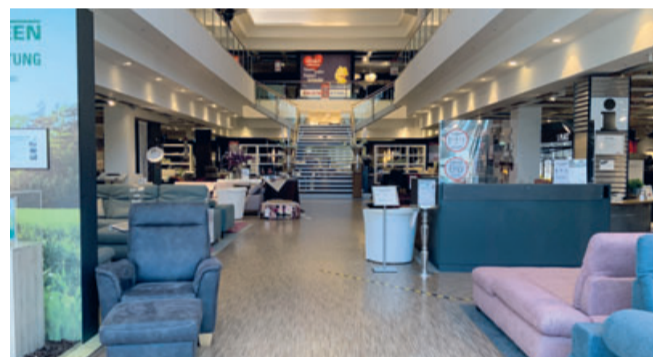
Unsere Ausstellung ist für Sie bereit: Lassen Sie sich von unseren Innovationen und Neuheiten begeistern.

Weil Kunden nur nach vorheriger Anmeldung beraten werden, ist sichergestellt, dass stets nur eine kleine Kundengruppe betreut wird. Insgesamt sind alle Polster Aktuell-Mitarbeiter für die aktuellen Maßnahmen und Abstandsregeln ausgebildet. Sie erklären die ergonomischen Vorteile und die Komfort-Plus Funktionen der Original Orthopädika Polstermöbel ohne die erforderlichen physischen Distanzregeln zu verletzen.