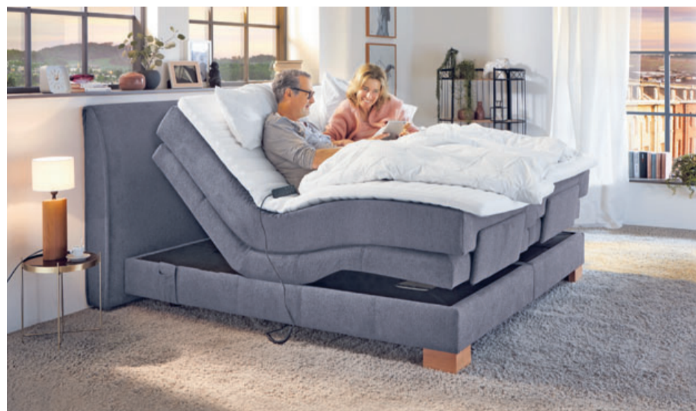
In einem Original Orthopädika Boxspringbett bereitet auch das entspannte Sitzen jeden Menge Vergnügen.