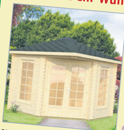
BLOCKHAUS INSRUCK 5-ECK HAUS Wandstärke 28 mm, Dach aus 16 mm nord. Fichte, N+F, ohne Fußboden 300x300 cm

Das passende Haus ist nicht dabei! Kein Problem, fragen Sie Ihr Wunschhaus einfach an, wir finden das sicherlich für Sie!