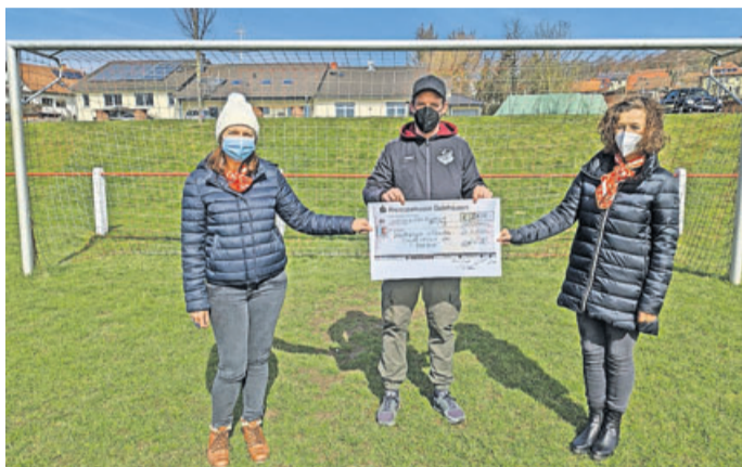
Das hat sich gelohnt: Die Scheckübergabe auf dem Sportplatz.

Region. Das hat sich gelohnt: Insgesamt 2617,67 Kilometer legten die erste und zweite Mannschaft der SG Distelrasen bei ihrer Laufchallenge für karitative Zwecke im Februar zurück. Nun konnte der Mannschaftsrat des Schlüchterner Fußball-A-Ligisten dem Malteser Kinder- und Jugendhospizdienst Main-Kinzig-Fulda einen Spendenscheck in Höhe von insgesamt 2650 Euro überreichen – strahlende Augen bei den Empfängern inklusive.