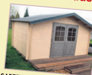
GARTENHAUS KUFSTEIN Wandstärke 34 mm, mit doppelter N+F, Dach aus Nut + Feder Massivholz, Vordach 40 cm

Salzb. 1 B 410 x T 410 cm 2249 € Salzb. 2 B 500 x T 445 cm 2599 € Salzb. 3 B 500 x T 500 cm 2849 € Salzb. 4 B 445 x T 445 cm 2499 €