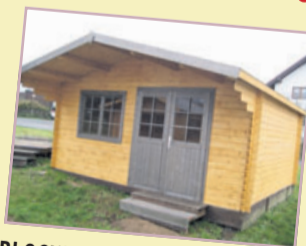
BLOCKHAUS SALZBURG Wandstärke 40 mm, Dach aus 19 mm nord. Fichte Massivholz N+F, inkl. Sturmsicherungen enthalten! Ohne Fußboden.

Salzb. 1 B 410 x T 410 cm 2249 € Salzb. 2 B 500 x T 445 cm 2599 € Salzb. 3 B 500 x T 500 cm 2849 € Salzb. 4 B 445 x T 445 cm 2499 €