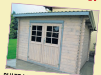
PULTDACHHAUS LINZ Wandstärke 28 mm, Vordach 20 cm, inkl. Dach und Fußboden aus nord. Fichte, Massivholz Nut + Feder, Sturmsicherung, Montagematerial und Unterleghölzer in KDI.

Kufst. 1 B 250 x T 250 cm 1049 € Kufst. 2 B 295 x T 250 cm 1149 € Kufst. 3 B 295 x T 295 cm 1249 € Kufst. 4 B 295 x T 400 cm 1449 € Kufst. 5 B 400 x T 295 cm 1399 € Kufst. 6 B 400 x T 400 cm 1699 €