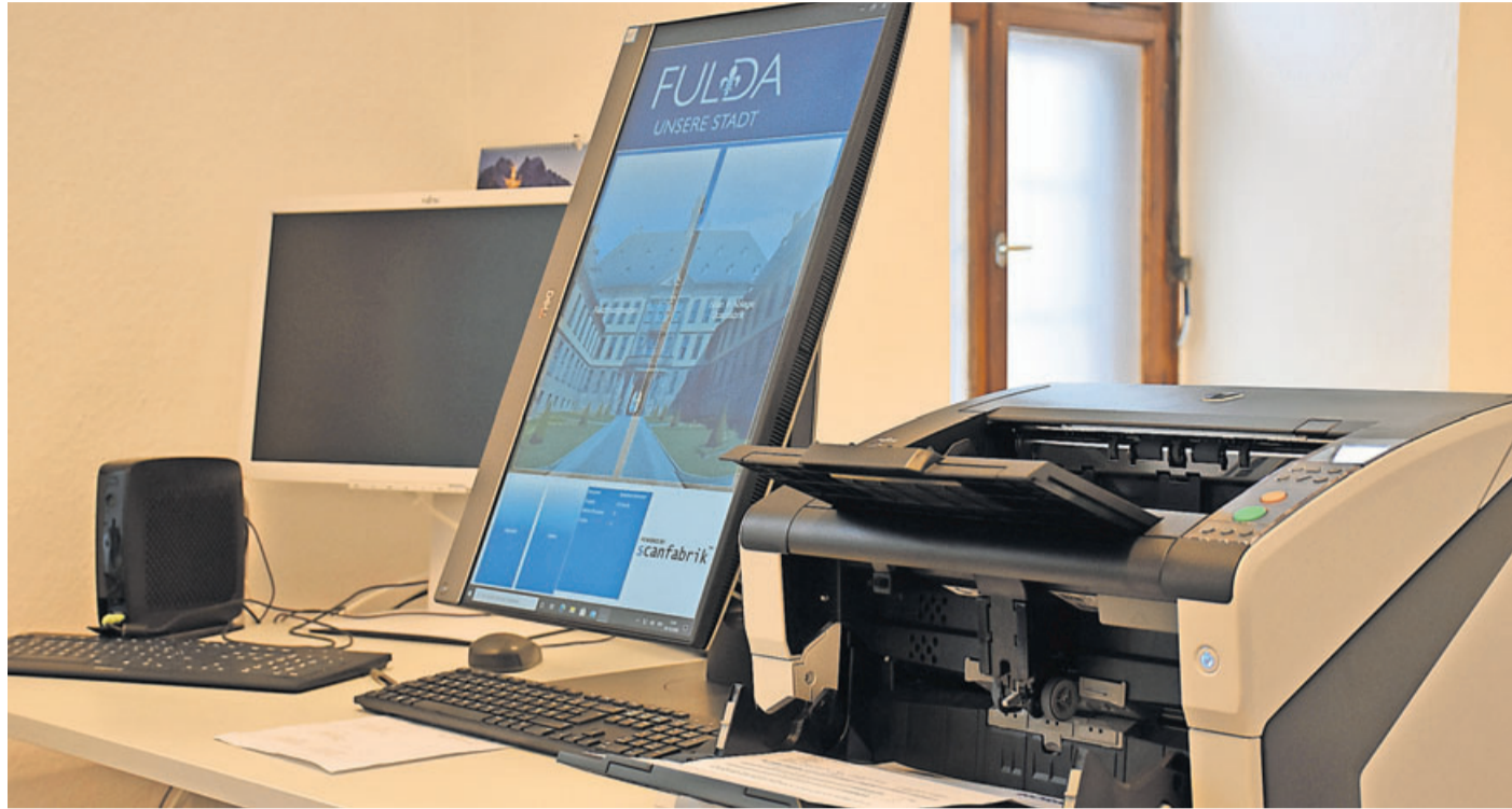
Die „Scanfabrik“ in der Poststelle der Stadt Fulda spielt eine zentrale Rolle bei der Digitalisierung von Verwaltungsabläufen.