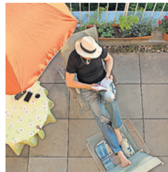
Bevor die Gartenmöbel herausgeholt und Balkonkästen bepflanzt werden, ist eine Inspektion sinnvoll.