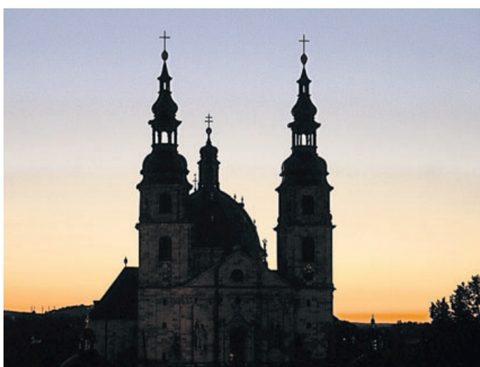
Der Dom in Fulda.

Beleuchtung von Dom und Orangerie ausgeschaltet