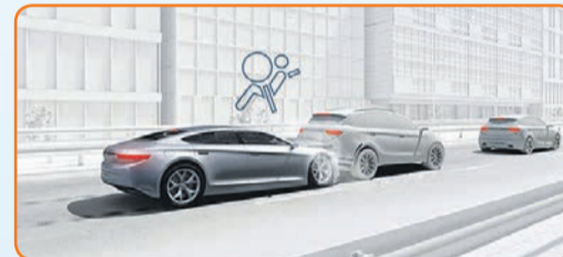
Airbag-Steuergeräte lösen in Millisekunden den Luftsack aus.

gen und das System stetig weiterentwickeln. Innerhalb von nur zehn Millisekunden kann das System einen Aufprall erkennen, nach weiteren 30 Millisekunden ist der Luftsack prall aufgeblasen und schützt die Insassen. Nach Auswertung der Bosch-Unfallforschung halfen Airbag-Steuergeräte, seit der Markteinführung weltweit etwa 90 000 Menschenleben zu retten.