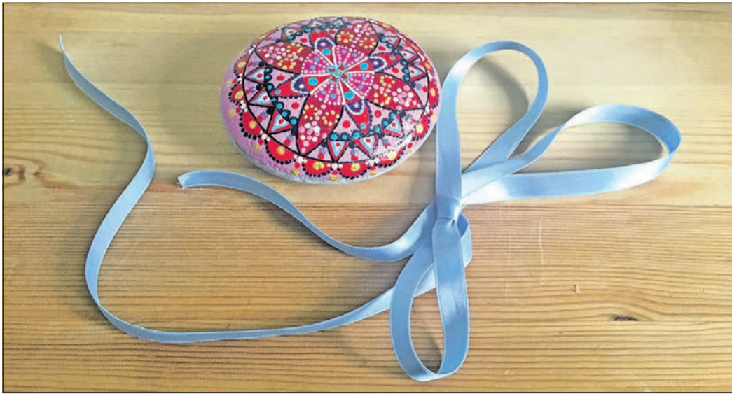
Das hellblaue Himmelsband.