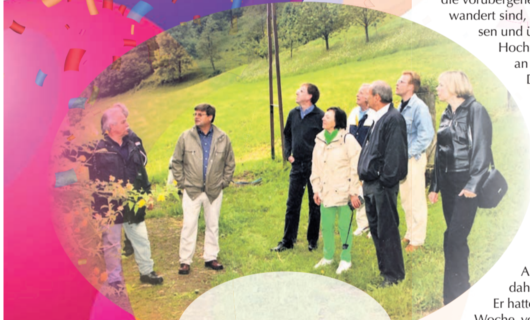
Betriebsausflug in den Schwarzwald 2005.

Der Hochtannus Verlag feiert Jubiläum. Seit 25 Jahren versorgt er die Leser seiner Zeitungen mit lokalen Informationen aus dem politischen, wirtschaftlichen und gesellschaftlichen Leben, aus Kultur und Sport, aus Schulen und Kirchen. Zehn Ausgaben für zehn Städte machen ihn heute mit einer Gesamtauflage von zusammen mehr als 145 000 Exemplaren zum Schwergewicht in der Zeitungslanschaft des Hochtannus- und Main-Taunus-Kreises von Friedrichsdorf ganz im Osten über Bad Homburg, Oberursel, Steinbach, Kronberg, Königstein, Eschborn, Schwalbach und Bad Soden bis nach Kelkheim im Westen. Über seinen Internet-Auftritt, die Taunus-Nachrichten, erreicht der Hochtannus Verlag Menschen weltweit, wie Reaktionen und Zuschriften nicht nur aus den europäischen Ländern, sondern auch aus den USA und Kanada, aus dem Nahen und Fernen Osten, ja sogar von den Fidschi-Inseln eindrucksvoll zeigen. Meist sind es Menschen aus dem Taunus, die vorübergehend irgendwo auf der Welt arbeiten oder in ferne Regionen ausgewandert sind, aber den Kontakt in die ursprüngliche Heimat nicht abreißen lassen und über das Geschehen im Taunus am Ball bleiben möchten. Dass der Hochtannus Verlag eine solche Erfolgsgeschichte schreiben würde, daran wagte 1996 niemand zu denken.