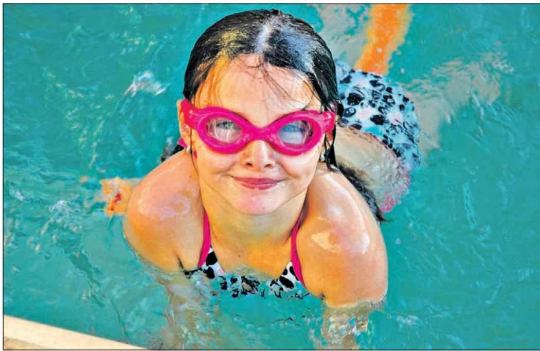
„Kindertaler“ möchte Kindern aus dem Lockdown Schwimmen beibringen.