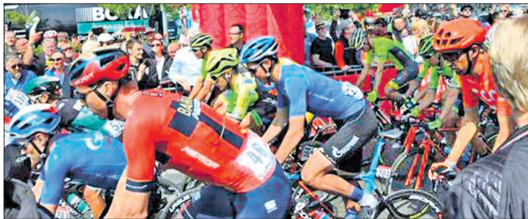
Die Veranstalter hoffen, dass der Radklassiker Eschborn-Frankfurt live stattfinden kann – mit Abstand.

des Radklassikers macht diese Aufgabe sehr komplex, aber wir haben in den vergangenen Wochen jeden einzelnen Bereich neu geplant. Denn wir wollen, dass die Jubiläumsausgabe stattfindet.“ Bevor die Profis des World-Tour-Rennens die rund 190 Kilometer lange Strecke auch über die Taunushöhen in Angriff nehmen, gehen wie immer die Hobby-Radsportler an den Start. Die Veranstalter haben die Startzeit für sie von derzeit 30 auf 90 Minuten ausgedehnt – als Schutzmaßnahme. Die Start- und Zielbereiche der Rennen liegen jeweils in Eschborn und in Frankfurt. In der Nähe von Eschborn gibt es schöne und sportlich interessante Radtouren für Hobby-Radsportler. Wer sie ausprobieren will, findet im Online-Angebot des Taunus Touristik Service (TTS) Vorschläge, attraktiv aufbereitet mit Karten, Infos und Fotos.