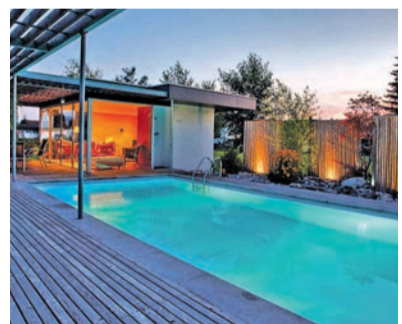
Stimmungsvolle Poolabende: Eine Unterwasserbeleuchtung gehört einfach dazu.

viduell geformt, beim Zuschnitt der Becken ist heute fast alles möglich“, erklärt Markus Reichert von Fluidra Deutschland. Einen günstigen Einstieg bieten Komplettbecken-Sets, die fix und fertig mit Filteranlage und Starterset angeliefert werden - der Badespaß kann direkt nach dem Einbau und der Befüllung beginnen. Unter www.duw-pool.de gibt es mehr Infos zu den typischen Pool-Bauweisen.