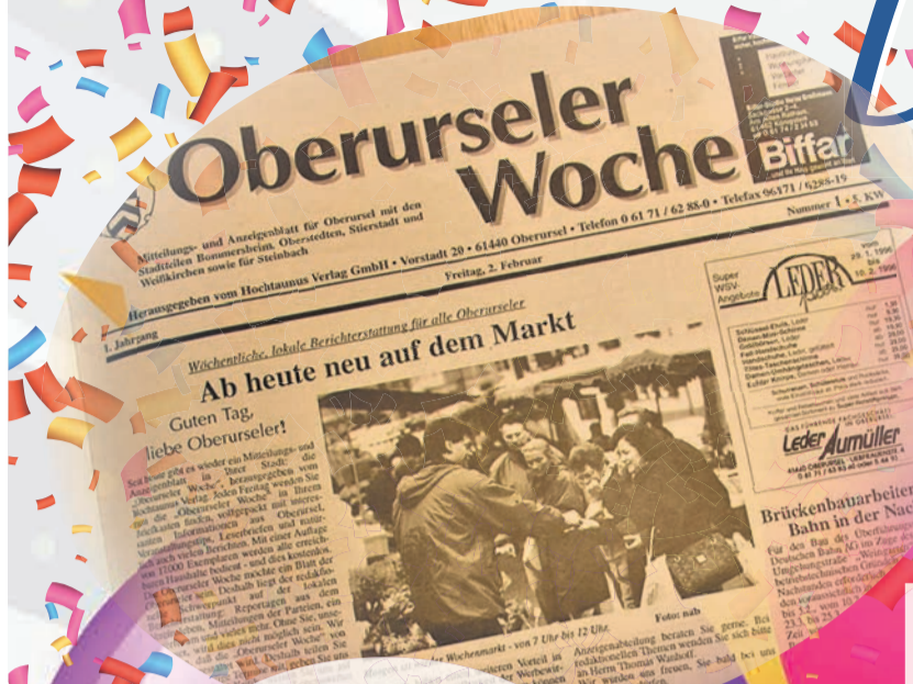
Erste Ausgabe Oberurseler Woche, 2. Februar 1996.