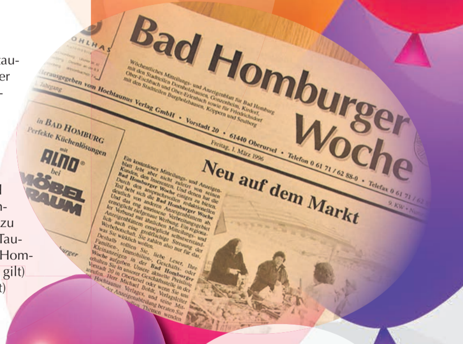
Erste Ausgabe Bad Homburger Woche, 1. März 1996.