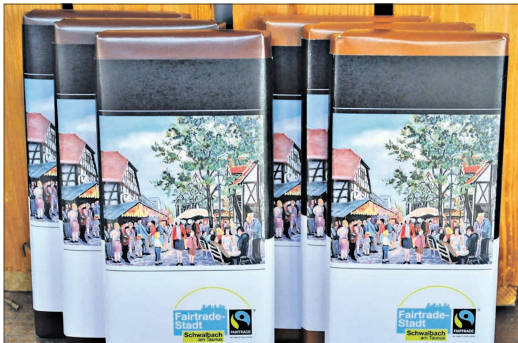
Die faire Stadtschokolade gibt es in den zwei Geschmacksrichtungen Bio-Vollmilch und Bio-Zartbitter.

die Kinderarbeit im Kakaoanbau hinterlassen einen bitteren Beigeschmack. Das gute Gewissen kauft man also gleich mit, denn hinter dem Fairtrade-Siegel stecken klare internationale Regeln: Bauern sind genossenschaftlich zusammengeschlossen, um gemeinsam stärker aufzutreten. Aufkäufer des Kakao müssen den Fairtrade-Mindestpreis zahlen, der die Produktionskosten deckt, sowie zusätzlich einen Aufschlag, die Prämie, die für Gemeinschaftsprojekte oder zur Einkommensverbesserung genutzt wird. Die Mitarbeitenden der Produzentennetze von Fairtrade in den Anbauländern beraten die Kooperativen in Bereichen wie Kindeswohl und Kinderrechte, Management und nachhaltige Anbaumethoden.