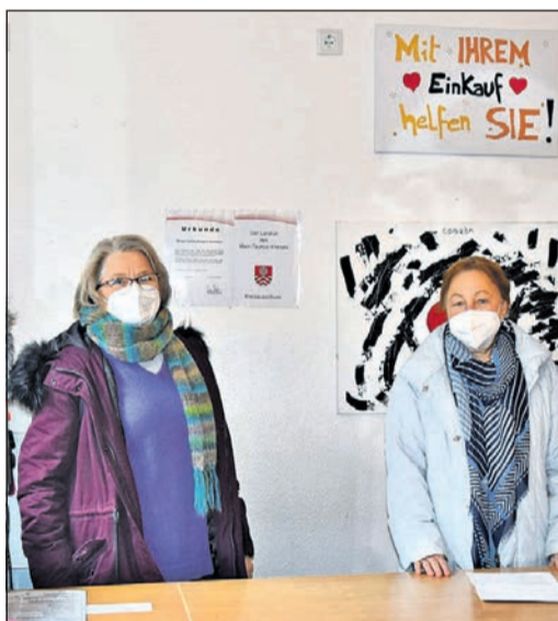
Ehrenamtliche Helferinnen des Vereins „Bürger helfen Bürgern“.

Dass sich die Eschborner Landfrauen als eine gut funktionierende Gemeinschaft verstehen, wird in Pandemie-Zeiten in Eschborn jetzt auch auf ganz besondere Weise sichtbar. Zum Start ins neue Jahr schenkte der Vorstand seinen Landfrauen einen hochwertigen, handgefertigten Mund-Nasen-Schutz, bestückt mit dem Landfrauen-Logo.