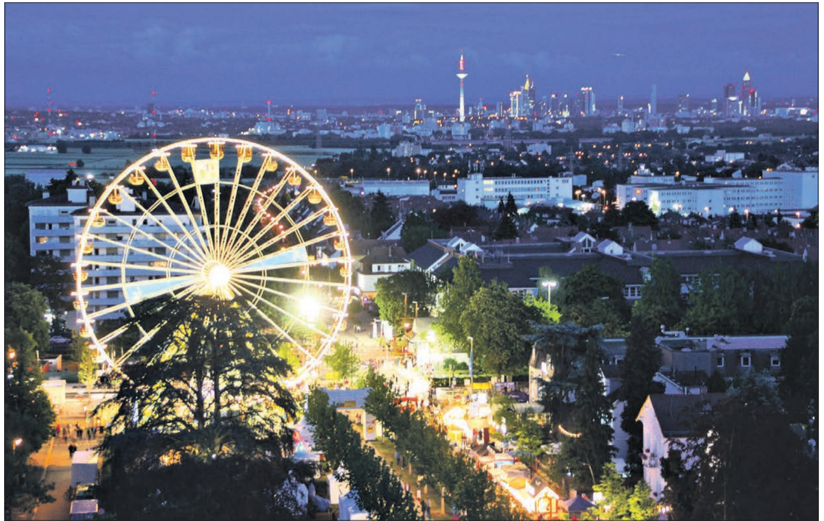
Die Attraktion und ein Wahrzeichen jedes Hessestags ist das Riesenrad, das 2011 über dem Brunnen in der Adenauerallee stand und seinen Fahrgästen einen unvergesslichen Blick über die Hessestagsstadt Oberursel bis in den Taunus hinein und über Frankfurt bot.