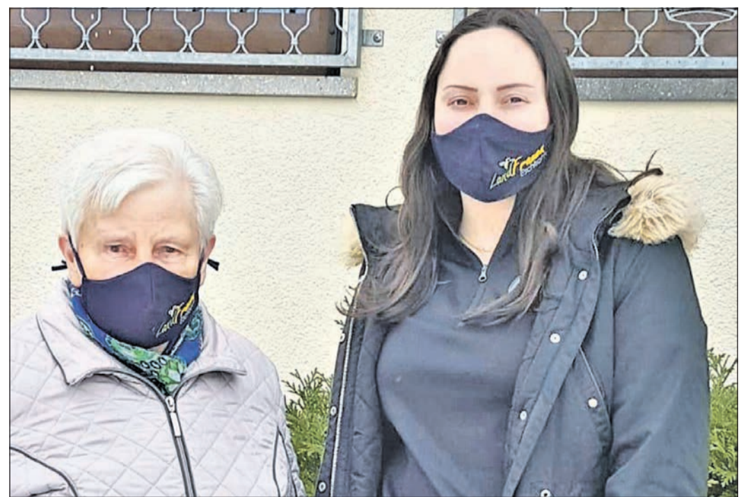
Maske mit handbesticktem Logo: Solch einen Mund-Nasen-Schutz besitzt jetzt jede Eschborner Landfrau.

Für eingesandte Manuskripte und Fotos wird keine Haftung übernommen.