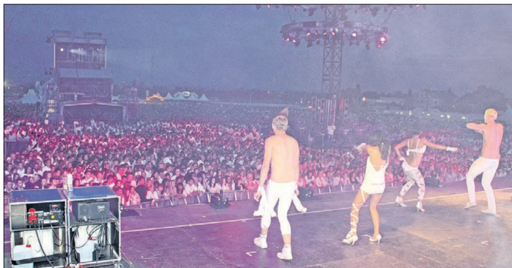
Zigtausende begeisterter Besucher tummelten sich wie hier bei der „Just-White-Party“ im Bommersheimer Feld, das zur schier endlosen Hessestagsarena geworden war.

Christian: Das Beste, was Oberursel je passieren konnte!