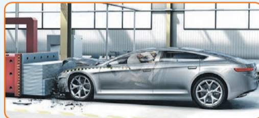
Airbag-Steuergeräte haben in den vergangenen 40 Jahren helfen können, viele Menschenleben zu retten.

(djd). Airbags sind in modernen Autos zu einer Selbstverständlichkeit geworden. Dabei gibt es die lebensrettenden Luftsäcke und ihre Steuergeräte erst seit 40 Jahren. Gemeinsam mit Daimler hat Bosch 1980 das weltweit erste elektronische Airbag-Steuergerät in die Serienfertigung gebracht. Seit dem Start der Serienproduktion konnte das Unternehmen über 250 Millionen Airbag-Steuergeräte ferti-