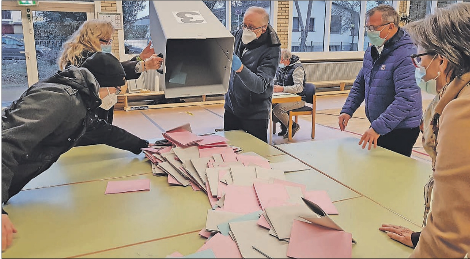
Spannend wird es bei der Auszählung: Zunächst werden die Urnen ausgeleert und die Stimmzettel sortiert.