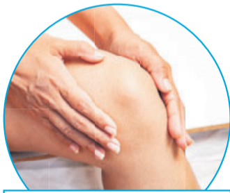
Rubaxx Cannabis CBD Gel enthält u. a. Menthol und Minzöl für beanspruchte Muskeln

Die Cannabispflanze rückt immer mehr in den Fokus der Öffentlichkeit. Besonders in dem nicht berauschenden Inhaltsstoff CBD (Cannabidiol) sehen Wissenschaftler großes Potenzial. Von der Apotheken-Qualitätsmarke Rubaxx gibt es ein Cannabis Gel mit ca. 600 mg CBD frei verkäuflich in der Apotheke (Rubaxx Cannabis CBD Gel).