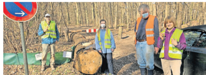
Aufbau des Amphibienschutzzauns an der Hochwaldstraße.

Während der Zaun aufgestellt ist, kontrollieren täglich, auch am Wochenende, Aktive, überwiegend Nabu-Mitglieder, die Länge inklusive aller Eimer, um eine Artenbestimmung vorzunehmen und die Tiere über die gefährliche Straße zu tragen, damit sie dann die Wanderung zu ihren Laichgründen fortsetzen können. Auf- und Abbau und die Betreuung wird jeweils von einer Person organisatorisch betreut. Zuvor wurden die