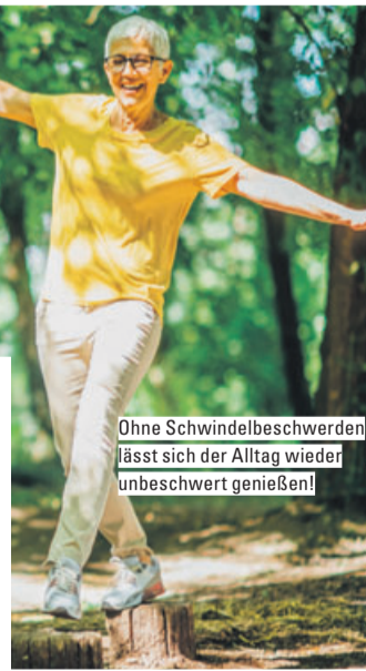
Ohne Schwindelbeschwerden lässt sich der Alltag wieder unbeschwert genießen!

Der Dual-Komplex in Taumea enthält zwei natürliche Arzneistoffe: Anamirta cocculus kann laut Arzneimittebild Schwindelbeschwerden lindern. Gelsemium sempervirens setzt laut Arzneimittebild bei den Begleiterscheinungen wie Kopfschmerzen und Übelkeit an. Zudem sind die Arzneitropfen Taumea gut verträglich – und das ohne bekannte Neben- oder Wechselwirkungen mit anderen Arzneimitteln. Wichtig: Bei akuten, plötzlichen Schwindelbeschwerden sollte ein Arzt die Ursache abklären.