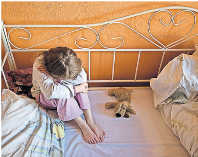
Ängste, Bauchschmerzen, Rückzug: All das sind Anzeichen dafür, dass Kinder mit einer Situation überfordert sind.

diesen Strategien nicht an ihr Kind heranzukommen, oder beobachten sie eine sich verschlechternde Symptomatik, sollten sie sich an den Kinder- und Jugendarzt wenden. Auch professionelle therapeutische Hilfe kann eine Möglichkeit sein. In wieweit die Einschränkungen der Corona-Pandemie auch langfristige Auswirkungen haben werden, ist für Prieß nicht vorhersehbar. Was aber klar ist: „Das Jahr hat bei allen deutliche Spuren hinterlassen. Bei so vielen Menschen merke ich, wie sehr sie über ihre Grenzen gegangen sind – das habe ich in diesem Ausmaß noch nicht gesehen.“