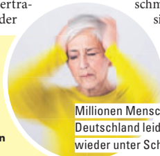
Millionen Menschen in Deutschland leiden immer wieder unter Schwindel

Der Wirkstoff Anamirta cocculus in Taumea wurde schon von Seefahrern im 16. Jahrhundert erfolgreich bei Schwindel eingesetzt. Die Heilkraft des zweiten Wirkstoffs in Taumea, Gelsemium sempervirens, wurde bereits von den Urvölkern Nordamerikas geschätzt. Mit diesem Dual-Komplex werden sowohl Schwindelbeschwerden als auch deren Begleiterscheinungen wirksam bekämpft.