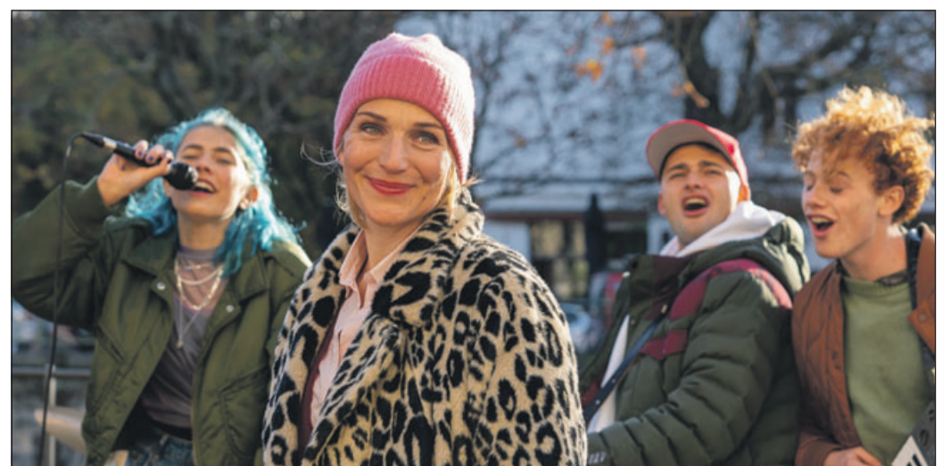
Fritzie ist eine brillante Vermittlerin und schlichtet den Streit der Schulband mit einer jungen Kollegin auf charmante Weise.