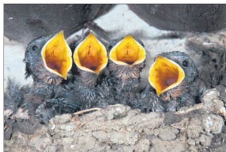
Rauchschnalbenjunge im Nest.

Mehlschnalben nutzen als ortstreuere Tiere gerne alte vorhandene Nester und bessern sie mit frischem Lehm aus. In Städten fehlen jedoch oft Lehmstellen als Baugrundlage. „Offener, feucht gehaltener Boden hilft den Schwalben, ihre alten Nester zu ersetzen“, erklärt Sommerhage. „Wo dies nicht möglich ist, können unter Vorsprünge in mindestens 2,5 Meter Höhe Kunstnester angebracht werden.“