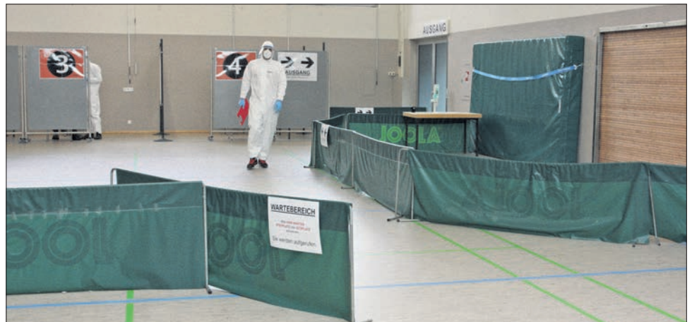
Das Testzentrum nutzt die Absperrungen, die die Tischtennispieler sonst bei Turnieren verwenden.