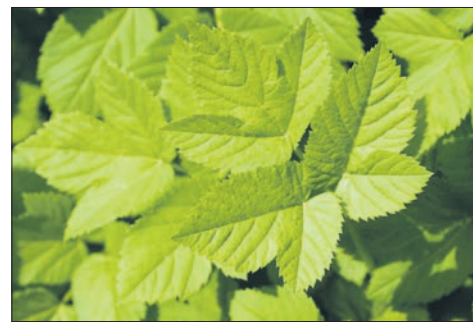
Als Salat, in Suppen oder als „Spinat“: der Giersch ist kulinarisch vielfältig.

Wie dieses gesunde Kraut zu seinem Namen kam, weiß sie nicht. Allerdings hat sie unzählige Namen dafür gefunden. So bedeutet der lateinische Name „Aegopodium“ Ziegenhuf, was sich wohl auf die Ähnlichkeit der Blätter mit einem Ziegenfußabdruck bezieht. Deshalb wird er auch „Geißfuß“ genannt. Am lustigsten findet van Krüchten die Bezeichnung „Witscherlenwetsch“ aus dem Ulmer Raum.