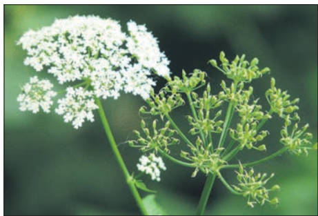
Die Blüten des Giersch können als Gewürz genutzt werden.