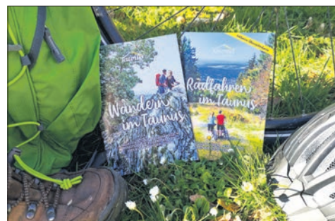
Neue Broschüren übers Wandern und Radfahren im Taunus.