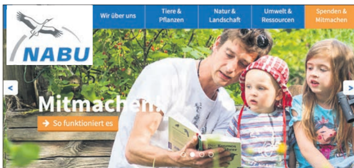
Der NABU ruft zur Zählung von Gartenvögeln auf – gerade auch für Familien mit Kindern eine schöne Freizeitbeschäftigung.

Die Chancen stehen gut, bei der Zählung den ersten öffentlich gewählten Vogel des Jahres, das Rotkehlchen, zu sehen: „Fast jeder Garten hat seinen eigenen Jahresvogel“, so der Landesvorsitzende. „Im langjährigen Mittel wird das Rotkehlchen innerhalb einer Stunde in fast jedem zweiten Garten entdeckt. Die Art steht