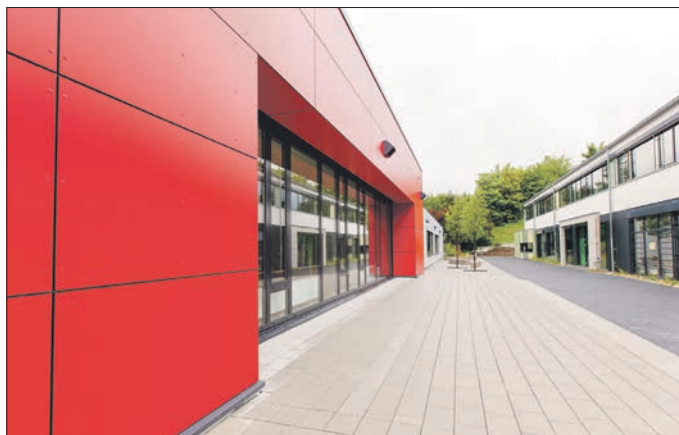
An den Eppsteiner Schulen testen sich die Kinder seit Montag selbst.

bis für jedes Kind die entsprechende Erlaubnis vorliege und es tatsächlich zweimal pro Woche getestet sei. Aber er lohne sich, ist der Schulleiter überzeugt, „wenn wir auf diese Weise die Schule offen halten können“, meint der Rektor mit Blick auf die Inzidenz im Main-Taunus-Kreis. Am Montag lag sie bei 130 und am Dienstag bei 128. Bei Redaktionsschluss stand noch nicht fest, ab welchem Inzidenzwert Schulen wieder schließen müssen: Bisher liegt der Grenzwert bei 200, sollte das neue Infektionsschutzgesetz in Kraft treten, sinkt die Inzidenz auf 165.