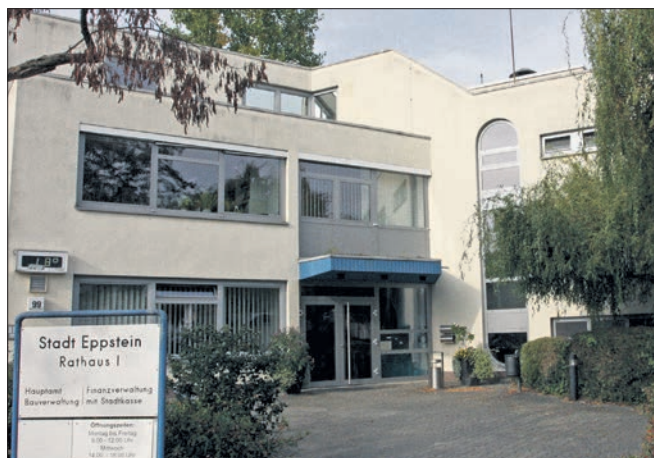
Normalerweise tagen die Stadtverordneten im Blauen Saal im Rathaus I, dem Sitz der Stadtverwaltung und der Gremien.

Valterweg 13 · 65817 Eppstein-Bremthal Telefon 0 61 98 - 58 99 90 E-Mail: info@bremthaler-moebel.de