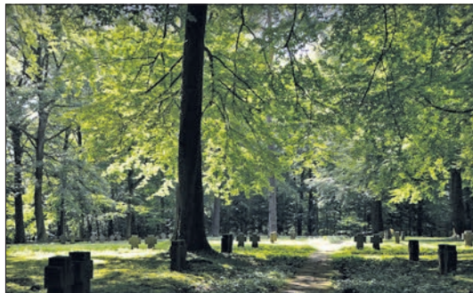
Stille auf dem Waldfriedhof.

Wie auch zu Beginn der Pandemie sind die Trauerangebote von den Einschränkungen betroffen, deshalb bietet der Horizon-