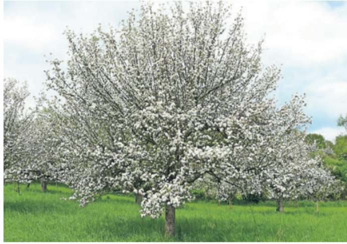
Prächtiger Apfelbaum in voller Blüte.

Beispiel die Hornisse, nutzen Spalten in der Rinde als Zuhause. Die Bestäubung der Obstblüten wäre ohne den unermüdbaren Einsatz von Wild- und Honigbienen sowie Hummeln fast unmöglich. Auch die Wiese unter den Bäumen kann bei extensiver Nutzung ohne Einsatz von Düngemitteln eine große Artenvielfalt an Blumen und Gräsern zutage bringen, die wiederum vielen heimischen Insektenarten Nahrung und Zuhause bieten.