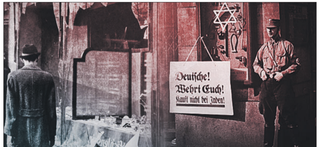
Direkt nach der Machtübernahme der NSDAP 1933 beginnt der offene Terror gegen die jüdische Bevölkerung (rechtes Bildmotiv), der in der Reichspogromnacht vom 9. auf den 10. November 1938 (Bild links: zerstörtes jüdisches Geschäft) einen erschütternden Höhepunkt erreicht.

den, und darüber, dass sie immer das Leben als Frau an seiner Seite geführt und ihr eigenes Leben versäumt hat. Sie selbst sind eine erfolgreiche Schauspielerin. Wie darf man sich das vorstellen, an Ihrer Seite zu stehen? Mein Mann kommt aus einer Künstlerfamilie. Theater, Film, Schauspiel, Regie waren ihm von klein auf vertraut. Wir haben uns sehr jung kennengelernt, wir haben uns gemeinsam entwickelt und nicht auseinandergelebt und sind nun gemeinsam alt geworden. Dennoch sind wir zwei geblieben und nicht eins geworden. Sie spielen im Film mit Peter Simonischek und Thomas Thieme. Was verbindet Sie mit den beiden Schauspielern? Meine beiden Kollegen kommen vom Theater und arbei-