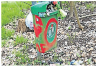
Ein Fall für den Mängelmelder.

Zeit geschlossenen Restaurants. Das aber führt zur nächsten Krise. Denn während wir uns bald wieder länger und gemeinsam draußen aufhalten können und wollen, leidet derzeit dieses Draußen unter den Müllbergen, die durch „to-go“ entstehen. Gerade die großen Ketten setzen fast immer ausschließlich auf Einwegverpackungen und wenn die in den öffentlichen Grünanlagen, auf und an den Wegen und Plätzen landen, sieht es erstens miserabel aus und zweitens zersetzen sie sich langsam und in Mikroplastik. Für Teile dieser Grün-