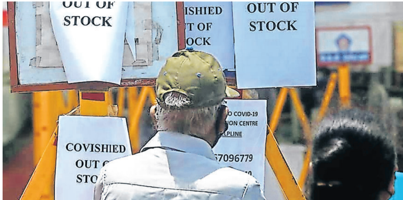
In Indien fehlt es vielerorts an Impfstoff.

Redaktion: (06051) 833-202 E-Mail: redaktion@bote.de Zustellung: (06051) 833-299 E-Mail: zustellung@bote.de Anzeigen: (06051) 833-244 E-Mail: anzeigenabteilung@bote.de Internet: www.bote.de