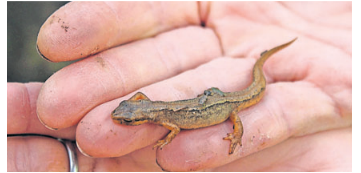
Teichmolch auf dem Weg zum Feuchtgebiet.

Besonders erfreut sind die ehrenamtlichen Amphibienbetreuer darüber, dass 301 Mol-