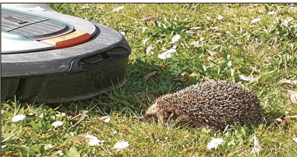
Die Beiden werden keine Freunde.