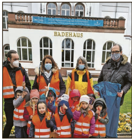
Mit Eimern und Müllsäcken bewaffnet waren die Kinder der Kita „Am Hübenbusch“ im gesamten Stadtgebiet im Einsatz.