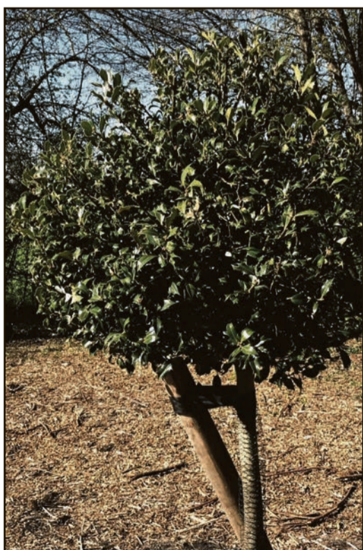
Stechpalme ( Ilex aquifolium ) im Arboretum

Hessen (bs) – Sie ist mit ihren leuchtend roten Beeren als Schmuckreisig beliebt: Die Stechpalme ( Ilex aquifolium ) ist Baum des Jahres 2021.