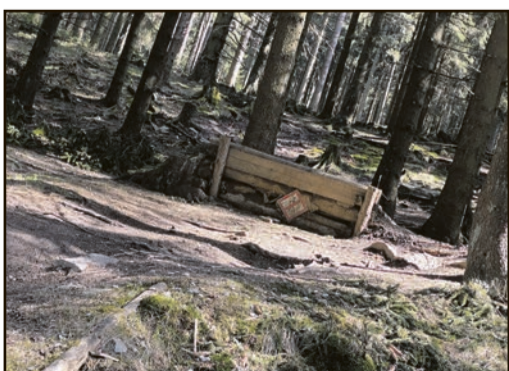
Downhill-Strecke vom Feldberg nach Schmitt-Oberreifenberg