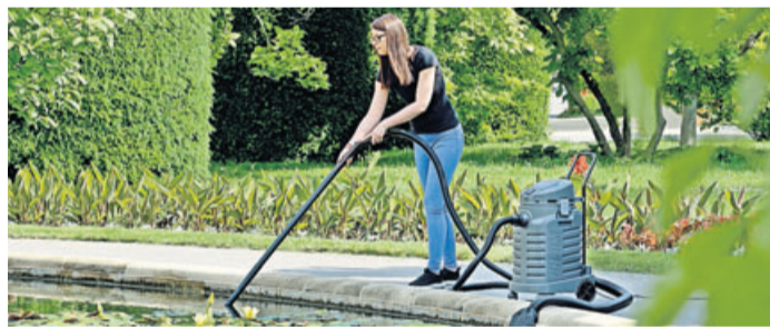
Neben einem gut aufeinander abgestimmten Pumpen- und Filtersystem kann auch ein Schlammabsauger für klares Wasser im Gartenteich sorgen.

Ein sorgsam angelegter Teich ist ein anziehender Blickpunkt in jedem Garten und eine Wohlfühlzone für die Besitzer. Mit einer Sitzzecke in Teichnähe kann man beim sanften Plätschern eines Wasserspiels herrlich entspannen. Gleichzeitig gibt das Feuchtbiotop zahlreichen Tieren wie Insekten, Fröschen oder Fischen Lebensraum. So richtig genießen lässt sich das Naturparadies aber nur mit klarem, sauberem Wasser. Doch oft nehmen Schwebelagen überhand und sorgen für eine grünliche Wassertrübung. Verantwortlich dafür ist meist