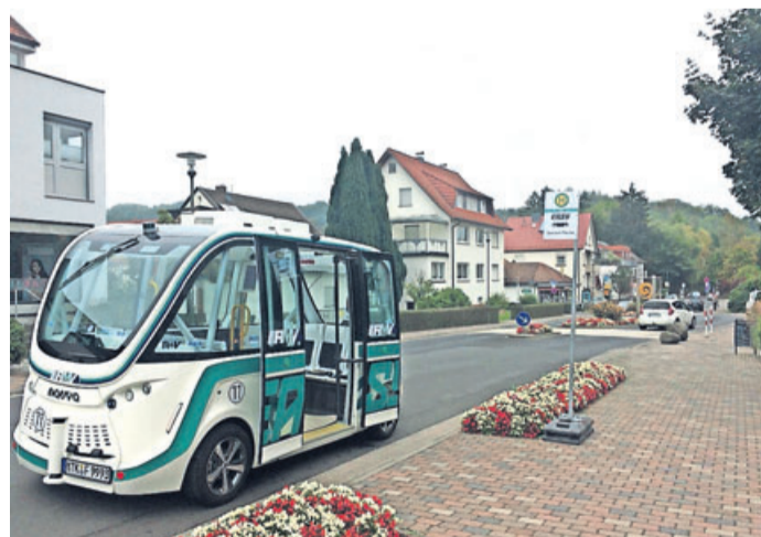
Das autonome Fahrzeug des Pilotprojekts EASY.

Pilotprojekt zum Test von autonomen Fahrzeugen läuft in Bad Soden-Salmünster