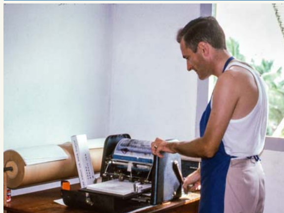
Bei der Vervielfältigung des Königreichsdienstes im Zweigbüro in Abidjan (Côte d'Ivoire)