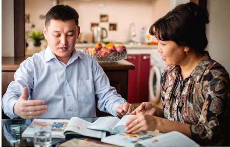
Ein Mann zeigt Demut und Liebe, indem er Arbeiten im Haushalt übernimmt und seiner Familie hilft, einen starken Glauben zu entwickeln (Siehe Absatz 11, 13)

kein ‚echter Mann‘ ist und seine Frau nicht im Griff hat.“ Wenn die Leute in deiner Umgebung so eingestellt sind, denk daran: Jesus hat seinen Jüngern die Füße gewaschen, obwohl das als Sklavenarbeit galt. Einem guten Ehemann und Vater geht es nicht darum, dass er gut dasteht, sondern dass seine Frau und seine Kinder sich gut fühlen. Welche Eigenschaft außer Demut ist noch wichtig?