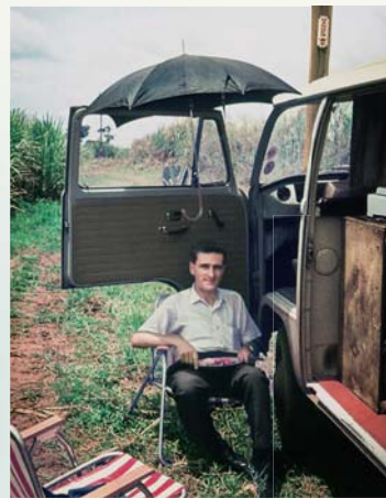
Auf „Safari“ in Uganda