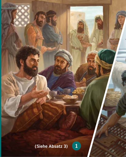
(Siehe Absatz 3) 1

Könnte heute etwas Ähnliches Anstoß erregen?