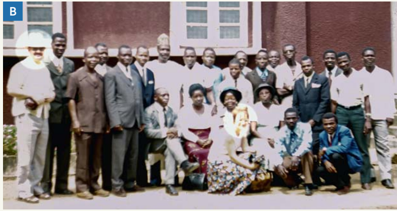
A. 1973 traf ich mich in Nigeria mit Brüdern aus Kamerun