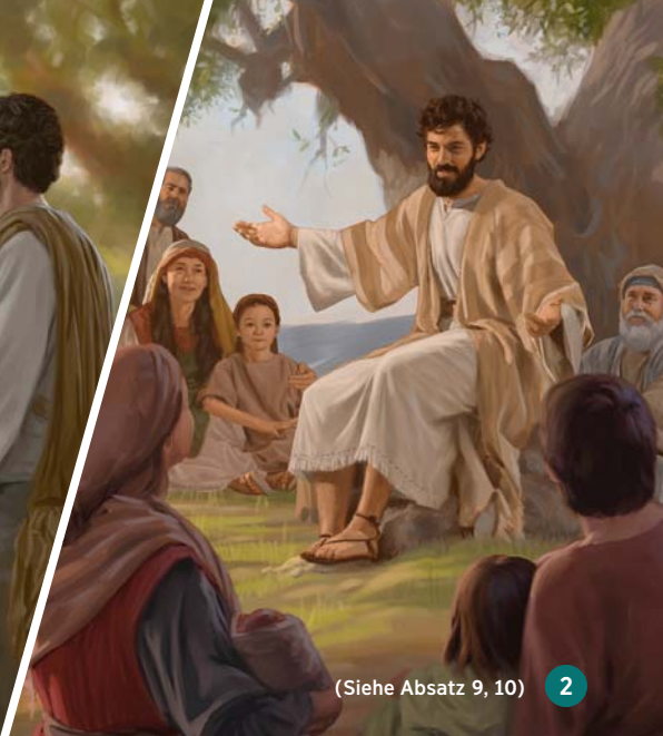
(Siehe Absatz 9, 10) 2

auseinanderzusetzen. Ein gründlicher Faktencheck schützt davor, von Vorurteilen und Gerüchten beeinflusst zu werden.