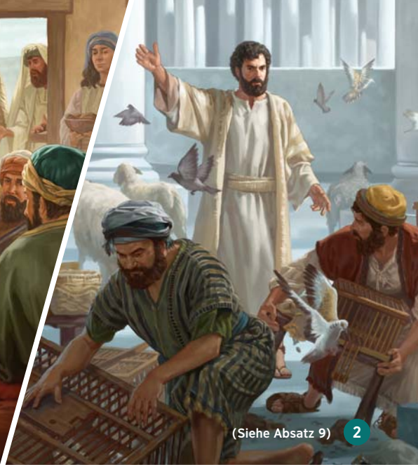
(Siehe Absatz 9) 2

9 Was sagt die Bibel? Wie die Bibel voraussagte, würde der Messias von Eifer für Jehovas Haus erfüllt sein (Ps. 69:9; Joh. 2:14-17). Aus diesem Eifer heraus entlarvte Jesus falsche religiöse Lehren und Praktiken. Die Pharisäer zum Beispiel glaubten an eine unsterbliche Seele; Jesus lehrte, dass die Toten schlafen (Joh. 11:11). Die Sadduzäer leugneten die Auferstehung; Jesus auferweckte seinen Freund Lazarus (Joh. 11:43, 44; Apg. 23:8). Die Pharisäer sagten, alles werde durch das Schicksal oder durch Gott gelenkt; Jesus lehrte, dass die Menschen selbst entscheiden können, ob sie Gott dienen wollen oder nicht (Mat. 11:28).