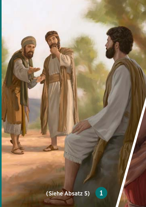
(Siehe Absatz 5) 1