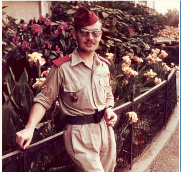
In meiner Zeit beim Militär