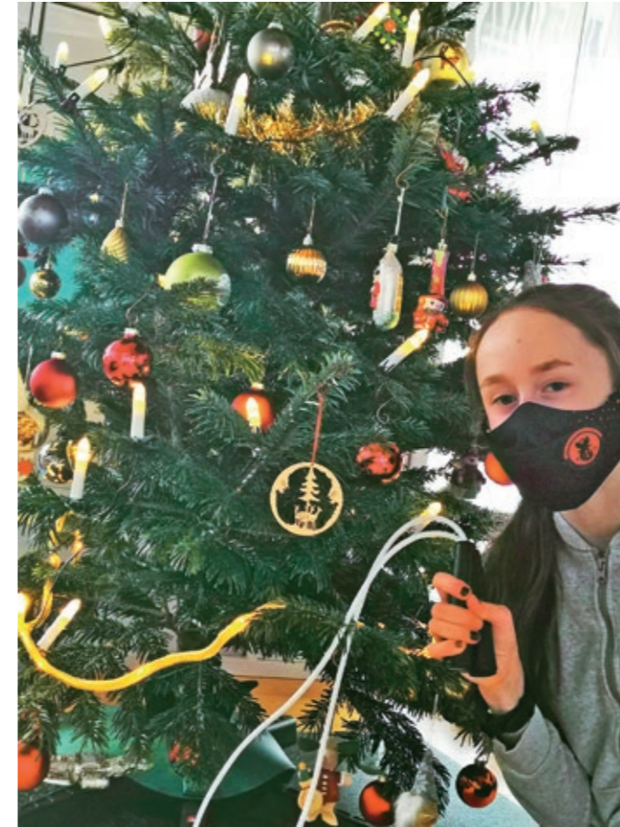
TG Hanau Jugendausschuss kommt zu Hilfe