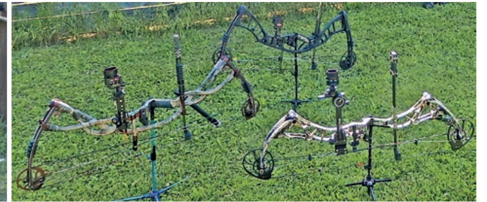
Linkes Bild: Traditioneller Bogen (hinten), Langbogen (zweiter von vorn) und Recurve-Bogen (vorne). Rechtes Bild: Compound-Bögen.

Der Langbogen des Mittelalters besteht meist aus Ebenholz, das hohe Zug- und Stauchkräfte aufnehmen kann. Der moderne Langbogen besteht meist aus laminierten Holzstreifen oder mit auf- oder eingelegten Glasfaserlaminaten und Kohlenstofffasern. Er hat keine Pfeilaufgabe in einem Schussfenster, sondern der Pfeil wird über den Handrücken der Bogenhand aufgelegt. Der Recurvebogen hat Wurfarme, die im entspannten Zustand vom Schützen wegweisen. So speichert der Recurve-Bogen mehr Energie als der Langbogen. Die anliegende Sehne dämpft außerdem den Handschock nach dem Schuss. Während beim Langbogen die Bogensehne frei schwingt, liegt sie beim