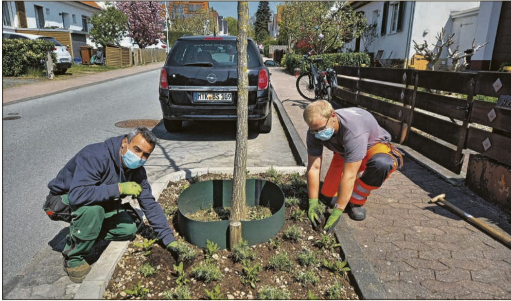
Neubepflanzung der Baumringe durch Mitarbeiter der Stadtgärtnerei. Besondere Stauden sollen die Stadt bienenfreundlicher machen.

Bad Soden (bs/Sc) – Für Viele ist es nicht auf den ersten Blick erkennbar, aber in Bad Soden werden erhebliche Anstrengungen unternommen, damit im Stadtgebiet mehr Blumen und Wildstauden blühen können.