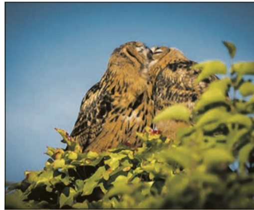
Jedes Jahr brütet ein Uhupärchen im Turm des Hundertwasserhauses.

Bad Soden (Sc) – Dass das Hundertwasserhaus in Bad Soden nicht nur eine bemerkenswerte Architektur besitzt, haben auch die Uhus seit vielen Jahren bemerkt. Der Hundertwasserturm bietet nicht nur ein besonderes Wohnambiente für menschliche Bewohner, sondern auch ein Bad Sodener Uhupaar hat sich auf diesem geschmackvollen und begehrten Wohnquartier niedergelassen.