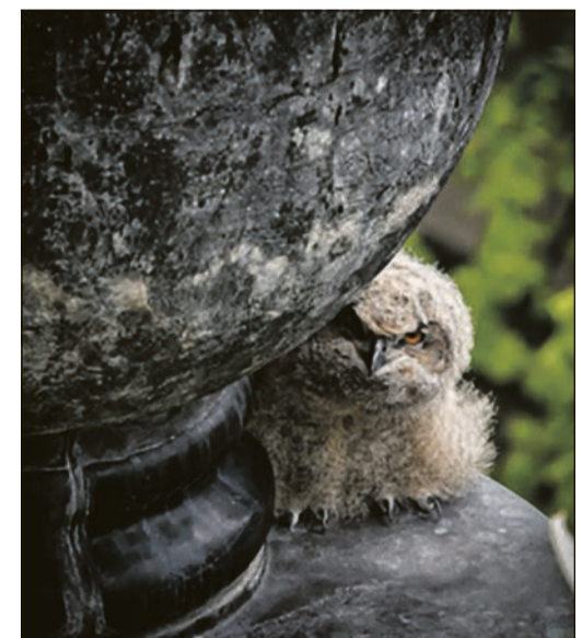
Wer guckt denn da so neugierig um die Ecke?

Auch in diesem Jahr ziehen die Altvögel wieder drei Junge auf, die an manchem Abend gerne mal – gemeinsam mit ihren Eltern – von der Kante des Turmes herunterschauen. Seit 2014 wurden damit auf dem Turm des Hundertwasserhauses insgesamt 24 junge Uhus großgezogen.