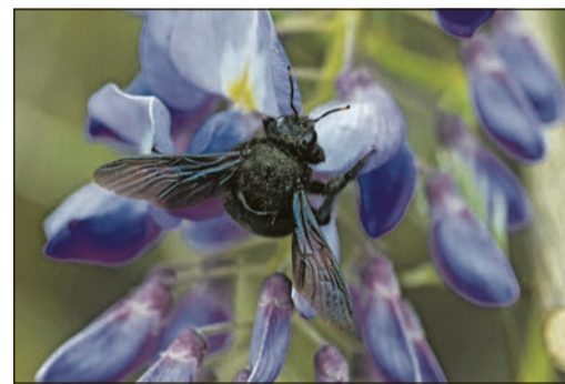
Die seltene Holzbiene freut sich über die bienenfreundliche Beetgestaltung.

Torsten Roller, Chef der Bad Sodener Stadtgärtnerei. „Die Neuanlage dieser Flächen und die Mahdumstellung bedingen anfangs einen hohen Pflege- und Kontrollaufwand“. So müsse unter anderem das gemähte Grün immer entfernt werden, damit der Nährstoffhaushalt stabil bleibt. Dafür wurde extra ein Schlepper mit Sammelmähwerk angeschafft. Selbst unter diesen Voraussetzungen könne aber niemand garantieren, dass sich alle Flächen wie gewünscht entwickeln, weil Standortfaktoren wie der Nährstoffhaushalt und die Bodenart nur begrenzt beeinflusst werden können. „Für eine möglichst erfolgreiche Bestäubung ist die Artenvielfalt der Insekten von großer Bedeutung“, erklärt Bürgermeister Dr. Frank Blasch die Anstrengungen der Stadt Bad Soden. So arbeiten die städtischen Gärtner eng mit den Naturschutzverbänden vor Ort zusammen – vor Kurzem wurden im Ökologischen Lehrpark Rohrwiese deshalb drei Inseln mit Stauden und Wildblumen durch den