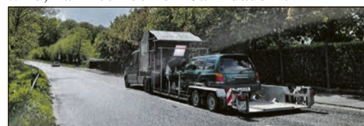
Ab geht die Fahrt durch den Main- und Hochtaunuskreis.

Wer sich schon jetzt auf die baldige Ausstrahlung und Szenen aus der vertrauten Gegend freut, muss sich allerdings etwas gedulden. Bis der Krimi mit dem Arbeitstitel „Morgengrauen“ allerdings in der ARD ausgestrahlt wird, kann es noch ein Jahr dauern.