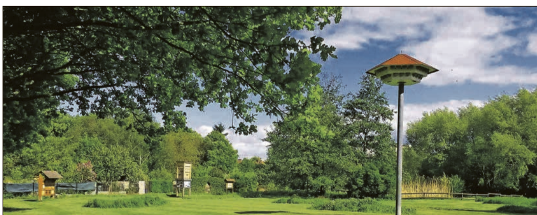
Ein Blick auf den Lehrpark Rohrwiese zeigt die Vielfalt der dieser Stelle vertretenen Flora und Fauna.

Da wäre zum einen der Fledermausturm, der den dämmerungsaktiven „Flattermännern“ als willkommenes Sommerquartier dient. Auch das Wildbienenhotel ist stets bewohnt und bietet damit den verschiedenen und seltenen Wildbienenarten eine artgerechte Heimat. Außerdem steht auf der Rohrwiese auch ein Schwalbenhaus, wo interessierte