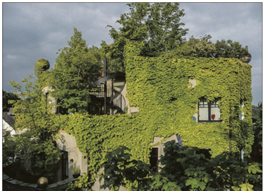
Das Zuhause von derzeit drei jungen Uhus: das Hundertwasserhaus in Bad Soden