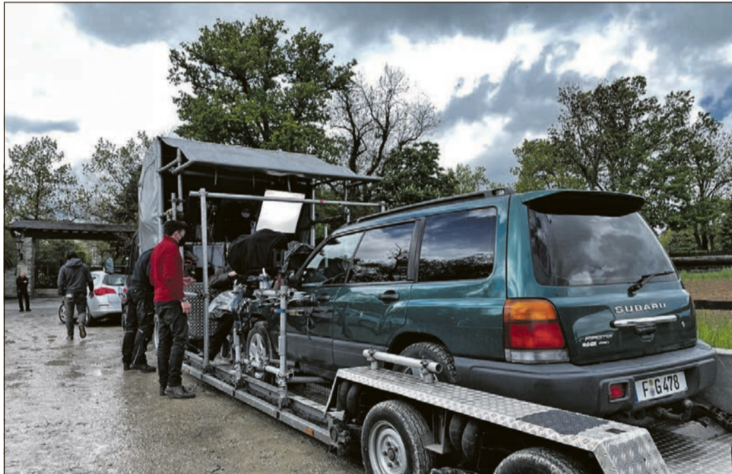
Aufgeladen und weggebracht - ein Tatfahrzeug wird sichergestellt!